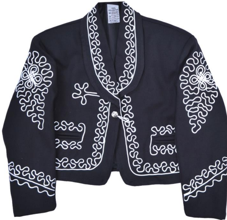
Anexo 5 60 (Saco de charro)