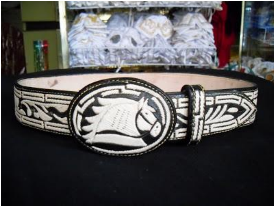
Anexo 8 63 (Cinturón de charro)