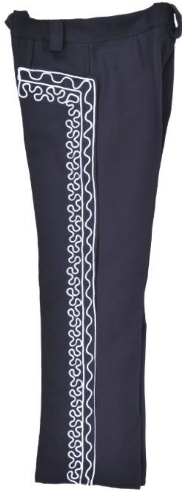
Anexo 9 64 (Pantalón de charro)