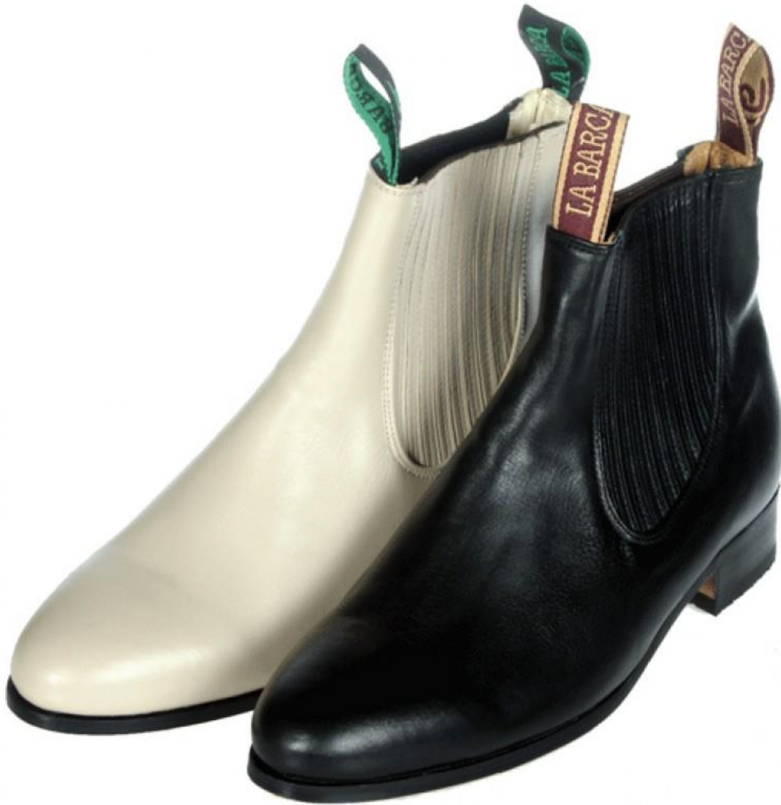
Anexo 10 65 (Botines)