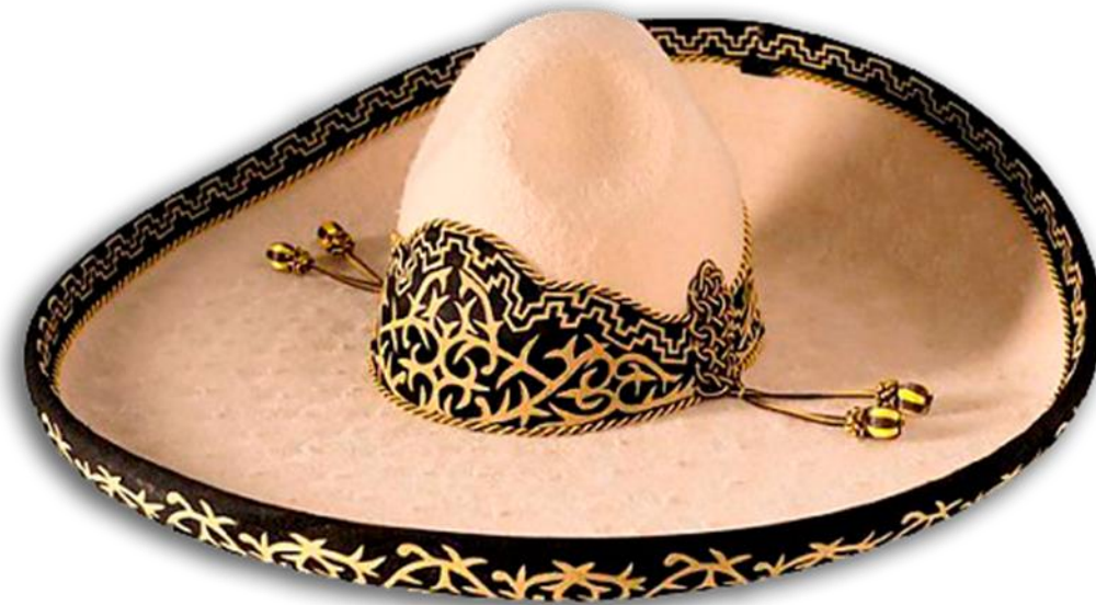
Anexo 4 59 Sombrero de charro