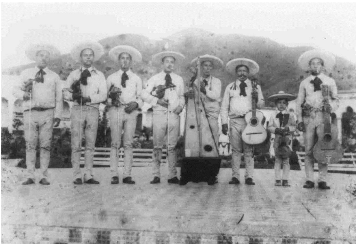
Anexo 11 66 (Mariachi Vargas de Tecalitlan)