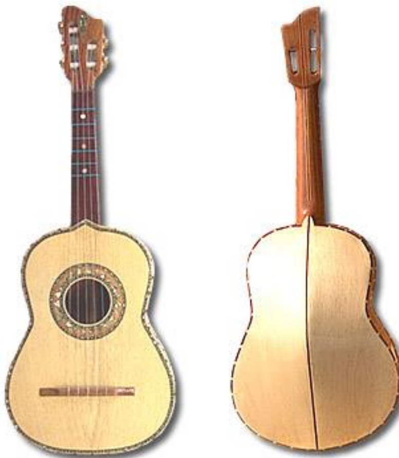
Anexo 1: Vihuela Mexicana 56