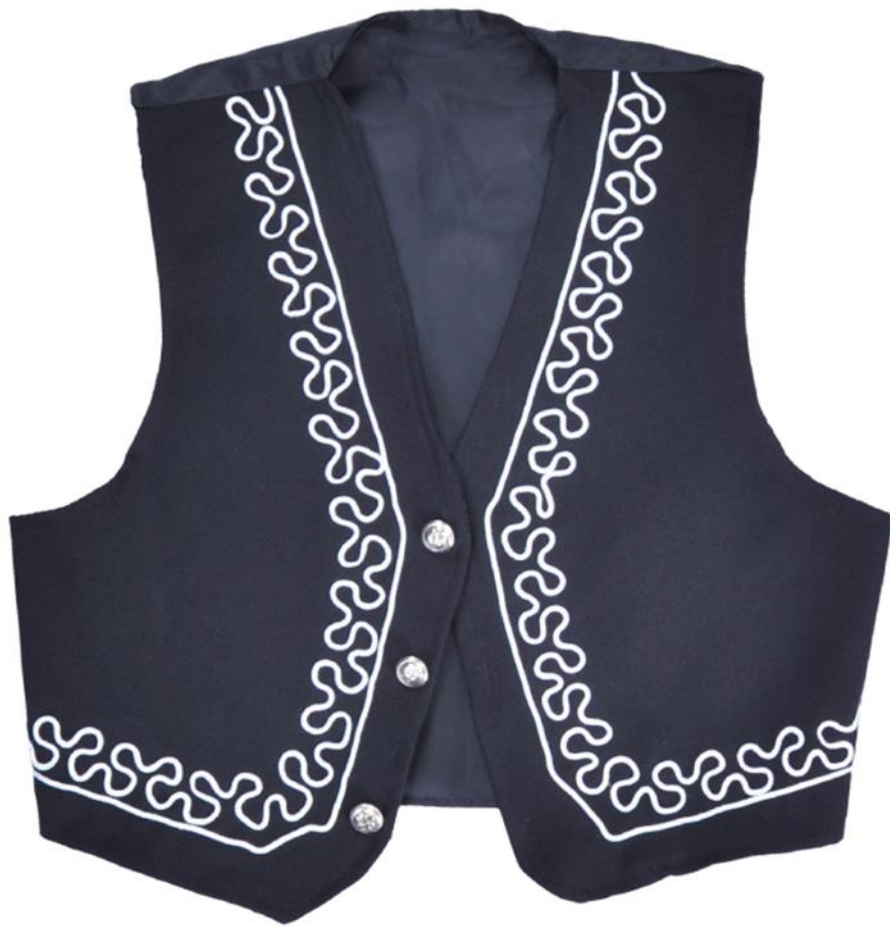
Anexo 6 61 (Chaleco de charro)