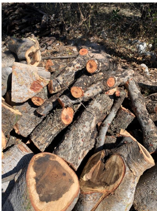
Imagen 22. Troncos de Ahuacastle. Autoria propia, marzo 2019.