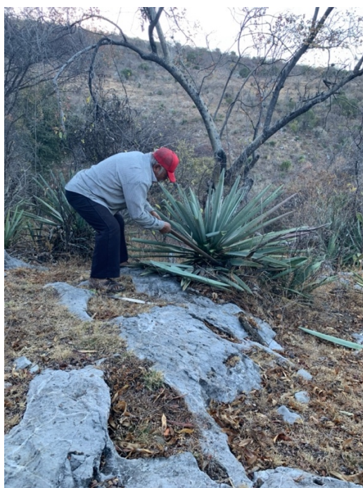
Imagen 18. Maestro mezcalero cortando maguey. febrero 2020.