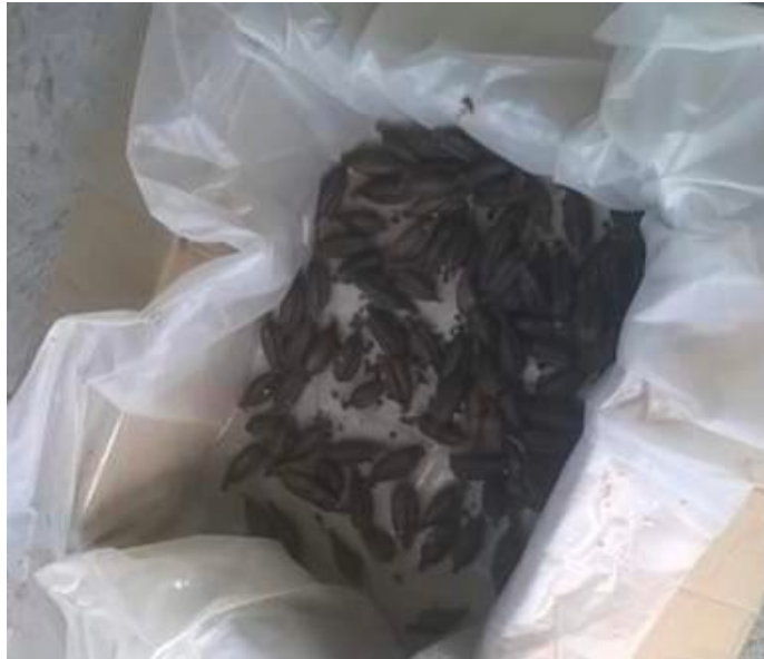
Imagen 5. Cacayas: semillas del agave secas. Autoría propia, noviembre de 2018.