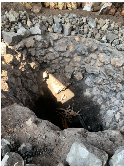
Imagen 21. El día de cocimiento se inicia, sacando las piedras y los restos del horno, hasta que el horno se encuentre vacío. Autoria propia, marzo 2019.