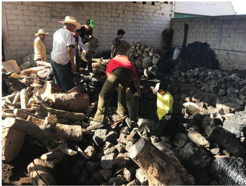
Imagen 20. Área de cocción en la fabrica Rio Blanco. Autoría propia, enero 2019.