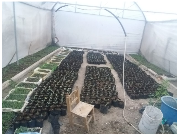
Imagen 6. Invernadero ubicado en el traspatio de los hogares mezcaleros, se observa la estructura y tecnología usada en estos espacios. Autoría propia, junio de 2019.