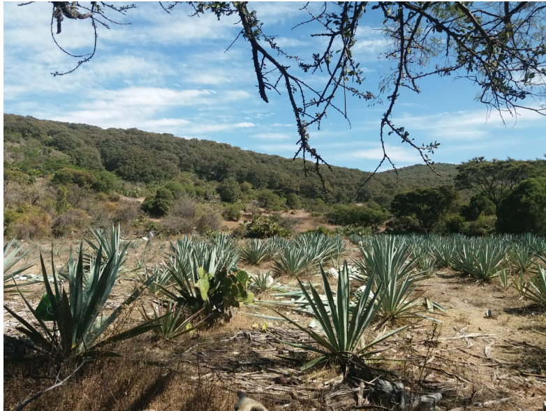
Imagen 12. Campo de maguey, propiedad de los maestros mezcaleros. Autoría propia, julio 2019.