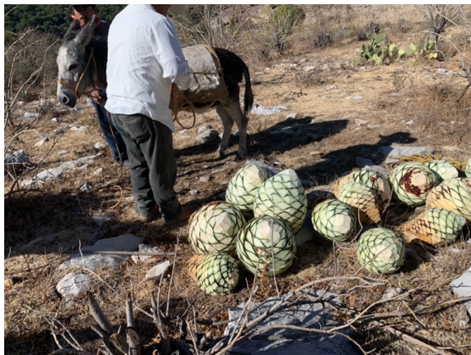
Imagen 15. Los aprendices se encargan de cuidar la distribución del peso así como el amarre del maguay a los mismos. Autoria propia, febrero 2020.