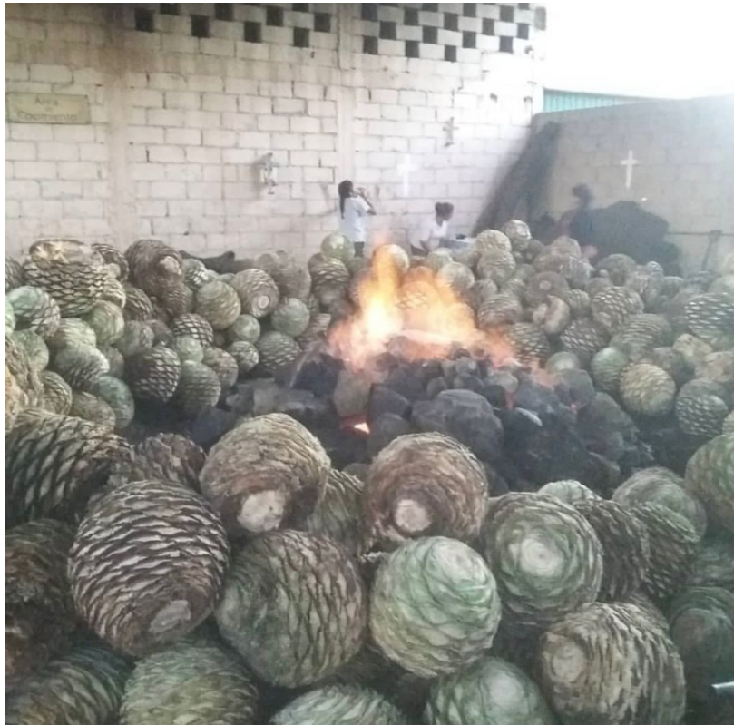
Imagen 25. Una vez que la piedra dentro del horno presenta un rojo intenso, significa que está en la temperatura para poder introducir el maguey en el horno. Autoria propia, marzo 2019.