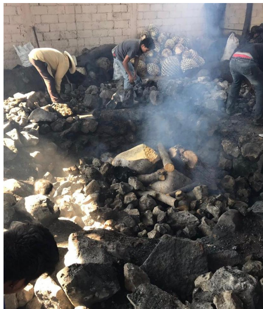
Imagen 24. Una vez que inicia el proceso de ebullición, todos dejan la zona debido a que el humo es sofocante. Autoria propia, enero 2019.