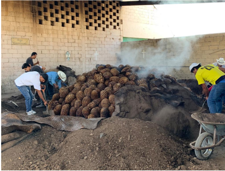
Imagen 27. Después de tres días se retiran los troncos y la tierra para poder extraer el maguay cocido, se emplea un carretilla para trasladar el maguay al área de molienda donde seguirá su proceso de transformación. Autoria propia, enero 2019.