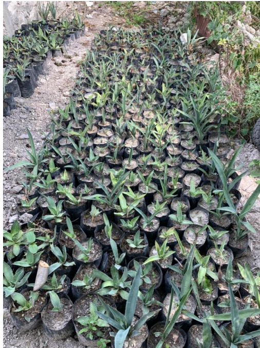
Imagen 7. Se acondicionan espacios para la división de los agaves según sus características y tamaño. Autoría propia, agosto 2019.