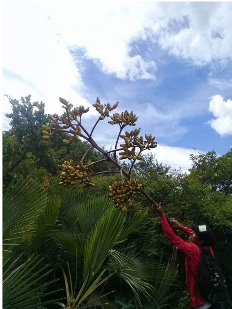
Imagen 4. La floración de un agave, mejor conocido como quiote, de donde se sustraen las semillas del agave Papalometl para la reproducción de la planta, siendo manipulado por un aprendiz. Imagen 1. Maguey Espadin después de 4 años, ya listo para su cosecha. Autoria propia, octubre 2018.