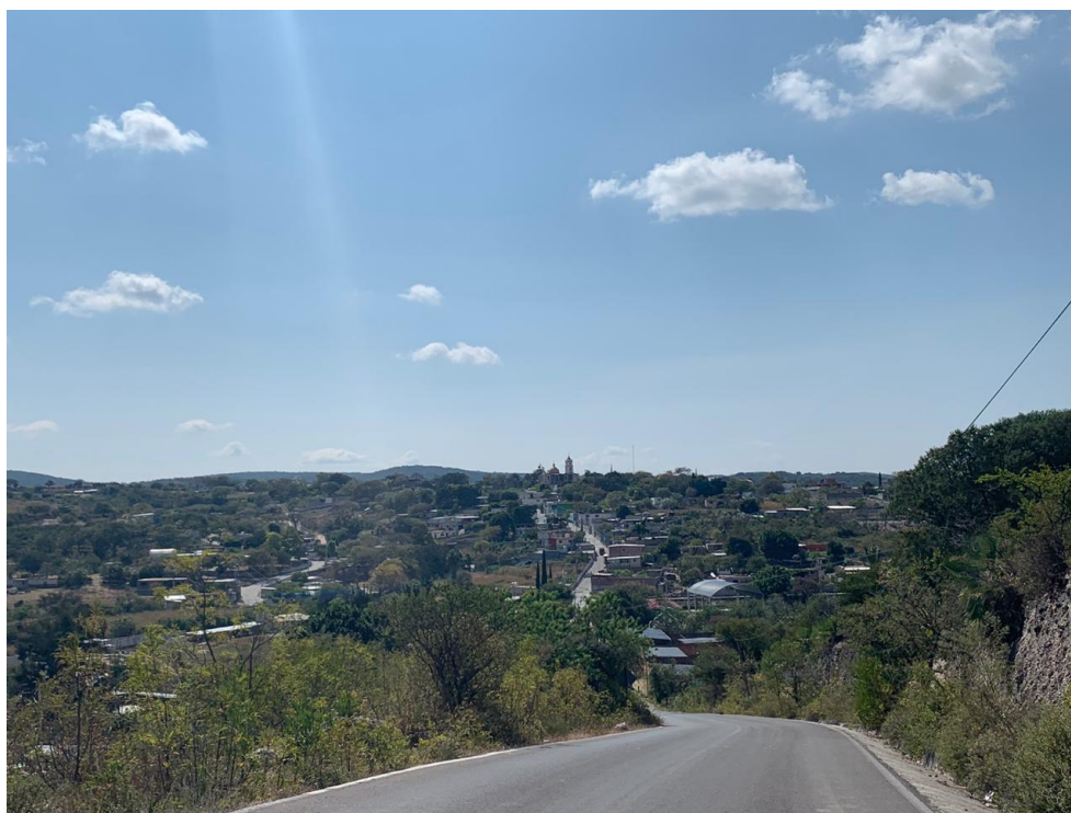
Imagen 1. Fotografía panorámica de San Diego la Mesa Tochimiltzingo. Autoría propia, 20 de noviembre de 2019.

Particularmente, el escenario de Tochimiltzingo es una cabecera municipal, cuya infraestructura tiene mayor acceso a servicios básicos debido a la recepción de apoyos gubernamentales que recibe, situación que contrasta con el resto del territorio que forma parte de esta demarcación político administrativa, es decir a las dos juntas auxiliares que le constituyen, las cuales son: Guadalupe Amolocayan a 78 kilómetros de distancia y San Bartolomé Chimalhuacán a 17 kilómetros; así como una inspectoría que se llama: La Soledad Tepehuastitla 21 .