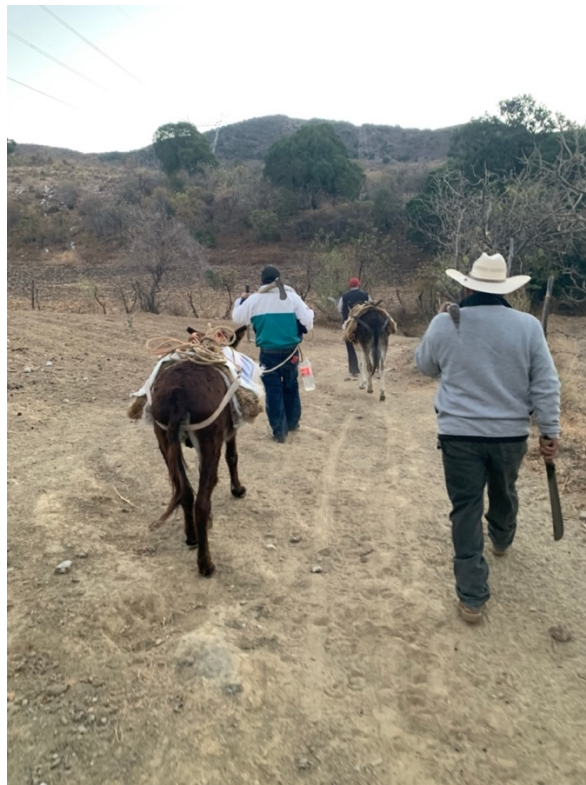
Imagen 13. Los aprendices inician el día llevando consigo herramientas como hacha y machete, además de otros viveres como agua y comida. Autoria propia, febrero 2020.