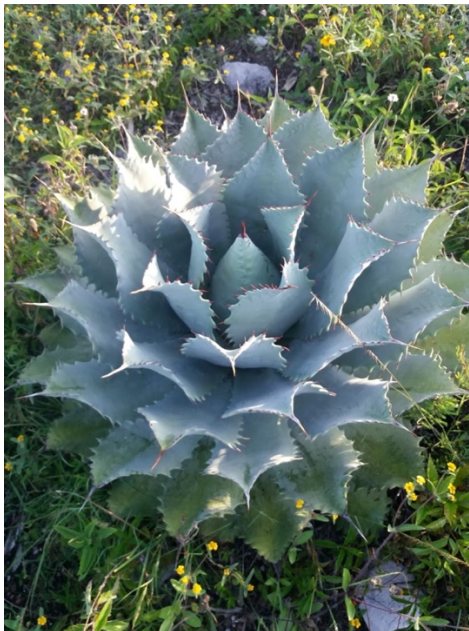
Imagen 2. Maguey Papalometl, después 5 años. Imagen 1. Maguey Espadin después de 4 años, ya listo para su cosecha. Autoria propia, mayo 2019.