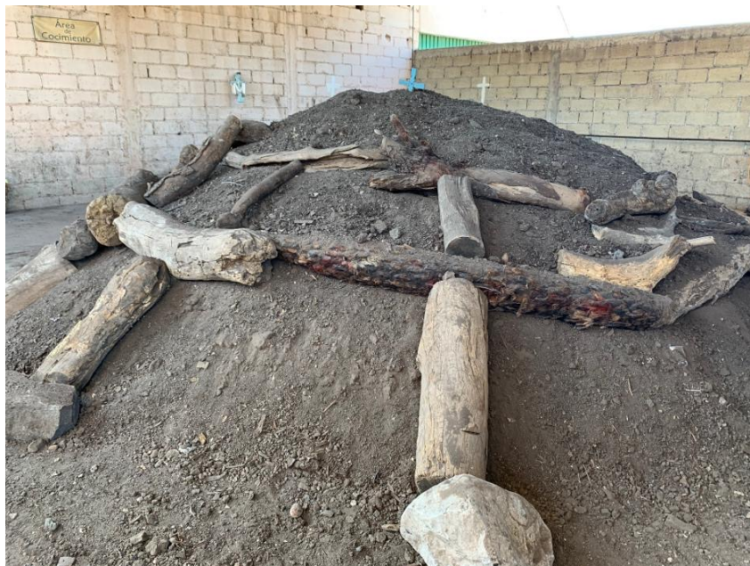
Imagen 26. Horno sellado con piedra y troncos para evitar que se deslave. En la parte superior del horno se encuentra la cruz. Autoria propia, enero 2019.