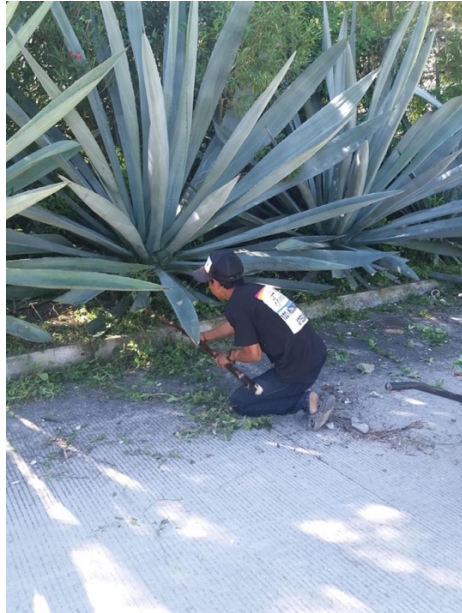
Imagen 3. Maguey arroqueño, situado en la acera de una de las casas de los maestros. Autoria propia, noviembre 2018.