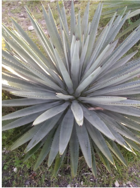
Imagen 1. Maguey Espadin después de 4 años, ya listo para su cosecha. Autoria propia, marzo 2019.