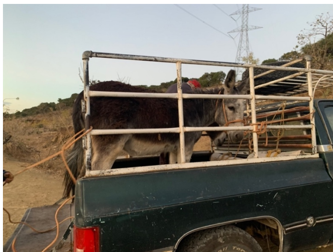
Imagen 14. Dos burros, cuya función trasladar el maguey del cerro a las camionetas. Autoria propia, febrero 2020.