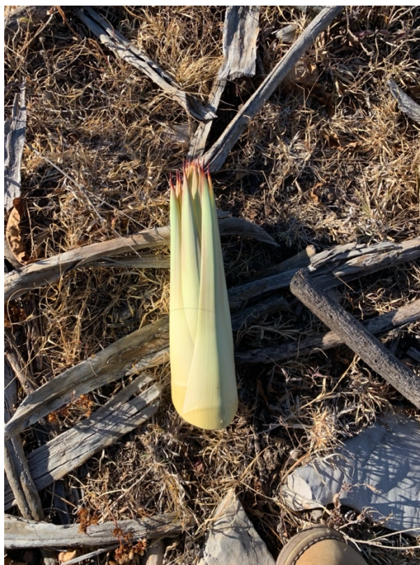
Imagen 16. Pequeño tronco que nace del centro del maguay mejor conocido como “velilla”. Autoria propia, febrero 2020.