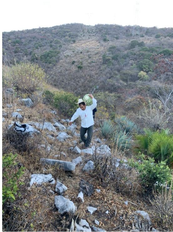
Imagen 19. Un aprendiz traslada el maguey a un espacio donde se concentran las piñas. Autoría propia, febrero 2020.