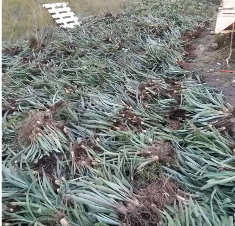
Imagen 9. Hijuelos de Espadin. Autoria de Guillermo Monfil. Autoria Guillermo Monfil, julio 2018.