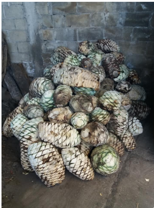
Imagen 2. Fotografía del corazón o piña maguey. Autoría propia, 26 de enero de 2019.

Una de las primeras actividades para poder recibir el reconocimiento de aprendiz, es saber y dominar el proceso de corte, en este caso, qué piña sirve y cuál no, así como contar con la habilidad de saber pelar o rasurarla.