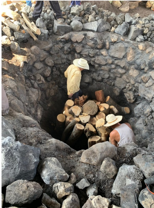
Imagen 23. Dos maestros acomodan dentro del horno los troncos más delgados posteriormente, se colocan los troncos más grandes para finalizar colocando la piedra de río. enero 2019.