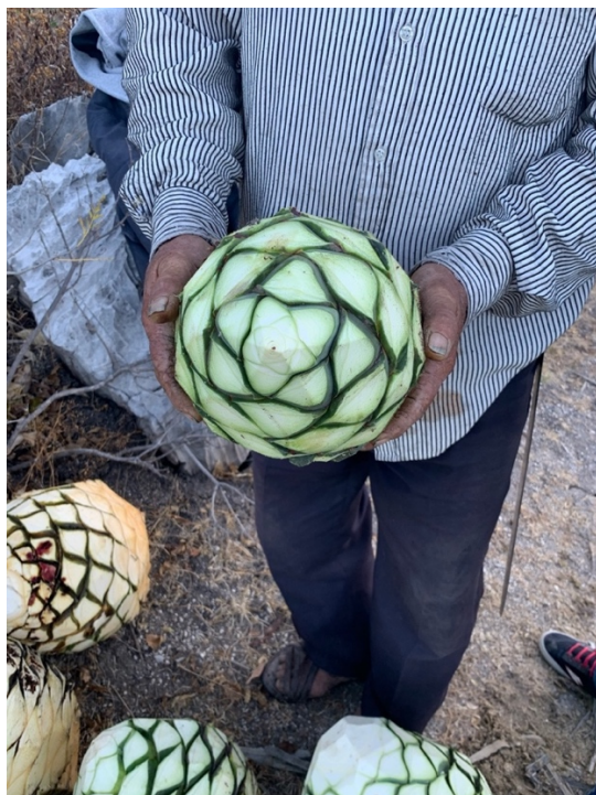
Imagen 17. Maguey cuyo quiote está en proceso de desarrollo y se le denomina llamado “de novia”. Autoria propia, marzo 2020.