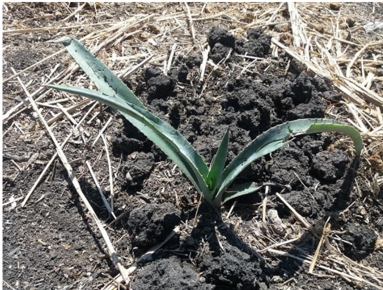
Imagen 10. Un hijuelo Espadin recién sembrado. Autoria propia, julio 2019.