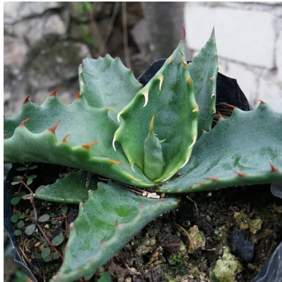
Imagen 8. Agave variedad Papalometl, cultivado y cuidado en invernadero, aún en crecimiento, después de unos meses se traslada a campo abierto, se aprecian las características de esta variedad, tales como el color café claro de las espinas y el tono grisaseo de sus pencas. Autoría propia, abril 2019.