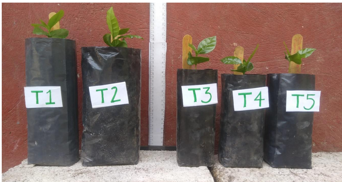
ANEXO 1. Crecimiento de planta de café a los 104 días después de trasplante, en diferentes tamaños de contenedores.