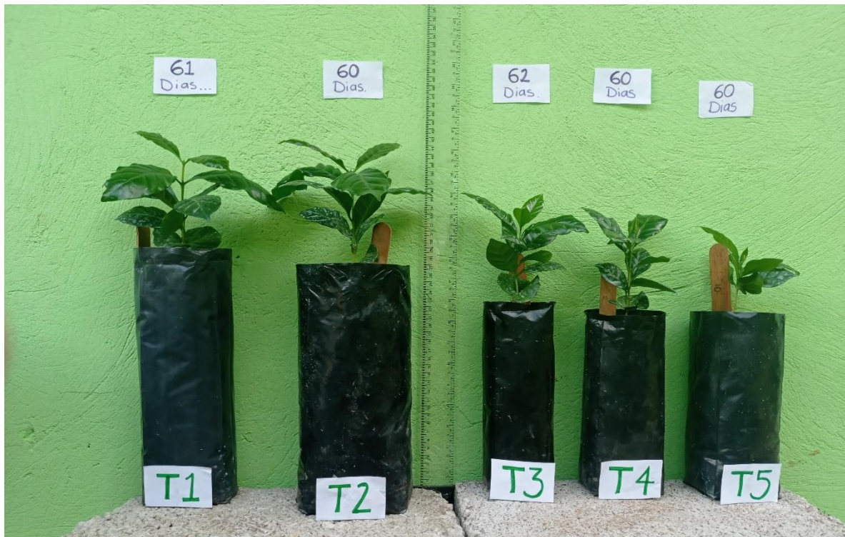
ANEXO 3. Crecimiento de planta de café a los 168 días después de trasplante, en diferentes tamaños de contenedores.