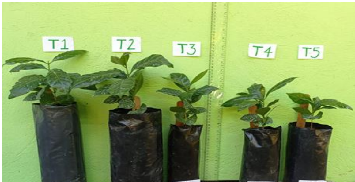
ANEXO 4. Crecimiento de planta de café a los 198 días después de trasplante, en diferentes tamaños de contenedores.