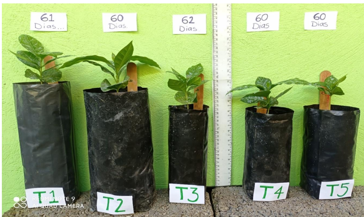
ANEXO 2. Crecimiento de planta de café a los 138 días después de trasplante, en diferentes tamaños de contenedores