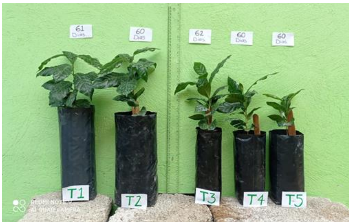
ANEXO 5. Crecimiento de planta de café a los 231 días después de trasplante, en diferentes tamaños de contenedores.