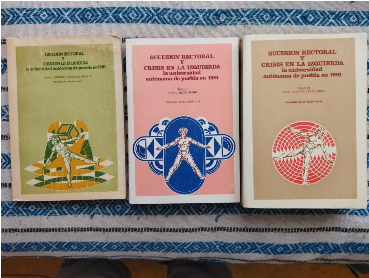
Los tres tomos del libro “Sucesión rectoral y crisis en la Izquierda. La Universidad Autónoma de Puebla en 1981” Propiedad del autor de esta tesis.