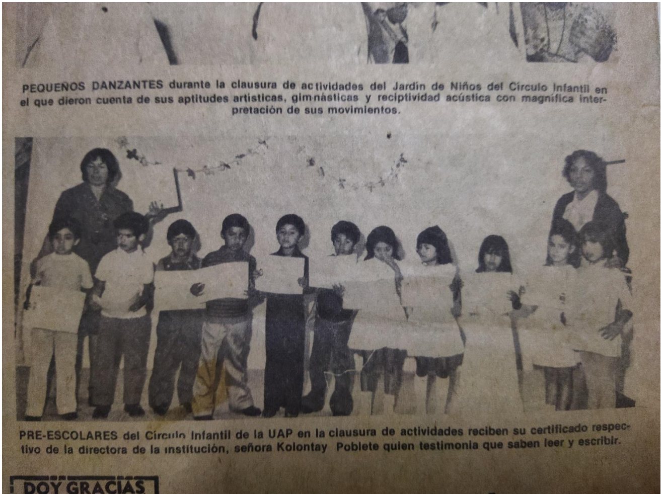
Recorte de Periódico “El Sol de Puebla” con referencia a la graduación de la Segunda Generación del Círculo Infantil, en 1975