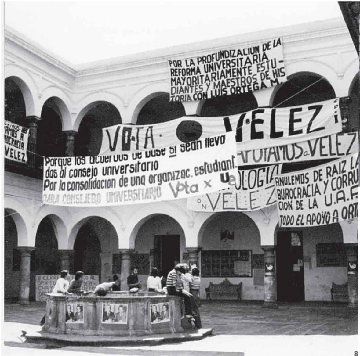
Mantas de campaña en el edificio “San Jerónimo” de la Escuela de Filosofía y Letras (Hoy ocupado por la Facultad de Psicología)