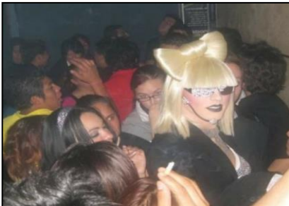
Lady Gaga en el Sibari

Nota. Sujeto travesti vestido de la cantante Lady Gaga, un viernes por la noche en Sibari. Se observa caminando entre la multitud cantando y bailando. Elaboración propia, 2012.