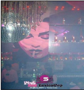
Barra de la Sala Pop

Nota. Se observa la Sala Pop de Sibari, se muestra la decoración del lugar con candelabros e imágenes de arte pop. La imagen es propiedad de la página oficial de Facebook de Sibari Bar, 2014.