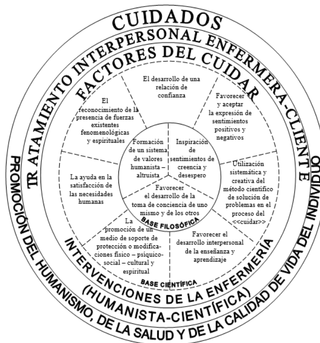
Figura 1. Estructura de la Teor6a de Cuidado Humanizado de Jean Watson

Nota: Adaptada por Cara, C. (1988), citado por Abades (2010).