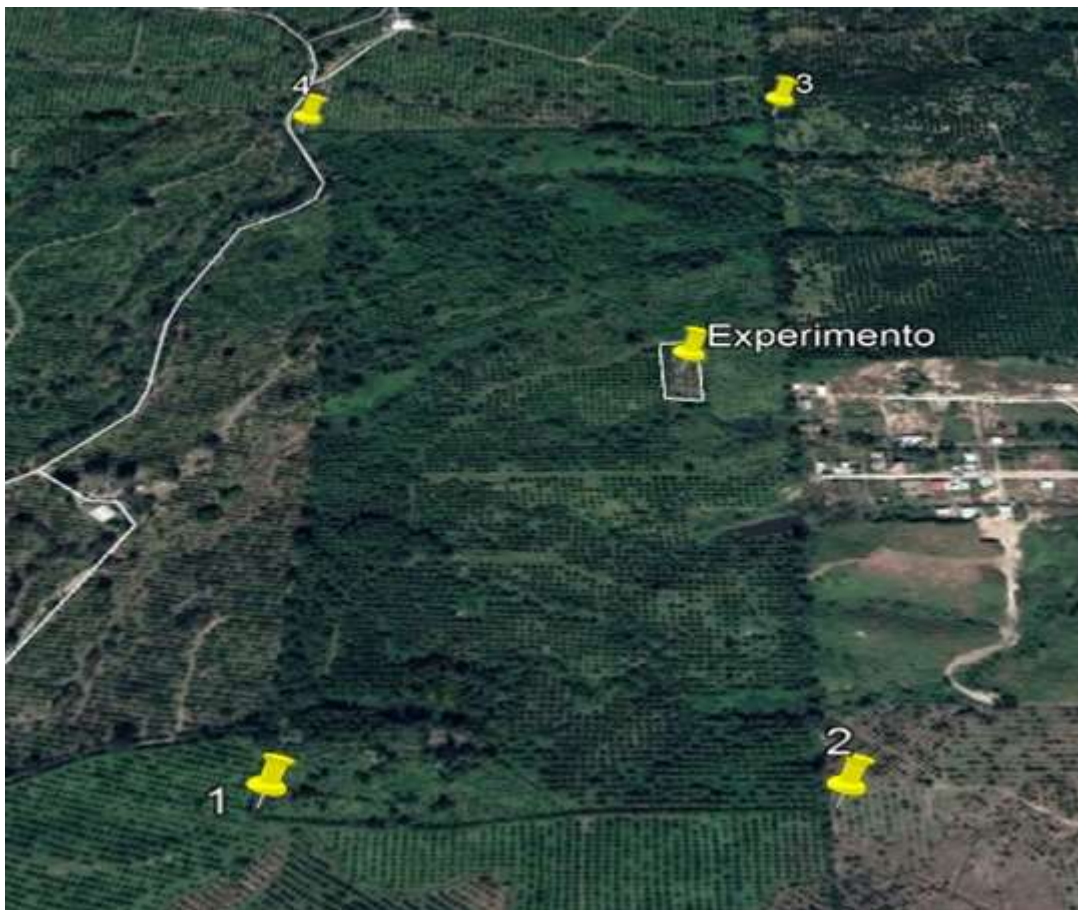
Figura 1. Ubicación del rancho 'San Antonio' y del experimento.

La textura del suelo fue franco arenosa con pH de 5.8, materia orgánica 1.79% y CIC de 10.52\text{ cmol}\cdot\text{kg}^{-1} . El contenido nutrimental en hojas y tallo de kudzu fue: nitrógeno 3.73%, fosforo 0.18%, potasio 1.96%, Calcio 0.78% y magnesio 0.32%.