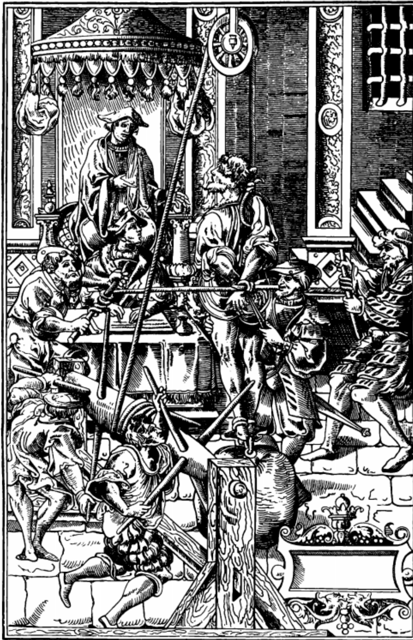
Ilustración 4 Torturado, bajo el poder de la Inquisición en Italia

referencia al proceso en donde el juez veía la necesidad de absolver si el acto de tortura no lograba ninguna confesión de importancia.