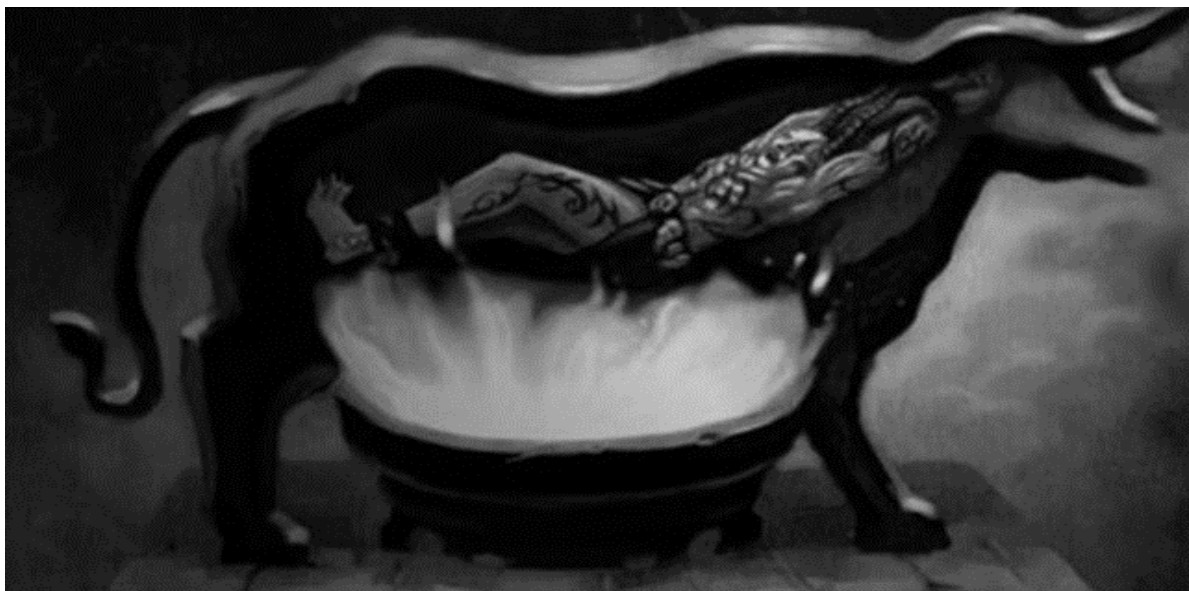
Ilustración 2. Toro de Falaris , creado por Perilo de Atenas.

pues se consideraba que la robustez corporal era una condición necesaria para seguir el proceso de formación continua, ya que en los cuerpos débiles no se gestaban almas heroicas y guerreras (Platón, 1871, p. 30).