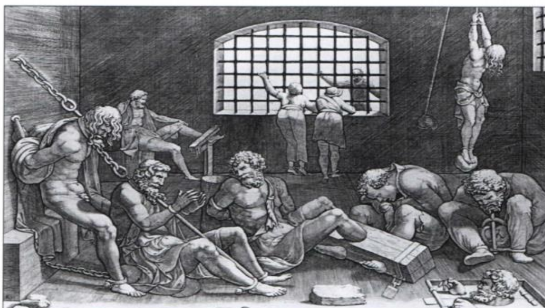
Ilustración 3 Tortura en el Imperio Romano

El delito genérico de orden público en relación con el origen de la civilización o a sus ciudadanos era considerado una ofensa y crimen en contra del Estado y al mismo tiempo contra el emperador. Por ello el crimen de lesa majestad era considerado un agravio contra la majestad; agravio que, desde la antigua Roma, fue legislado como un delito político y que incluía también los ámbitos de la divinidad. Este delito pasó a los procesos inquisitoriales realizados por la Iglesia católica, de igual forma, como un crimen en contra de la divinidad.