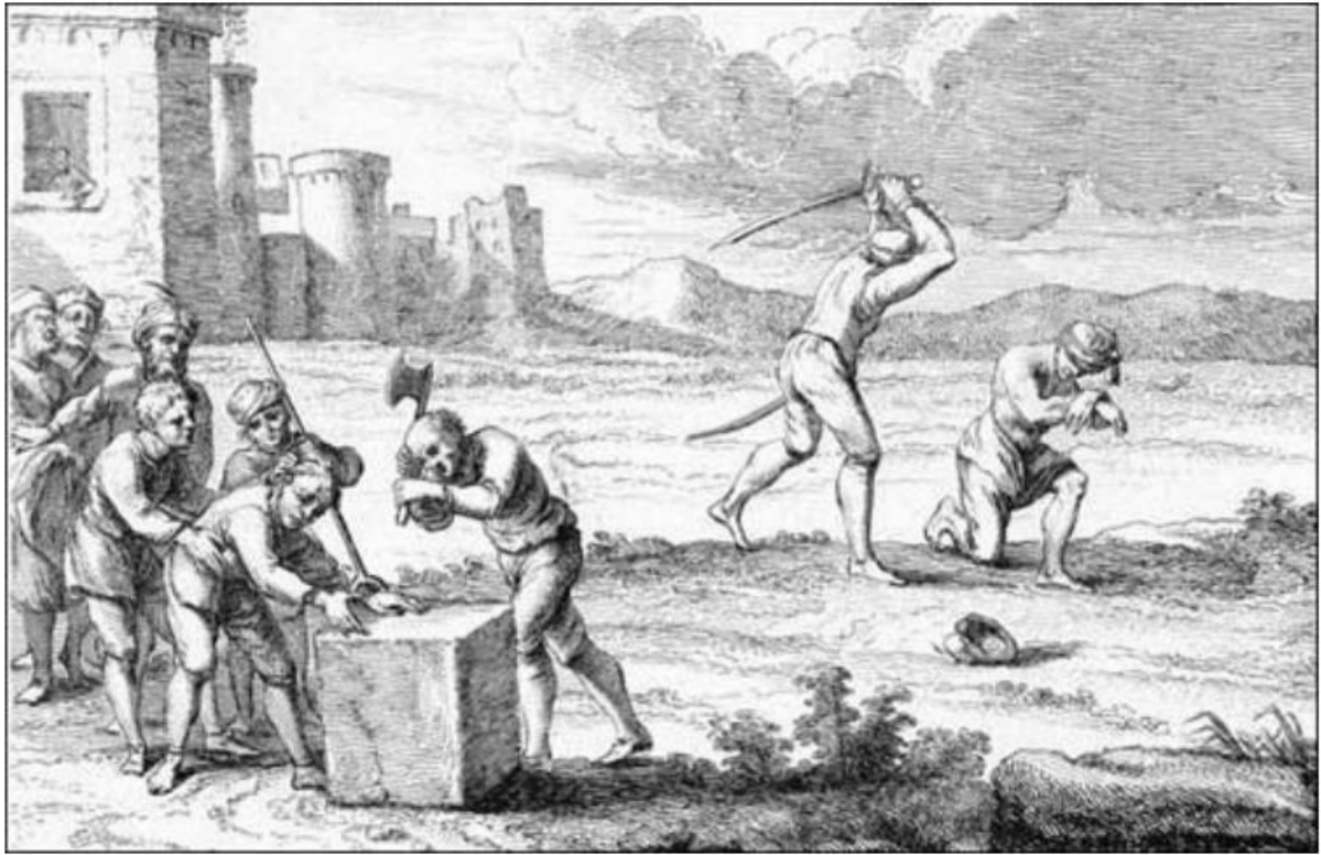
Ilustración 5 Tortura por desmembramiento, práctica común en Europa medieval.

Se distingue, con base en las razones históricas antes señaladas, sea en la constitución de la polis griega, en el derecho romano, en los procesos inquisitoriales de la Edad media o en la jurisprudencia del siglo XIII en España, que la tortura se ha realizado con una gran diversidad de fines. Estos fines tienden al castigo e intimidación a aquel que se percibe como extraño, distinto y, por lo tanto, como una entidad dañina a ciertas circunstancias o intereses, espectro que va desde ser un medio de control hasta considerarlo algo meramente espiritual, incluso como una forma de fabricación de una verdad. 24 Esto nos permitiría confirmar que es cierta