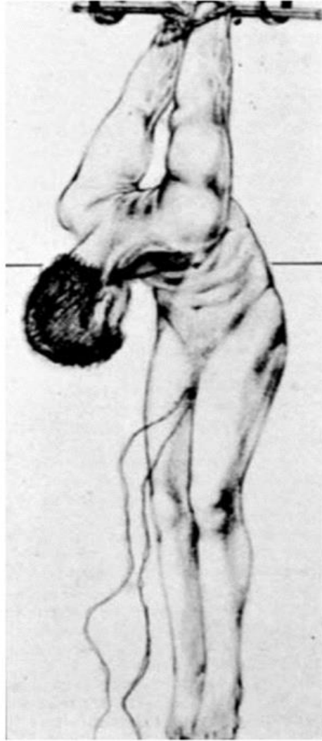
Ilustración 6 Horca palestina. Uno de los métodos actuales que se emplean para causar la máxima extensión de la articulación del hombro.