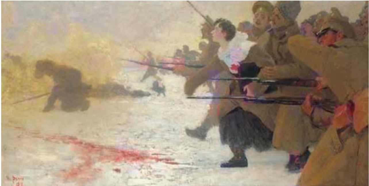
Imagen 6. El ataque con la enfermera de la Cruz Roja . Repin, 1917. Óleo sobre tela, 124x250 cm. Colección privada.

El kitsch no es más que otra manera fácil en que el régimen totalitarista busca relacionarse con sus súbditos; dado que estos regímenes no pueden elevar el nivel cultural de las masas, halagarán a las masas bajando la cultura a su nivel. Por este motivo la vanguardia es una forajida, porque no es que sea muy crítica, sino que es tan inocente que es imposible inyectarle un mensaje propagandístico. El kitsch, por otro lado, siempre mantendrá el alma del pueblo cerca del dictador. (v.1, p. 20)