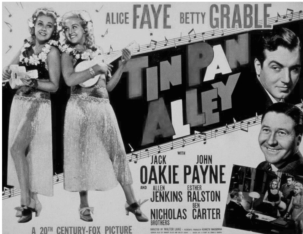
Imagen 4. Poster de la película "Tin Pan Alley".

A toda acción corresponde una reacción, y en el caso de la vanguardia hubo una retaguardia. Greenberg afirma que con la aparición de la vanguardia, un nuevo fenómeno cultural surgió en Occidente, aquello a lo que los alemanes habían llamado kitsch: la literatura y el arte comercial y popular, la música de Tin Pan Alley, las películas de Hollywood, el baile tap y la prensa sensacionalista. (Ibid.) El kitsch es un producto de la revolución industrial que, al urbanizar las masas de Europa Occidental y América, estableció una alfabetización universal. (íbid.) Esto resulta obvio para Greenberg quien afirma que, antes de la alfabetización globalizada, el único mercado para la cultura formal era entre aquellos que podían permitirse el lujo de cultivar su mente, es decir, la clase social dominante que tenía los recursos económicos para consumir la cultura. Los nobles y la burguesía eran quienes tenían acceso a los libros, eran educados en letras desde pequeños y se les cultivaba un gusto por el arte, eran la clase letrada. Pero pronto los plebeyos aprendieron a leer y