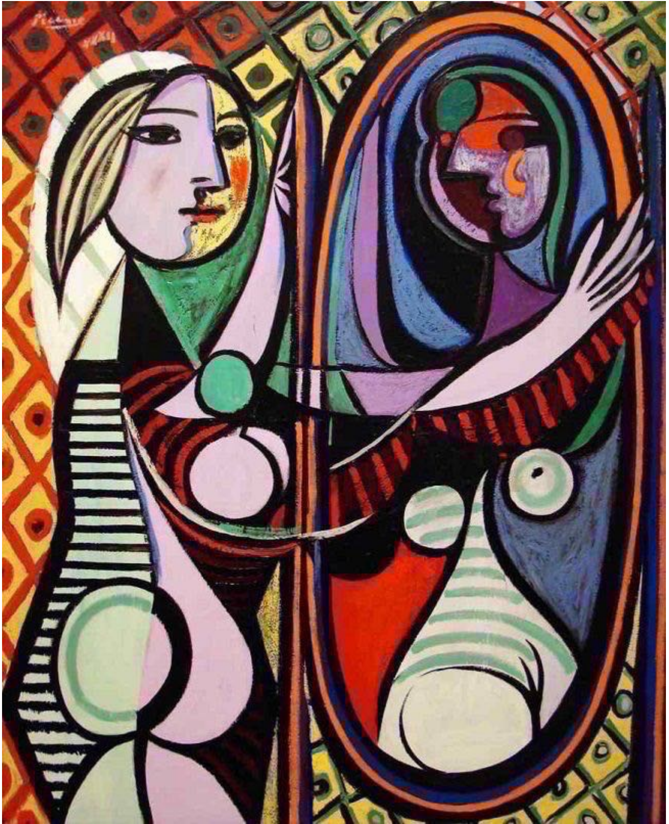
Imagen 5. Girl before a Mirror . Picasso, Marzo de 1932. Óleo sobre tela, 162x130 cm. MoMA, NY.