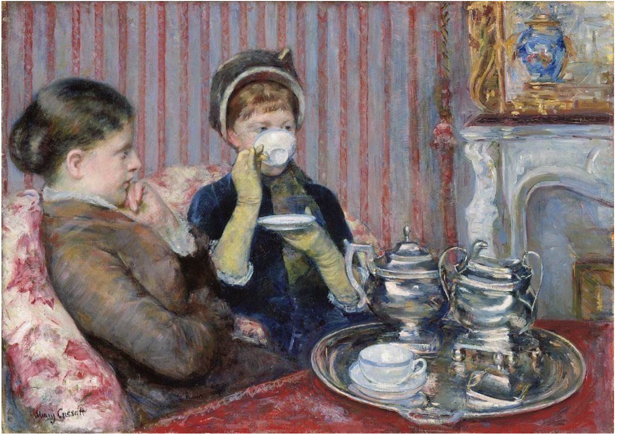
Imagen 4. Thé . Mary Cassatt, 1880. Óleo sobre tela, 25 x 36 in. Museo de Bellas Artes de Boston.

Dos de los artistas más reconocidos de principios del siglo XIX son Mardsen Hartley (Imagen 5) y Thomas Hart Benton (Imagen 6). La pintura moderna de Hartley y el regionalismo de Benton servirán como contexto importante para comprender la producción artística de expresionistas abstractos como Pollock, uno de los discípulos de Benton.