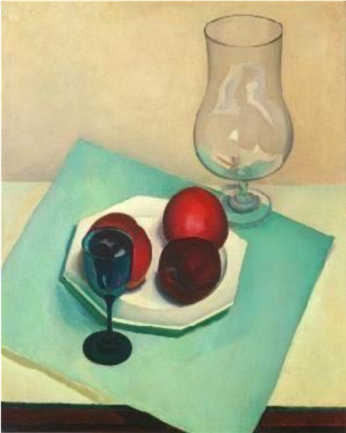
Imagen 9. Still Life , Charles Sheeler, 1925. Óleo sobre tela, 61 x 50 cm. Museo de Bellas Artes de San Francisco.