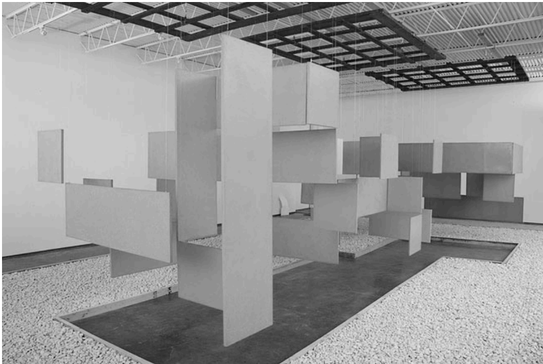
Imagen 2 Grande Núcleo Hélio Oiticica 1960