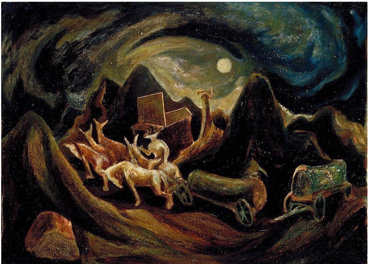
Imagen 7. Going West , Jackson Pollock, 1937. Mixta sobre madera conglomerada, 38 x 52 cm.

“The Moon Woman” suggests the example of Picasso, particularly his “Girl Before a Mirror” of 1932. The palettes are similar, and both artists describe a solitary standing female as if she had been x-rayed, her backbone a broad black line from which her curving contours originate. Frontal and profile views of the face are combined to contrast two aspects of the self, one serene and public, the other dark and interior. (Lucy Flint)