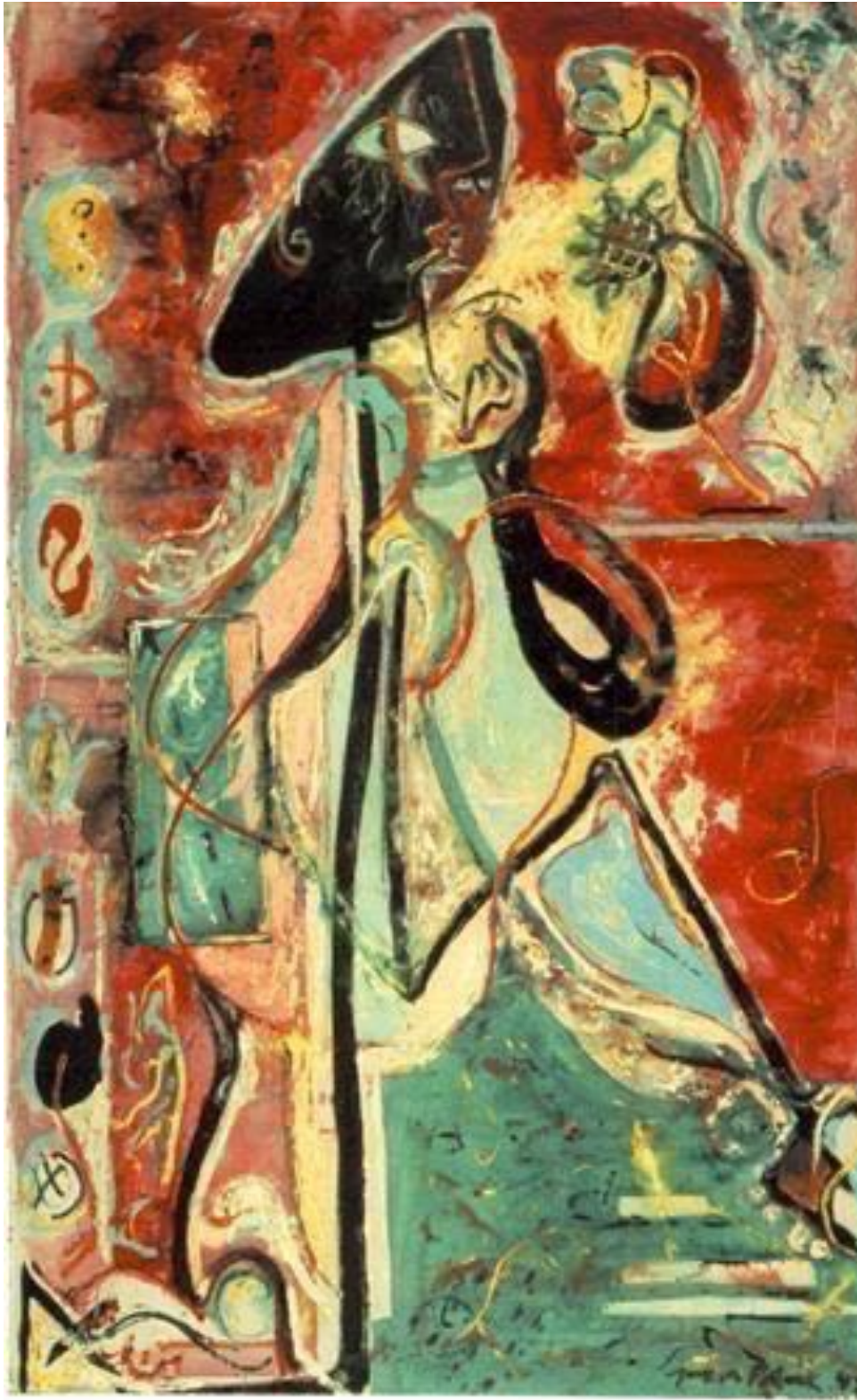
Imagen 8. Moon Woman , Jackson Pollock, 1942. Óleo sobre tela, 175 x 109 cm. Museo Guggenheim.