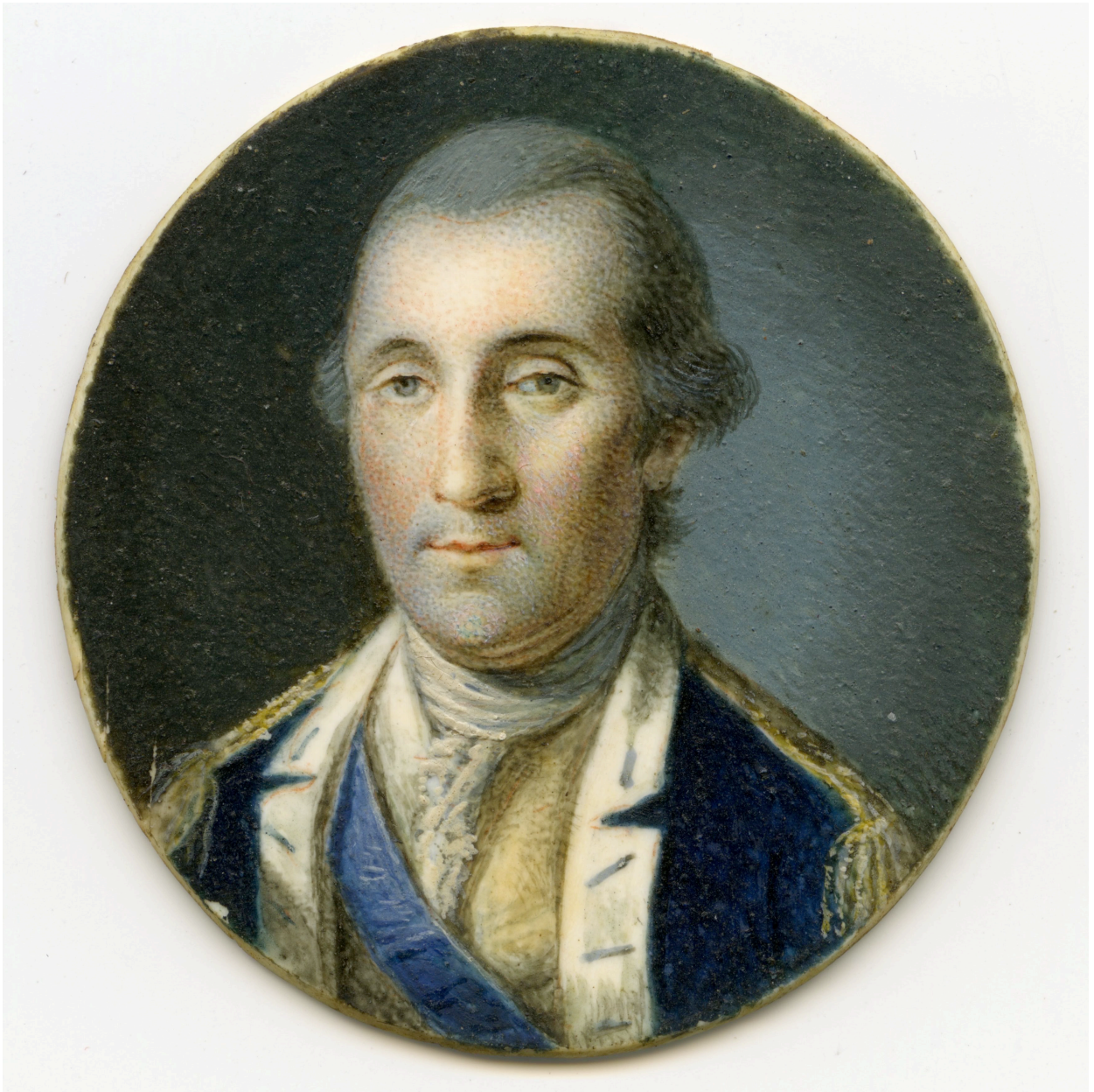
Imagen 1. Retrato de George Washington , Charles Willson Peale, 1775-76

(Imagen 1). Del mismo modo, el género del retrato cobró gran importancia al igual que en Europa, la única diferencia es que, en vez de retratar a los nobles, los artistas norteamericanos retrataban a los comerciantes. Una constante estética durante este periodo fue la exaltación del orgullo nacional, característica que permanecería durante dos siglos completos (Imagen 2).