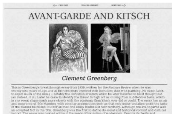
Imagen 1. Encabezado de la publicación original de “Vanguardia y Kitsch”

No es de extrañarse que una de las primeras reseñas que Greenberg hiciera fuera sobre Brecht. A pesar de que sus padres se confesaban al margen de toda influencia política, la actitud de Greenberg nunca dejó de ser partidista. “[A] partir de 1936 se encontró en un conflicto con la cultura estalinista y comunista a raíz de apoyar el trostkismo, especialmente aquel que se defendía en las páginas de la Partisan Review .” (O’Brian, v.1, xx) O’Brian afirma que como muestra de su apoyo, a la muerte de Trotsky, Greenberg escribió un poema titulado “Oda a Trotsky”; así mismo señala que el rechazo que tenía Greenberg hacia el capitalismo tenía, en realidad, un origen marxista (íbid), a pesar de que unos años después negara toda relación con el marxismo.