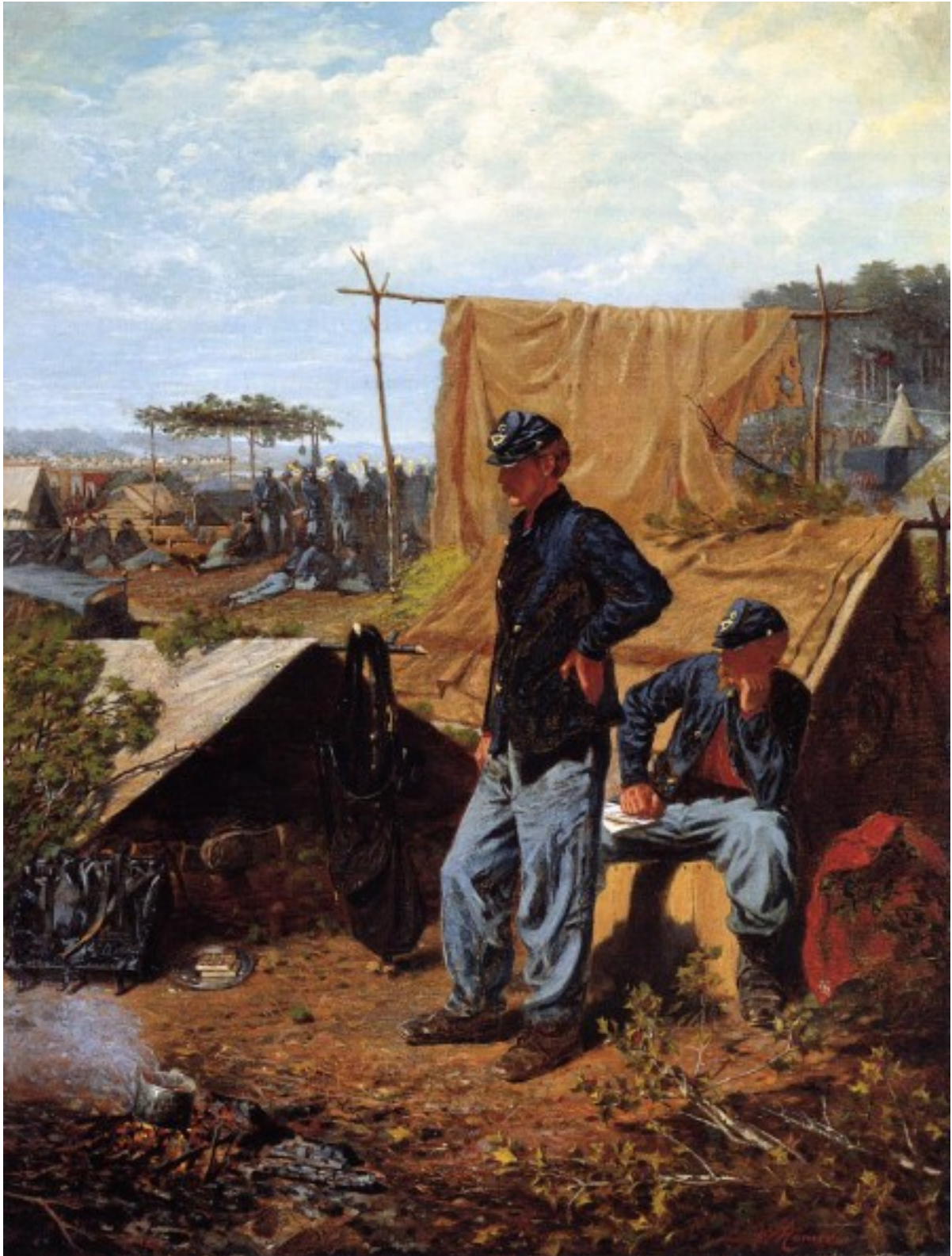
Imagen 3. Home, Sweet Home . Winslow Homer, 1863.