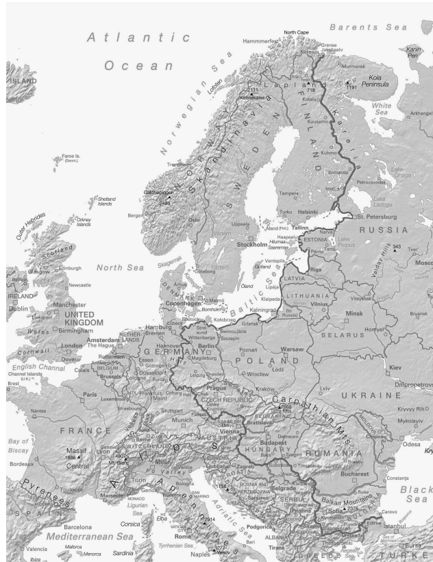
Imagen 2. División física de la Cortina de Hierro

La Cortina de Hierro -algunas veces llamada Cortina de Acero o Telón de Acero- fue una división física e ideológica entre los bloques comunistas y anti-comunistas de Europa. Esta división comenzó al final de la Segunda Guerra Mundial y concluyó en 1991 con la consumación de la Guerra Fría. La finalidad de esta división fue aislar a la Unión Soviética de los bloques no-comunistas. En la imagen 2 se puede observar claramente la división de bloques: los países del Pacto de Varsovia del lado derecho (Rusia, Ucrania, Polonia, Rumania, etc) y los países de la OTAN del lado izquierdo (España, Francia, Italia y EUA). Al concluir la Segunda Guerra Mundial, el creciente antagonismo entre la URSS y el resto de Europa no se había quedado atrás, ya que desde de 1939 esta mala relación se había venido deteriorando cuando la URSS accedió a un