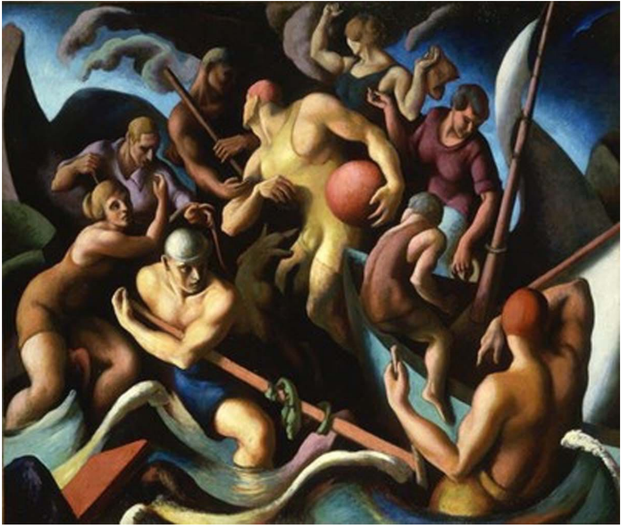
Imagen 6. People of Chilmark , Thomas Hart Benton, 1920. Óleo sobre tela, 166 x 197 cm. Museo Hirshhorn.