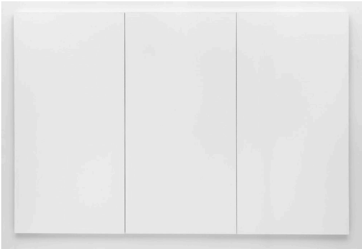
Imagen 1 All White Robert Rauschenberg 1951 Óleo sobre tela 72 x 125 in

Sin embargo, obras como la de Rauschenberg habían puesto sobre la mesa el problema del arte en la década de los sesenta: liberar el arte de avanzada en sí mismo mediante lo absurdo, lo raro o lo impactante. Movimientos como el Op Art, Pop Art o Kinetic Art fueron considerados por Greenberg como un “arte novedoso” 74 que no hizo más que dejar bien claro cuál era el problema con el arte de avanzada. El Minimal Art surgió como la respuesta más coherente.