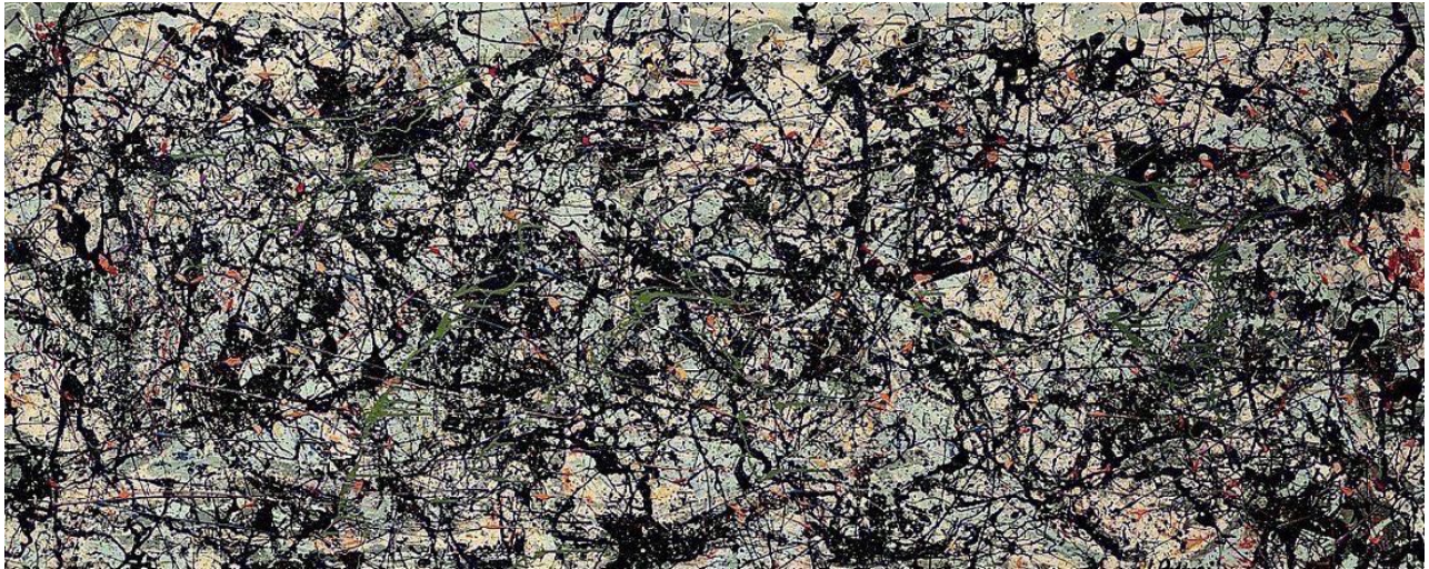
Imagen 7. Lucifer , Jackson Pollock. 1947. Mixta. 267x104cm, Galería del Museo de Arte de la Universidad de Stanford, CA, USA.