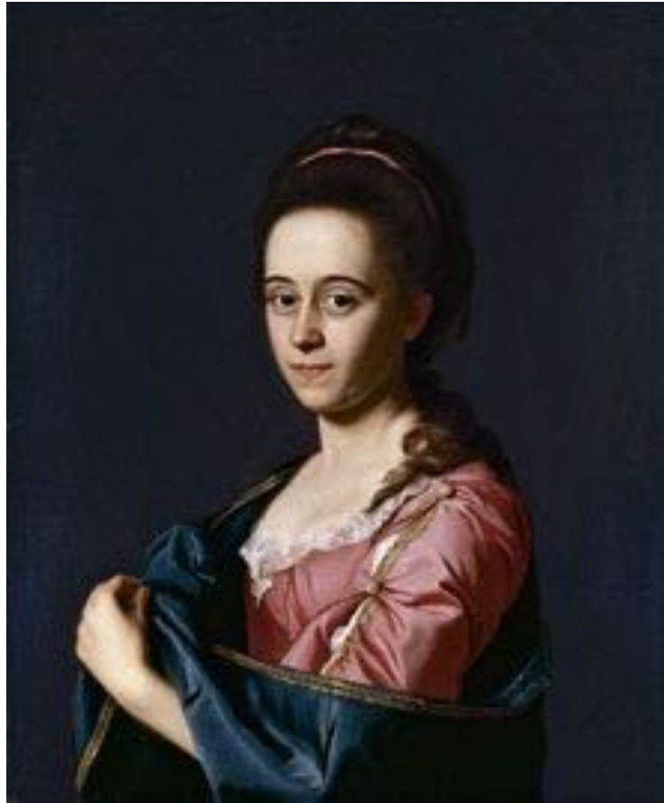
Imagen 2. Retrato de Catherine Hill, mujer de Joshua Henshaw II , ca. 1772. Óleo sobre tela. 77 x 56 cm. Museo Thyssen Bornemisza.

En una segunda etapa, a partir de mediados del siglo XIX, empezó a animarse la pintura de género. La mayoría de las piezas de este periodo describían el paisaje y la vida cotidiana (Imagen 3).