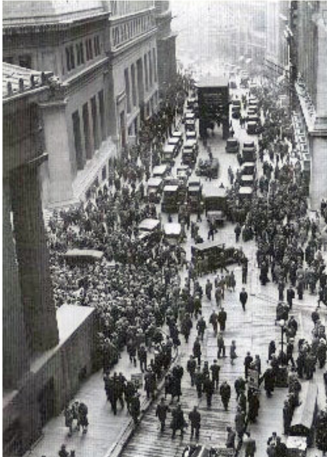
Imagen 1. Multitud abriéndose paso en Wall Street al derrumbe de la bolsa

Uno de los procesos económicos de mayor impacto en las primeras décadas del siglo XX en Estados Unidos fue, sin duda, el que fuera nominado como la Gran Depresión. Considerado como el periodo más difícil y de mayor escasez para las familias estadounidenses, no fue más que la punta del iceberg en una serie de eventos de resonancia histórica que harían de este siglo uno de los más relevantes para Estados Unidos.