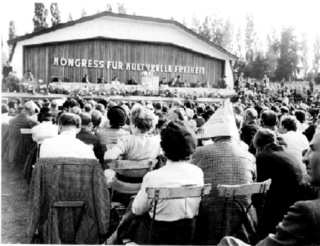
Final session (at Pankkuru)