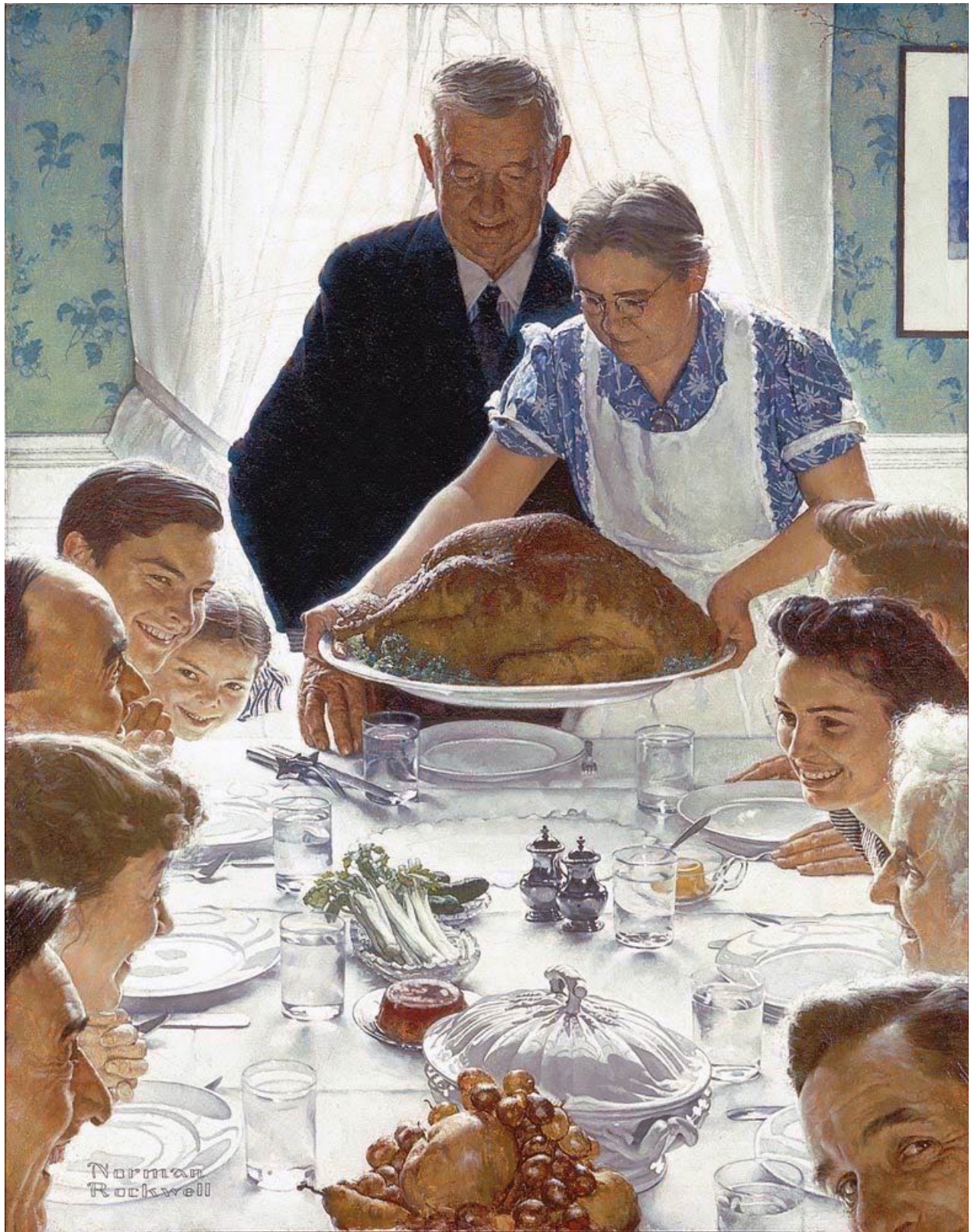
Imagen 8. Freedom from Want , Norman Rockwell 1943, óleo sobre tela; 116 x 90 cm. Museo Norman Rockwell, Stockbridge, MA.