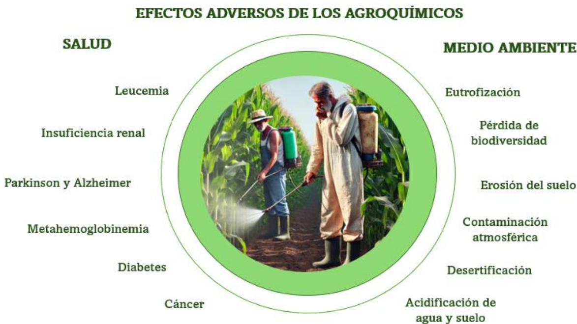
Figura 2. Efectos adversos a la salud y medio ambiente provocados por los agroquímicos. Los pesticidas y fertilizantes se han correlacionados con numerosos padecimientos como la leucemia y el cáncer, los cuales pueden llegar a ser mortales. Por otro lado, diversos estudios han demostrado el impacto negativo de los agroquímicos en el medio ambiente, estos compuestos provocan una contaminación en los suelos, agua y aire [3].

Estos compuestos tienen como principal ventaja el mantenimiento de los niveles de producción y la rentabilidad de los cultivos, por otro lado, múltiples investigaciones han concluido que los pesticidas tienen efectos negativos en el medio ambiente, en el ecosistema y en la salud humana [10].