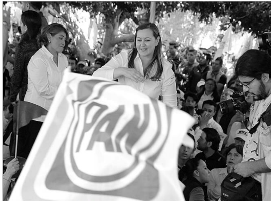
La candidata en el inicio de su campaña