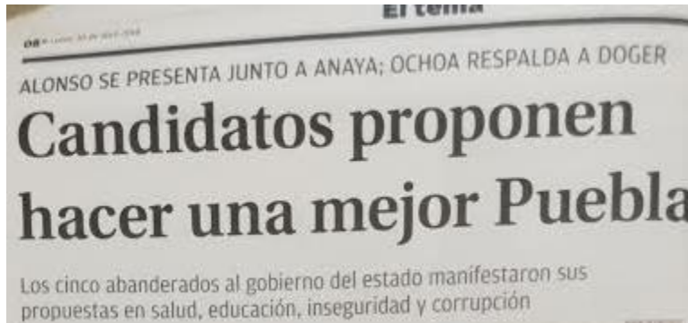
Figura 6 Primer contenido Milenio Diario