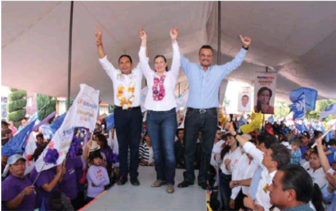
Durante el acto proselitista, los candidatos plantearon sus propuestas. Especial