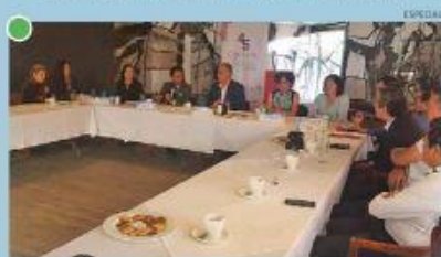
"AÚN QUEDA MUCHO POR HACER PARA EL ENCADENAMIENTO DE LA PRODUCCIÓN CON UNA EXPERIENCIA DE GASTRONOMÍA"