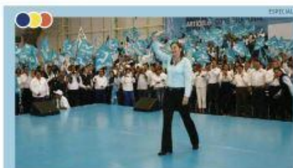
"SOY UNA MUJER DE PALABRA, COMPROMETIDA CON LOS POBLANOS". REITERÓ AL RECIBIR RESPALDO DE NUEVA ALIANZA