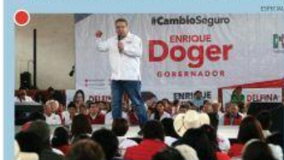
"ESTOY CONVENCIDO DE QUE EL SISTEMA POLÍTICO MEXICANO TIENE QUE DAR MAYOR APERTURA A LOS CANDIDATOS"