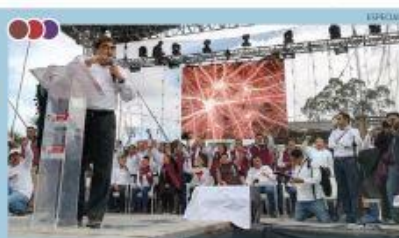
"ESTE PROCESO DE ELECCIÓN SIGNIFICA UN CAMBIO O DEJAR LAS COSAS COMO ESTÁN. HAGAMOS VALER EL PODER"