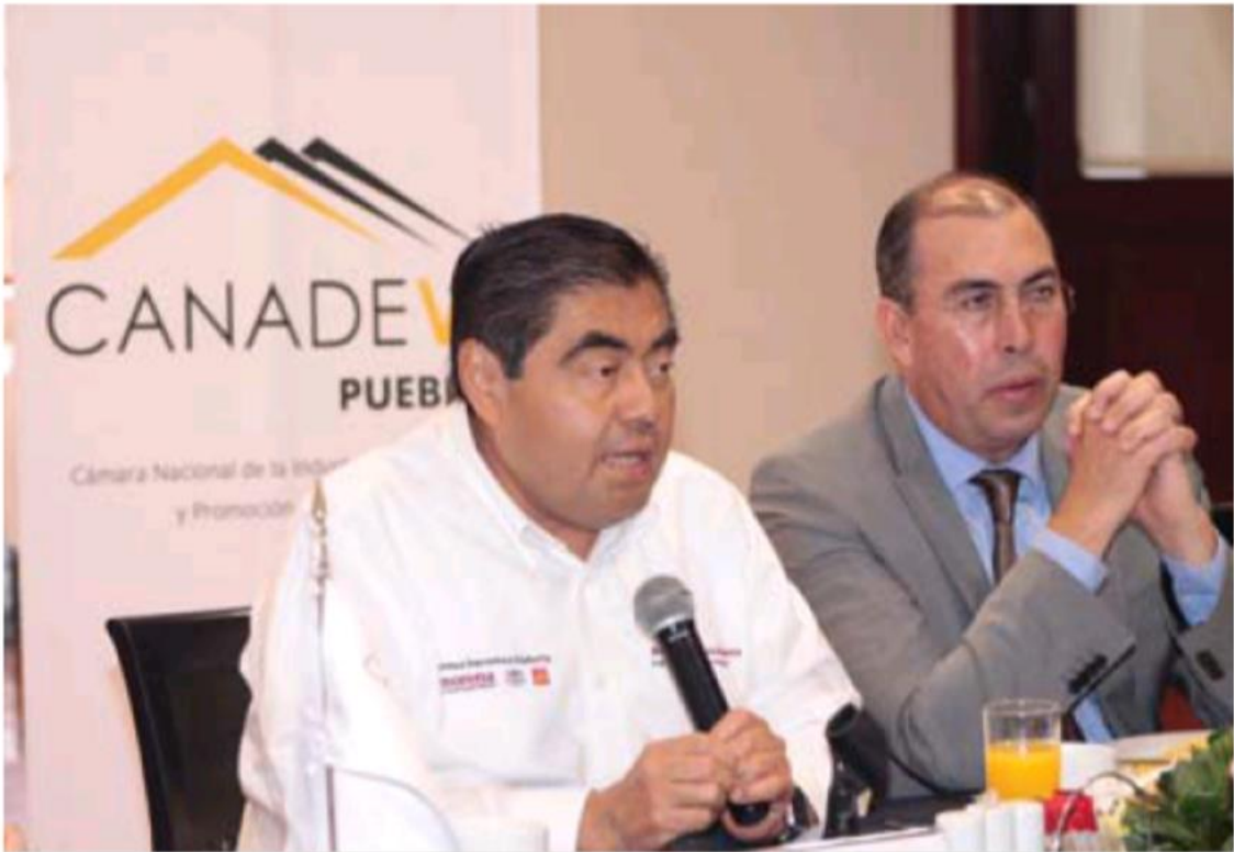
El aspirante de la coalición "Juntos Haremos Historia" se reunió con los desarrolladores de la vivienda.