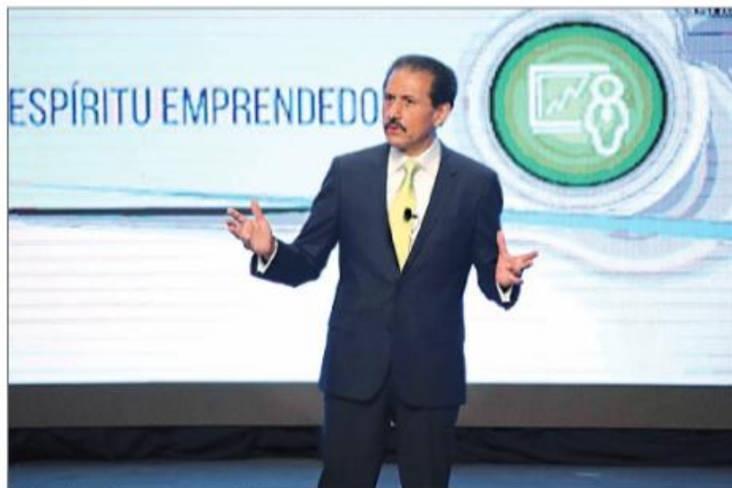
El dirigente de la máxima casa de estudios del estado ■ Foto: Jafel Moz / esimagen.com.mx

Moreno Valle es dueño hasta de ex priistas, afirma Doger, tras la desertión de Jesús Morales