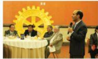
REUNIÓN CON ROTARIOS

Esta elección no se encierra en el acuerdo que el INE aprobó para el primer debate presidencial, pero coincide con el formato que tiene el Instituto Electoral del Estado (IEE) para el debate entre los candidatos al gobierno del estado. Pág. 5A