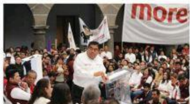
Luis Miguel Barbosa realizó su primer acto electoral en San Pedro Museo de Arte

Eliminar el programa de fotomultas y terminar con la concesión del servicio de agua potable en la zona metropolitana fueron, por su parte, las primeras propuestas del candidato del PRI Enrique Doger Guerrero, quien anunció campaña acompañando a los candidatos priistas del estado y del dirigente nacional de su partido, Enrique Ochoa Reza.