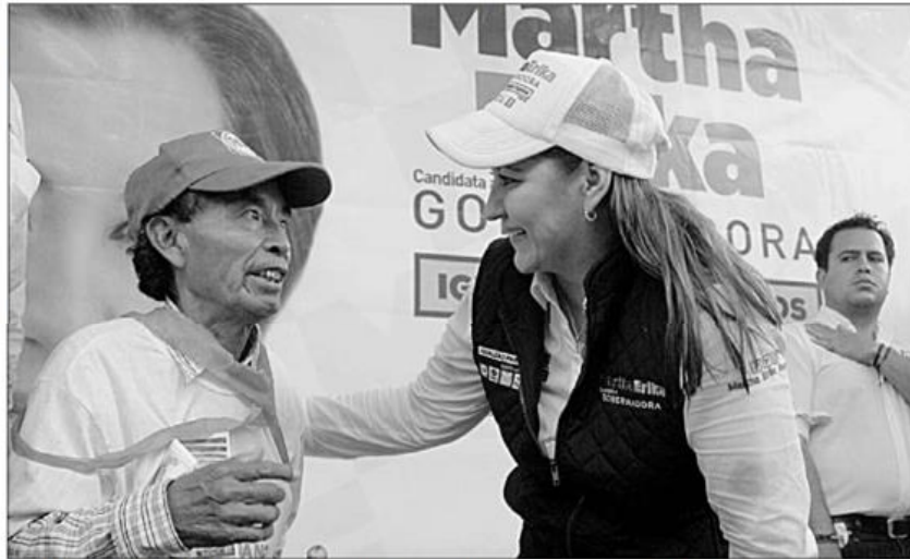
El acto se realizó ayer en una sala del Centro Expositor y de Convenciones, pero no fue organizado por el equipo de la postulante albi azul, sino por el partido magisterial

Tras agradecer la confianza, solidaridad y el respaldo de Nueva Alianza, la abanderada de la coalición Por Puebla al Frente, se comprometió a dar cumplimiento a cada uno de los 13 compromisos que firmó con la dirigencia nacional, por lo que refrendó que no les fallará a los maestros ni a los poblanos.