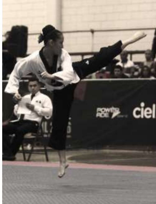
Figura 2 Técnicas

(Federación Mexicana de Taekwondo, 2023)