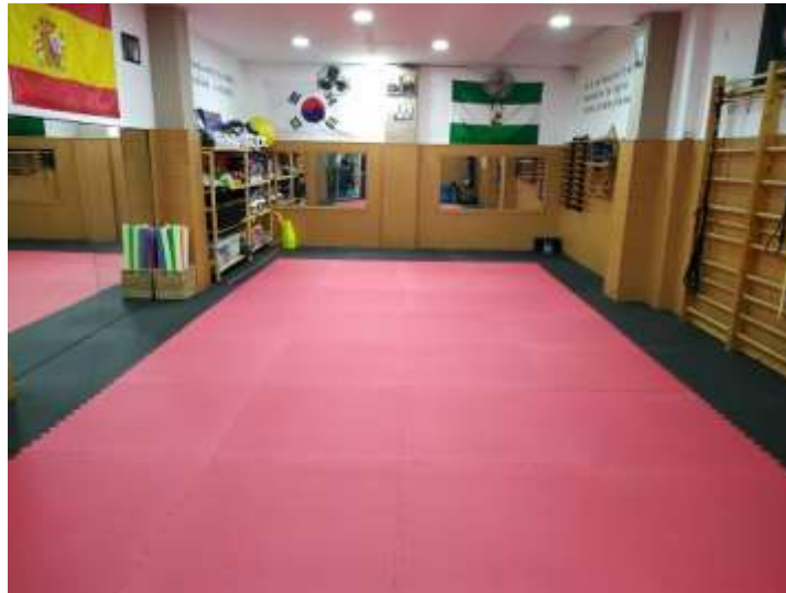
Figura 5 Doyang (Cardenas, 2019)

Es el espacio que ocupa los taekwondoines para su entrenamiento, pero este no es solo considerado un lugar para mejorar sus habilidades físicas y mentales, sino que se considera un lugar sagrado. En la antigüedad le pusieron el nombre de Doyang que significa “lugar de despertar”, los guerreros lo ocupaban para meditar y la celebración de sus ritos sagrados. Ellos como muestra de respeto hacia el Doyang, antes de entrar y al salir hacían una reverencia, consta de estar totalmente erguidos y hacer una inclinación del tronco. Al entrar al Doyang debe dejar todo aquello que le moleste del exterior y concentrarse en sus técnicas y meditación que el maestro le está enseñando e inculcando para su crecimiento físico, mental y espiritual. (Óbanos, Taewondo junior )