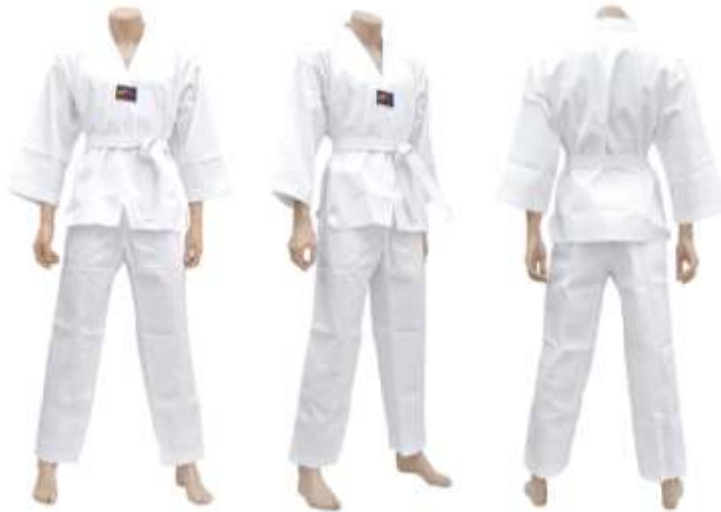
Figura 3 Dobok

La parte de arriba significa cielo, la parte de abajo que es la del pantalón significa tierra y el cinturón representa a la persona, y es la parte más importante del uniforme. (Óbanos, Taewondo junior )