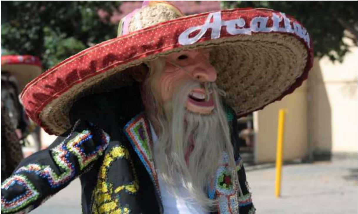
Esperando la procesión que inicia en el monumento al Tecuán durante la Celebración a San Rafael