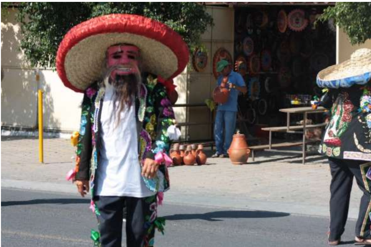
Tecuán en la entrada a Acatlán de Osorio, atrás vendedor de artesanías de barro