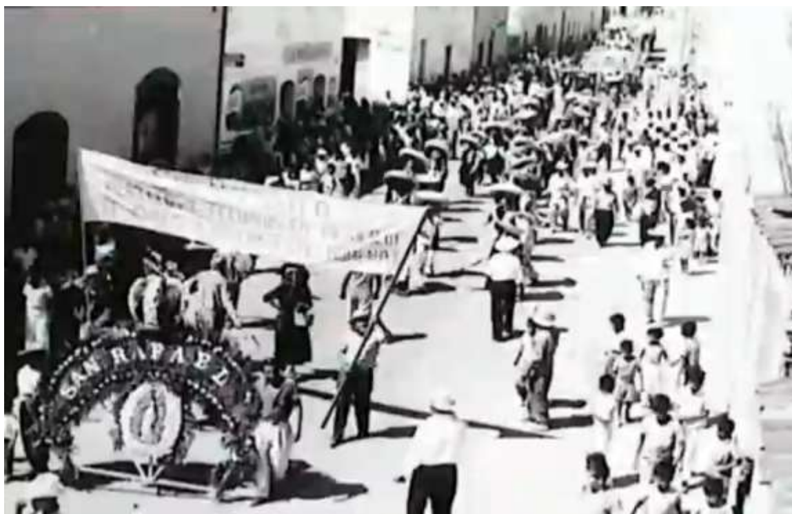
Foto antigua de procesión a San Rafael