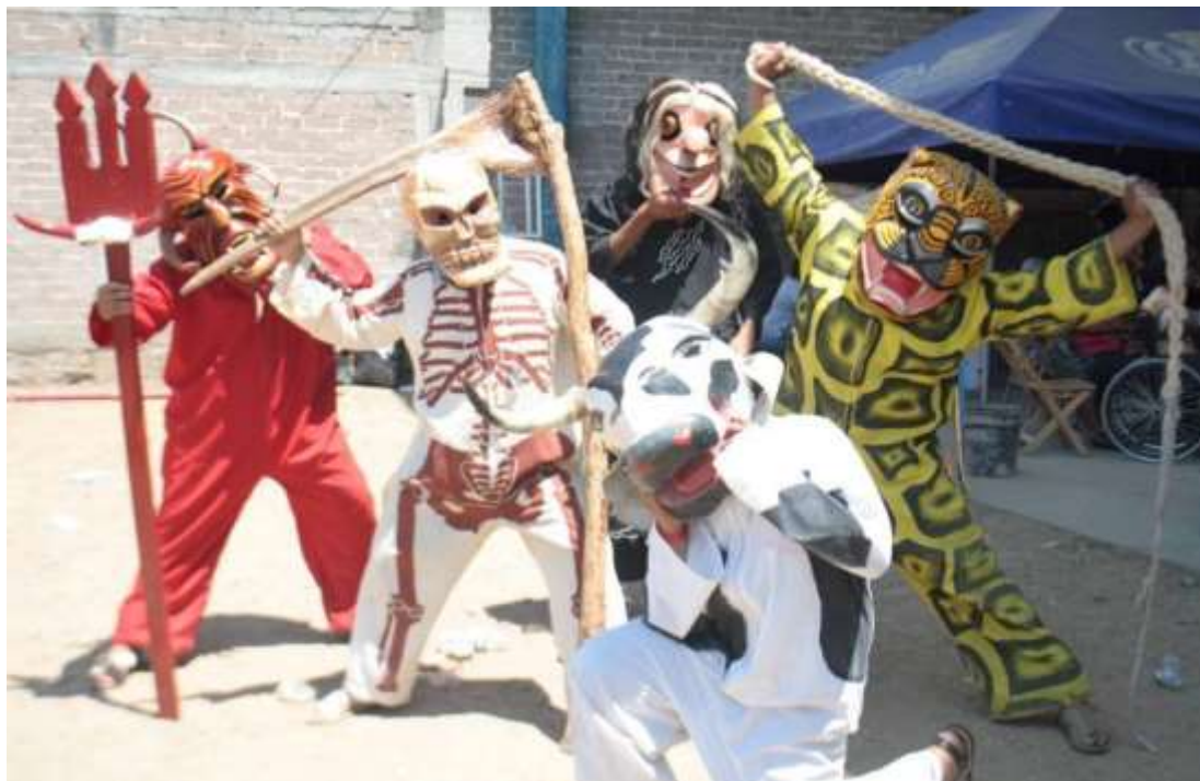
Parte de las denominadas "figuras", el diablo, la muerte, la bruja, el tigre y la vaca