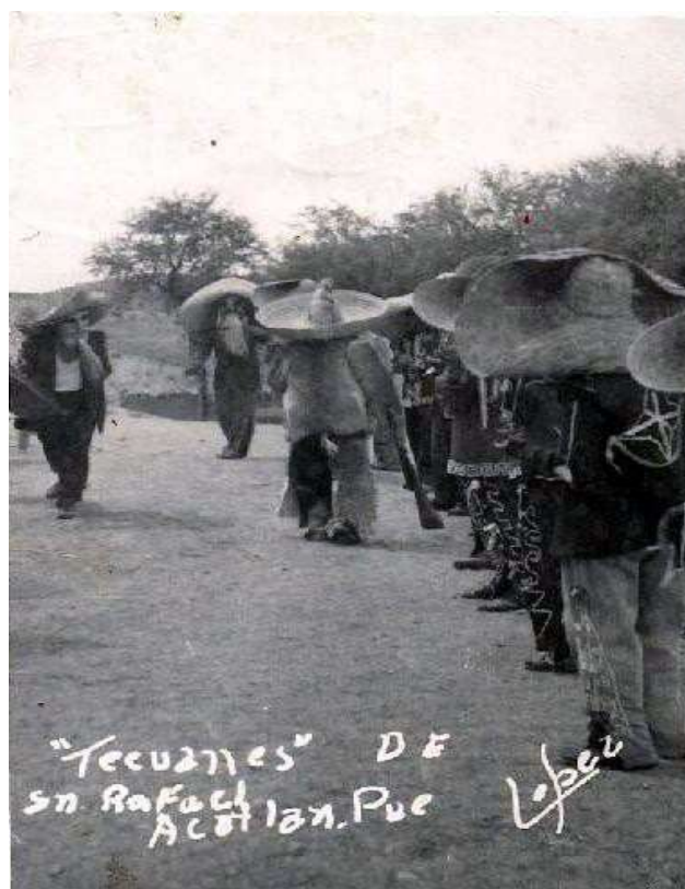
Danza de Tecuanes de San Rafael