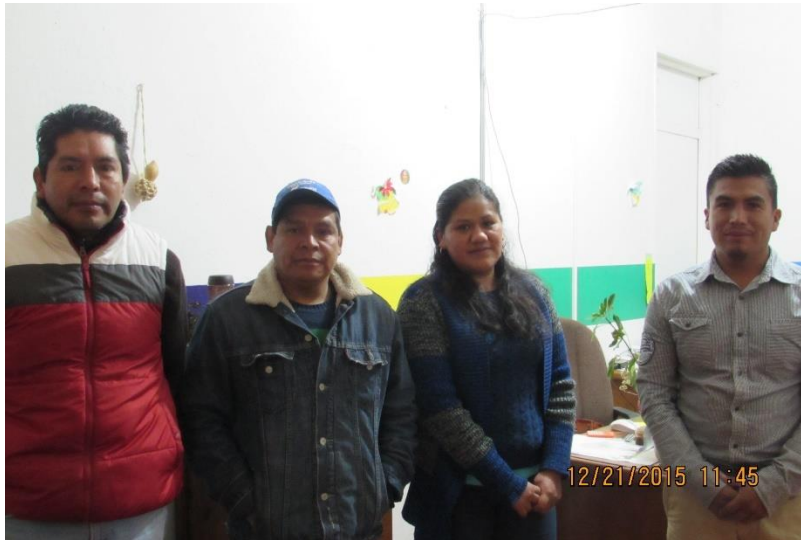
Fotografía de los 4 titulares del Concejo de Administración