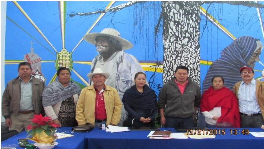
Fotografía de algunos integrantes del concejo mayor o K'eris.

Así que estas 12 personas se encargan de gestionar y representar a la comunidad frente a las instituciones políticas del Estado y la federación.