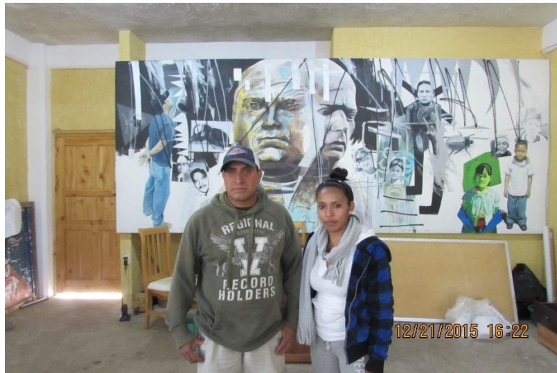
Fotografía de algunos de los integrantes del concejo de bienes comunales.

Este concejo además de encargarse de las empresas, se encarga de cuidar y delimitar el territorio de la comunidad, lo que antes hacía el comisariado y del cual solo se encargaba una sola persona. Y ahora está a cargo del concejo.