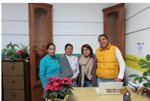
Fotografía de los 4 titulares del concejo de desarrollo social.

Es uno de los concejos que se integra mayormente por mujeres, donde se ve una mayor confianza por parte de la comunidad hacia la participación de las mujeres.