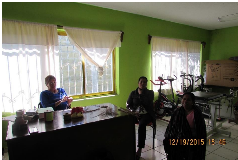
Fotografía algunas integrantes del Concejo de Mujeres

De esta forma el concejo de mujeres mantiene de forma unida dos instancias que cuidan los derechos de las familias, niños y mujeres para que estos sean respetados.