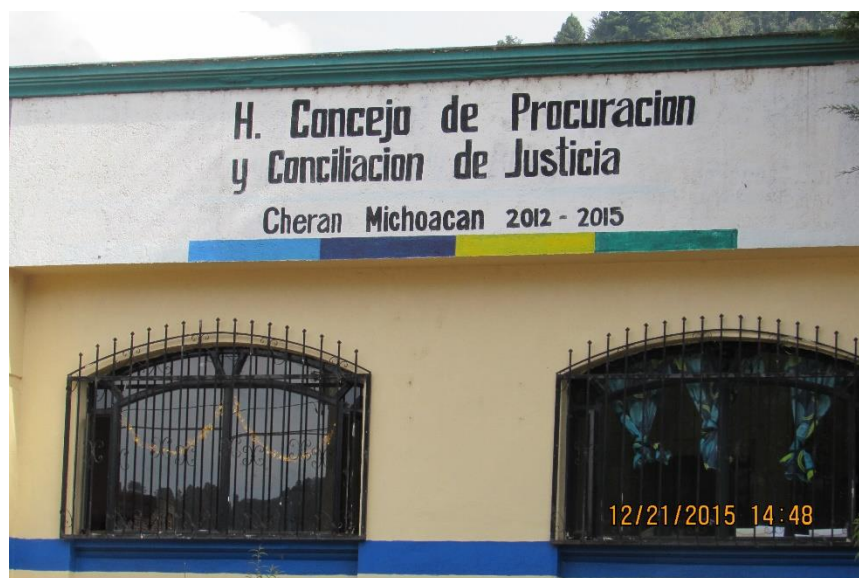
Fotografía de las oficinas del concejo de honor y justicia.

Ya que en este momento el crimen organizado se está reagrupando en el estado de Michoacán, por lo cual la comunidad debe estar preparada ante cualquier tipo de eventualidad que se pueda dar durante este proceso, además la relación con las instituciones de seguridad es buena y es una relación de respeto mutuo.