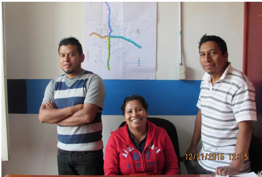
Fotografía de algunos integrantes del concejo de barrios.

Otra de sus atribuciones es que son los representantes de la asamblea en la parte política y cuando es necesario solicitar algo para su comunidad son parte de la comisión que se envía, pues al ser el concejo que está en constante comunicación con la población, saben cuáles son las necesidades inmediatas de esta.