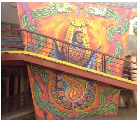
Foto del mural que se encuentra en la casa de cultura lugar donde se encuentra trabajando el concejo de asuntos civiles.

El concejo de asuntos civiles es uno de los concejos que se encuentra con una cercanía más directa con la gente, porque si bien todos tienen esta relación con la población, este concejo por las actividades que realiza interactúa directamente, con niños, jóvenes, y/o ancianos.