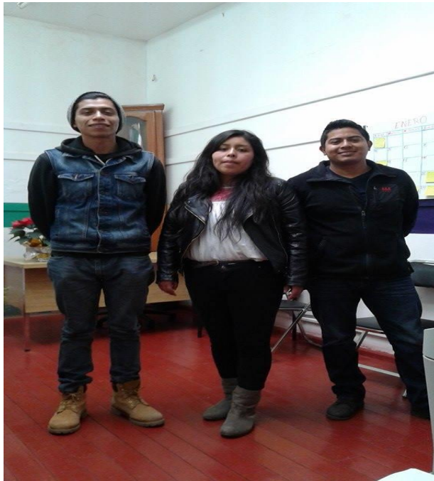
Fotografía de los integrantes de jóvenes del concejo de jóvenes, fotografía proporcionada por el propio concejo.

Son responsables de buscar espacios para la juventud, generando conciencia entre ellos para que incidan en sus asambleas de barrio y al mismo tiempo en la toma de decisiones de la comunidad.