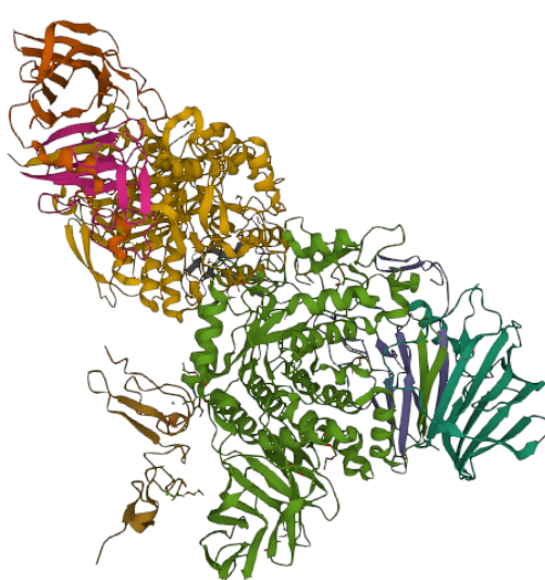
Figura 2. Estructura de la maltosa RCSB Protein Data Bank. 3d pfv: 719e [Internet]. Rcsb.org. [citado el 7 de noviembre de 2022]. Disponible en: https://www.rcsb.org/3d-sequence/7L9E?assemblyId=0