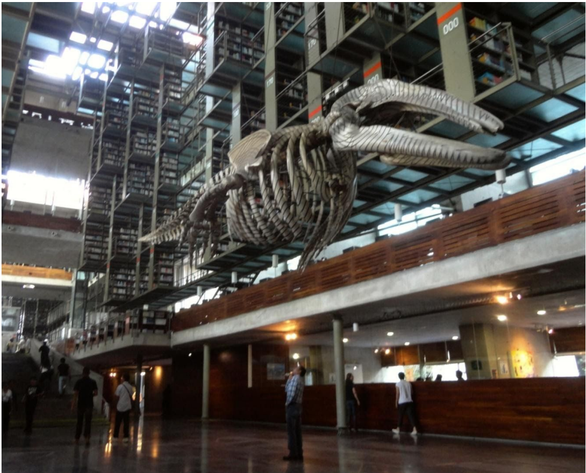
Matrix Móvil (Intervención, 2006)