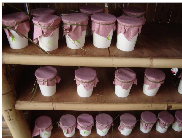
Imagen 5. Yogurt elaborado por el módulo de lácteos