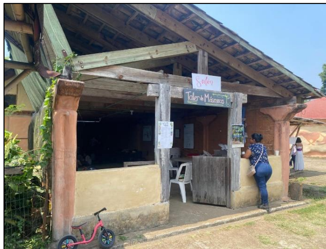
Imagen 8. Espacio recreativo de infancias y juventudes

Por otro lado, otros servicios que ofrecen es la administración, las publicaciones que hacen a través de los aprendizajes obtenidos de las actividades que realizan, la cocina es el espacio que se encarga de alimentar a las personas que asisten a los cursos y la escuela para infancias y juventudes de la cooperativa.