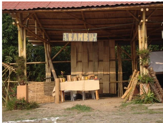
Imagen 3. Módulo de bambú