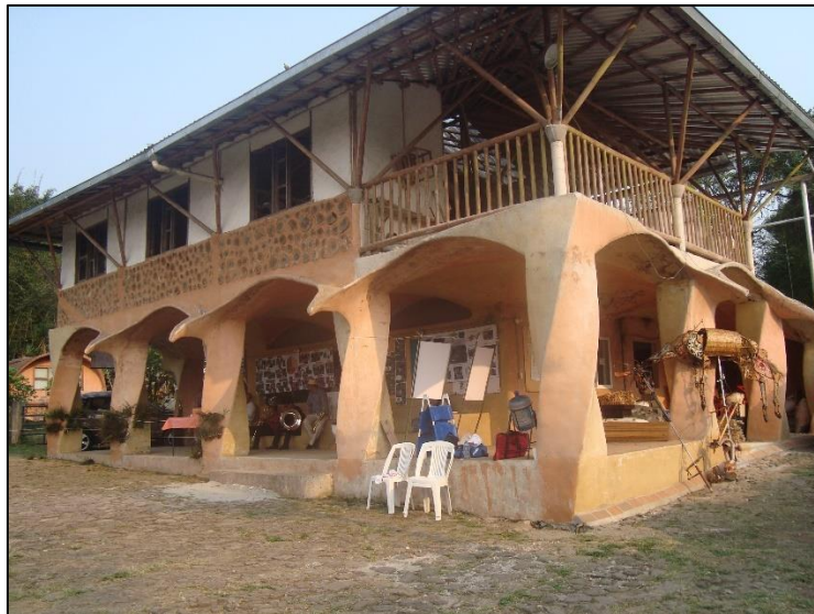
Imagen 1. Construcción del proyecto de “eco aldea”

En el 2005 constituye un proyecto fallido con duración de un año de una “eco aldea”; de la mano de amistades y personas afines a su clase social, tiempo después el fundador determinó al proyecto como “burguesía ecológica” y por ello, le puso fin.