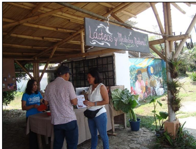
Imagen 4. Módulo de lácteos y medicina natural

A través del módulo de transformación, todos estos recursos que se obtuvieron de la producción pasan a ser productos que se pueden usar dentro de la comunidad, tal como se mencionó anteriormente, el taller de lácteos produce productos orgánicos derivados de este para su distribución entre los miembros de la cooperativa, el banco de semillas, el café, entre otros. La madera y el bambú, por otra parte, pasan a ser utilizados en el área de carpintería, bioconstrucción y ecotecnias.