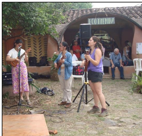
Imagen 6. Espacio de cursos convivencia y ecotienda

Cuenta con un servicio de cursos donde imparten desde técnicas y talleres para la construcción de sanitarios secos, el tratamiento de aguas grises, cultivos biointensivos, agricultura regenerativa, construir con bambú, principios de la agroecología, cocina sustentable, producción agroecológica de huevo, etc.