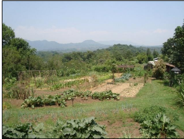
Imagen 2. Huerto biointensivo

y los huertos de semillas. Por otro lado, el área forestal de producción de madera y de bambú.