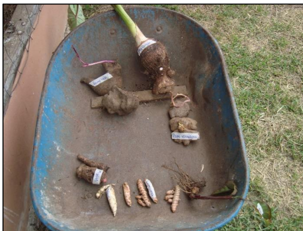
Imagen 10. Cosechas nativas del huerto biointensivo

cultivo de hongo shiitake. El clima subtropical exige el cultivo en callejones, además de que este sistema aumenta la resiliencia ambiental, principalmente se obtiene de estos cultivos papa voladora, malanga, ñame, yacón, sagú y yuca.