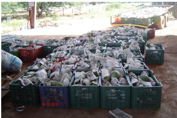
Figura 25. Fruta envuelta en periódico Foto tomada por el autor, 2004, En Campeche Campe.

3).- Recoger la fruta en cajas plásticas amplias donde la fruta no sobrepase y sea lastimada por la caja que se ensima. El utilizar cajas facilita el transporte y evita daños a la fruta.