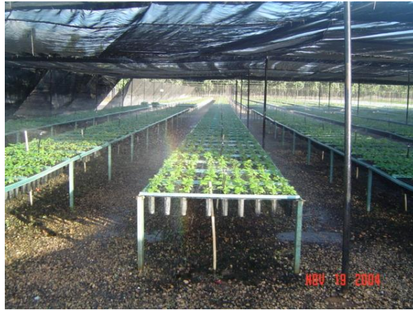
Figura 13. Llenado de contenedor y forma de acomodar Foto tomada por el autor, 2004, En Campeche Campe.

Cuando se utilicen charolas de unicel como contenedores, lo más recomendable es llenarlas con sustrato de turba como el Peat moos, lo más usual es humedecer el sustrato para que se facilite el llenado de charolas, aplicar aproximadamente 100 litros de agua por cada paca de 3.8 pies cúbicos.