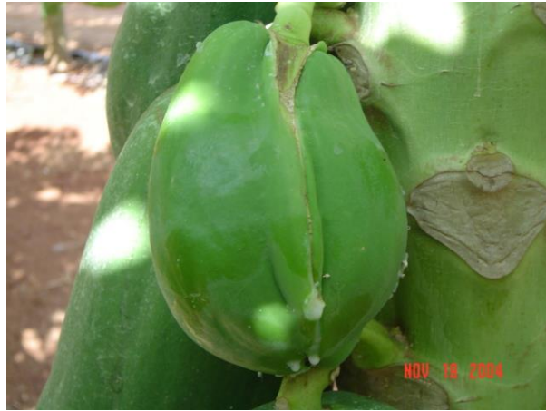
Figura 17. Fruta deforme por el efecto de carpelodia Foto tomada por el autor, 2004, En Campeche Campe.