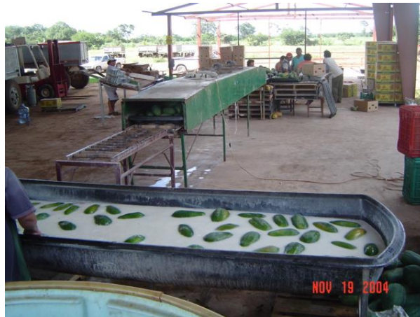
Figura 27. Lavado de fruta En Campeche Campe.

6).- Una vez que la fruta se transporta al empaque, se lava en una solución de jabón + cloro y posteriormente se pasa por fungicidas como el Flint + Manzate con la finalidad de evitar los hongos en el proceso de transporte y maduración.