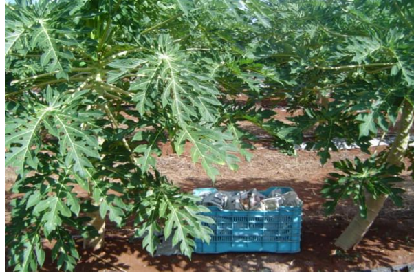
Figura 24. Coseche de papaya en cajas de plástico Foto tomada por el autor, 2004, En Campeche Campe.