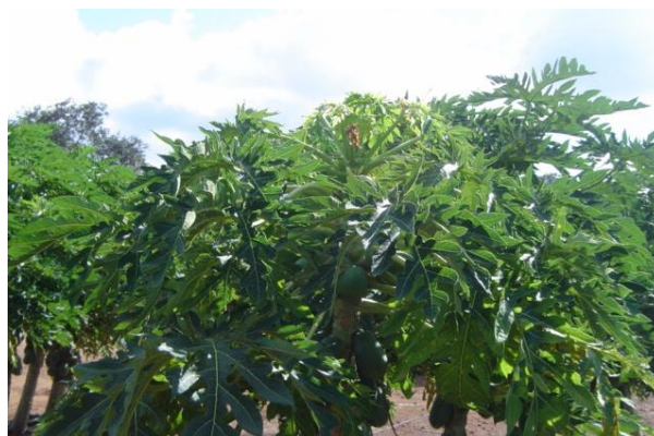
Figura 22. Síntomas de Micoplasma Foto tomada por el autor,2004, En Campeche Campe.

La aplicación se realizo dirigida al área foliar y en especial en el área apical. La aplicación dirigida a los frutos en periodo de 20 a 30 días efectúo un buen control, contra bacterias que afectan y limitan la calidad de la fruta.