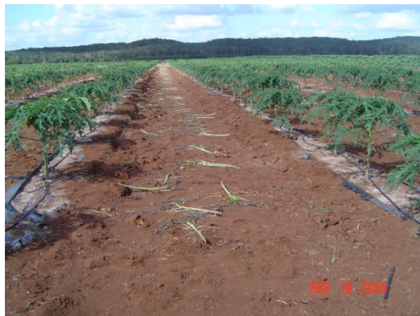
Figura 15. Practica de sexado Foto tomada por el autor, 2004, En Campeche Campe.

Esta actividad nos elevo los costos en la producción de plántulas ya que la inversión de semilla, insumos y mano de obra aumento de tres veces.