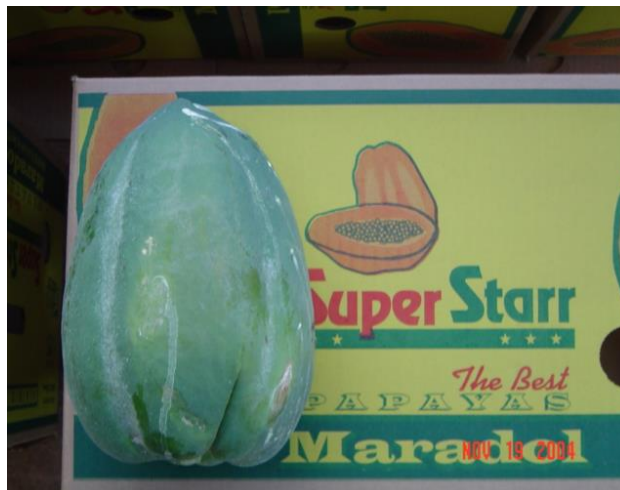
Figura 30. Fruta hembra de forma esférica.

El empaque es a granel envueltas en papel periódico, se transporta en camiones que pudieran llevar de 15 a 20 ton.