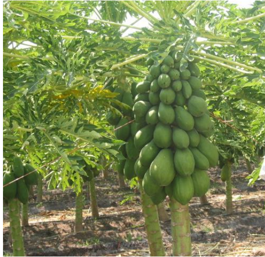
FIGURA 6, PLANTA TÍPICA MARADOL FOTO TOMADA POR EL AUTOR, 2004, EN EL ESRADO DE CAMPECHE.

La fruta tiene las mejores cualidades de embarque y almacén, gracias a la gran consistencia de su epidermis, un grueso mesocarpio, lenta maduración y superficie lisa. INIFAP (1997).