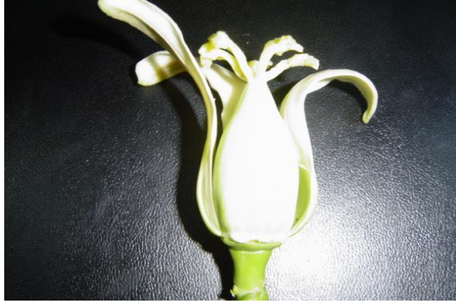
Figura 1. Flor femenina típica de papaya Foto tomada por el autor en el sureste Mexicano, 2004