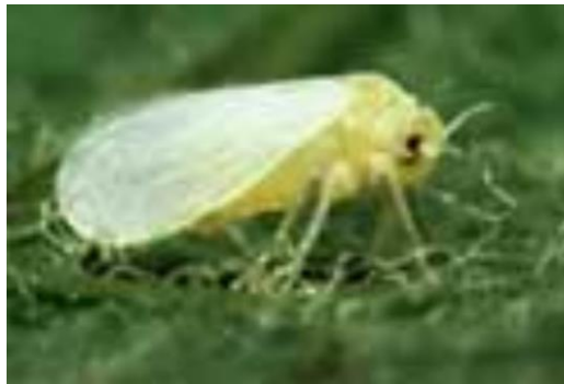
Figura 21. Mosquita Blanca

El ciclo biológico de B argentifolii transcurre de 17 a 21 días; las hembras depositan un promedio de 160 huevecillos que producirán dos hembras por cada macho. Esta especie tiene mayor potencial reproductivo que las otras mosquitas blancas, razón de su mayor peligrosidad y del temor que despierta entre los productores.