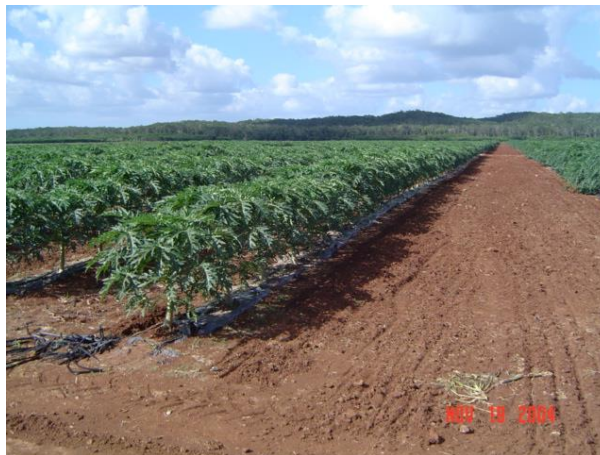
Figura 14. Rastreo de calles con tractor Foto tomada por el autor, 2004, En Campeche Campe.

Se realizo con la utilización de rastras ligeras de corte angosto tirado por tractor. Lo cual controlo malezas que aparecían en los callejones y contornos del cultivo.