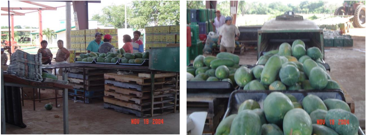
Figuras 28 y 29. Secado de fruta Foto tomada por el autor, 2004, En Campeche Campe.

8).- Después de lavarla y tratarla se selecciona por tamaños y formas, para designa su venta que puede ser mercado Nacional o de EUA, dependerá de su calidad.