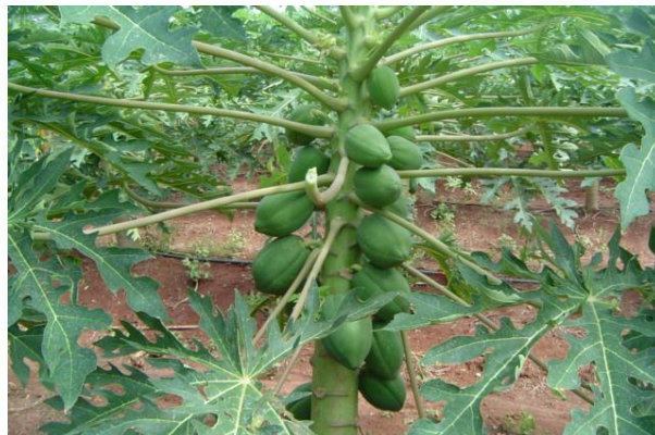
Figura 4. Planta femenina Foto tomada por el autor, 2004, en el Estado de Campeche

Estas plantas producen inflorescencias femeninas con pocas flores (figura 4) y son muy estables para producir frutos durante el año, siempre y cuando existan buenas condiciones de humedad en el suelo y haya un buen abastecimiento de polen en la plantación. Este tipo de planta produce frutas de forma esférica, lo cual no es tan recomendado si se pretende exportar. Mandujano (1993).