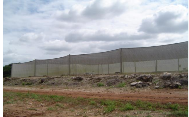
FIGURAS 9,10. Vivero protegido con maya antiafidos. Foto tomada por el autor,2004, En Campeche Camp.

A continuación se menciona el mecanismo para determinar el número de Planta/Ha.