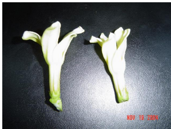
Figura 3. Flor hermafrodita estéril o alargada Tomada por el autor (2004) en el Sureste Mexicano

Como se muestra en la figura 3 es una flor muy parecida a la hermafrodita elongata, pero no desarrolla su ovario por cual es estéril, debido a la manifestación de temperaturas muy calidas o de una deficiencia de agua en el suelo que causa estrés hídrico. Puesto que produce únicamente polen funcionalmente es una flor masculina. INIFAP (1997).