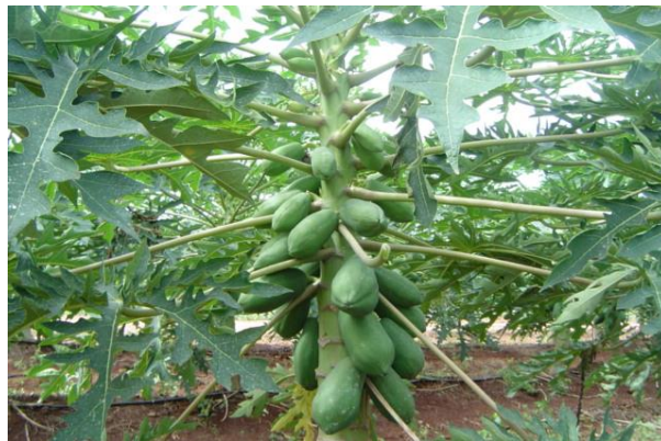
Figura 5. Planta Hermafrodita Continuamente Fértil 2004, En el Estado de Campeche

Produce principalmente flores de tipo hermafrodita elongata en la parte central de la inflorescencia así como en las laterales. En ocasiones se observan flores masculinas o de tipos hermafroditas pentandrias o intermedia. Muy rara vez producen flores hermafroditas estériles. Junto con las plantas femeninas son las más deseables para producir fruta. Mandujano (1993).