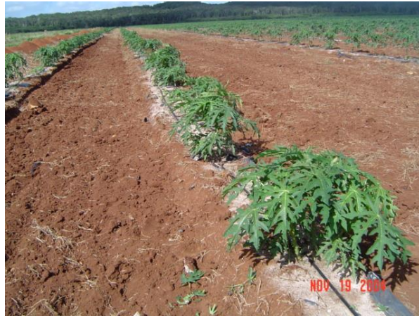
Figura 11. Marco de plantación a doble hilera Foto tomada por el autor, 2004, En el Estado de Campeche Camp.