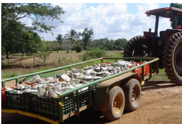
Figura 26. Recolección de fruta en remolque Foto tomada por el autor, 2004, En Campeche Campe.

3).- Recoger la fruta en cajas plásticas amplias donde la fruta no sobrepase y sea lastimada por la caja que se ensima. El utilizar cajas facilita el transporte y evita daños a la fruta.