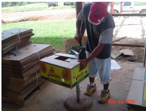
Figura 33. Armado de cajas

El empaque se realiza en cajas de cartón envueltas en papel, a cada caja se le colocan de 7 a 12 frutas dependiendo del tamaño, con la finalidad de que cada caja pese un promedio de 16 kg. A continuación se ilustra en las figuras.