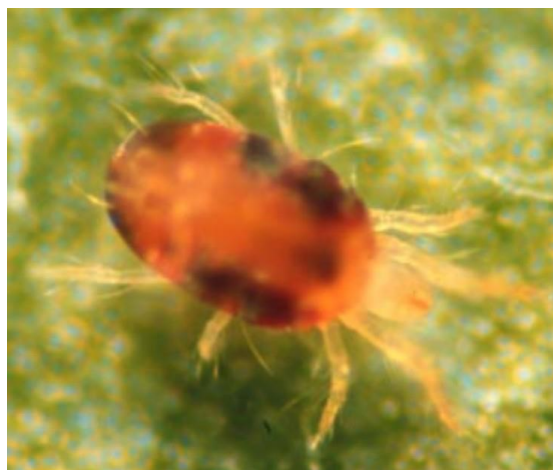
Figura 19. Araña roja

Cuando no se observen síntomas de la plaga no se deberá aplicar ningún control ya que de forma natural existe una cantarina del género Sterthorus que se alimenta de Huevecillos, Ninfas y adultos de esta plaga y puede ser un buen control.