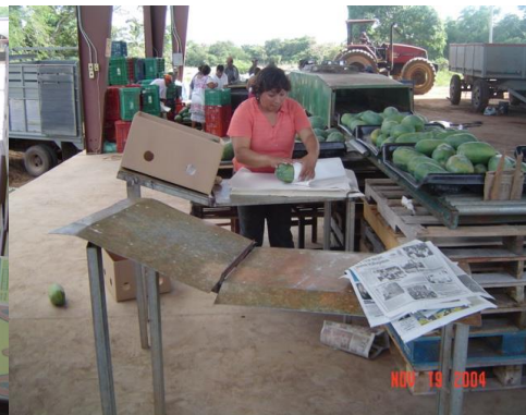
Figura 34. Empaque de frutas