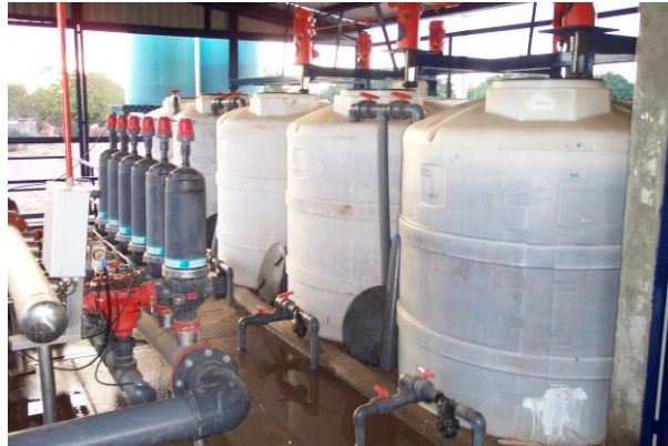
Figura 14. Cabezal de control de un sistema de riego por goteo Foto tomada por el autor, 2004, En Campeche Campe.

4). Tuberías y cintilla de goteo. El sistema de distribución y aplicación del agua esta constituida por tuberías y cintilla de goteo, los cuales se clasifican y definen de la siguiente manera: