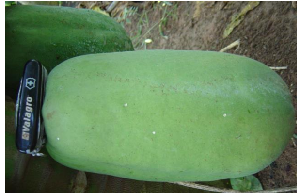
Figura 31, 32. Parámetro de corte en frutas hermafroditas. Fotos tomadas por el autor, 2004, En Campeche Camp

El empaque se realiza en cajas de cartón envueltas en papel, a cada caja se le colocan de 7 a 12 frutas dependiendo del tamaño, con la finalidad de que cada caja pese un promedio de 16 kg. A continuación se ilustra en las figuras.