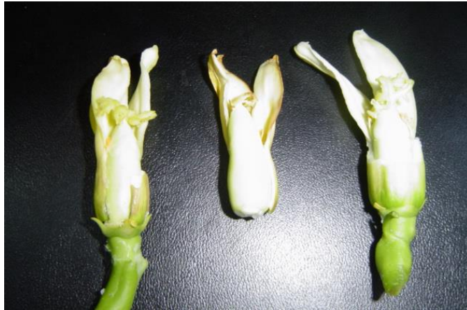
Figura 2. Flor hermafrodita pentandria Tomada por el autor (2004) en el Sureste Mexicano (Campeche)