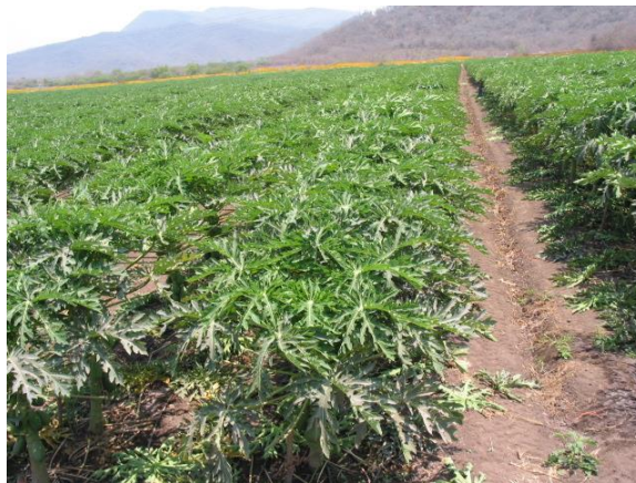
Figura 16. Deshoje de plantas 2004, En Campeche Campe.

Las hojas se eliminaron hasta una altura que no permitió que el sol dañará los frutos con quemaduras.