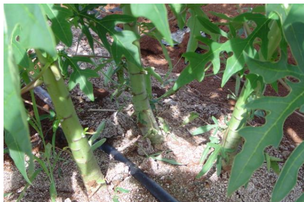
Figura 12. Tres plantas por sitio Foto tomada por el autor, 2004, En Campeche Campe.