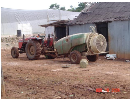
Figura 18. Equipo de aplicación Foto tomada por el autor, 2004, En Campeche Campe

El método de aplicación de los pesticidas se realizó con equipo de aspersión tiradas de un tractor, con la finalidad de obtener mejor cobertura en la aplicación y además se redujo considerablemente el costo de la aplicación.