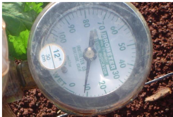
Figura 23. Lectura de tensiometro Foto tomada por el autor, 2004, En Campeche Campe.

Una de las técnicas utilizadas en el cultivo de papaya que dio prácticamente buen resultado, fue el uso del tensiometro, que nos ayudo a mantener un nivel de humedad optimo. Además el uso del tensiometro nos ayudó a definir la frecuencia de riegos, de forma práctica y sencilla. Los parámetros óptimos de lectura del tensiometro se encontraron en niveles de 18 a 20 centibares.