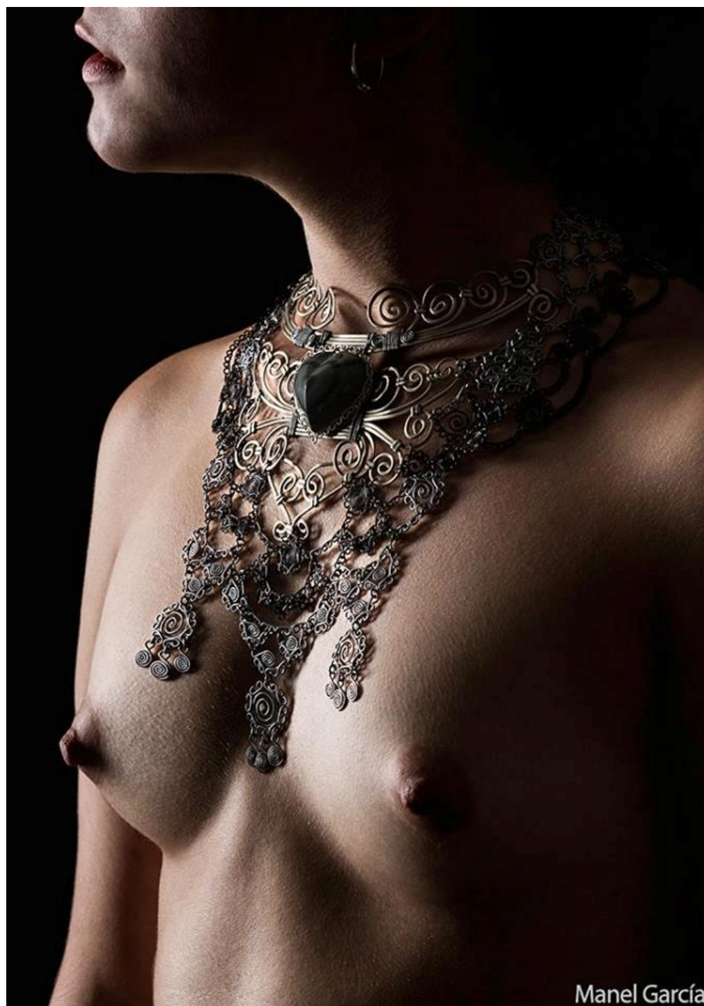
Obra de "Zu" usada por modelo española. Año: 2016 Modelo: anónima Fotografía: Manel García.