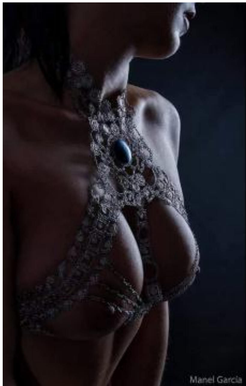
Obra de "Zu" usada por modelo española. Año: 2016 Modelo: anónima