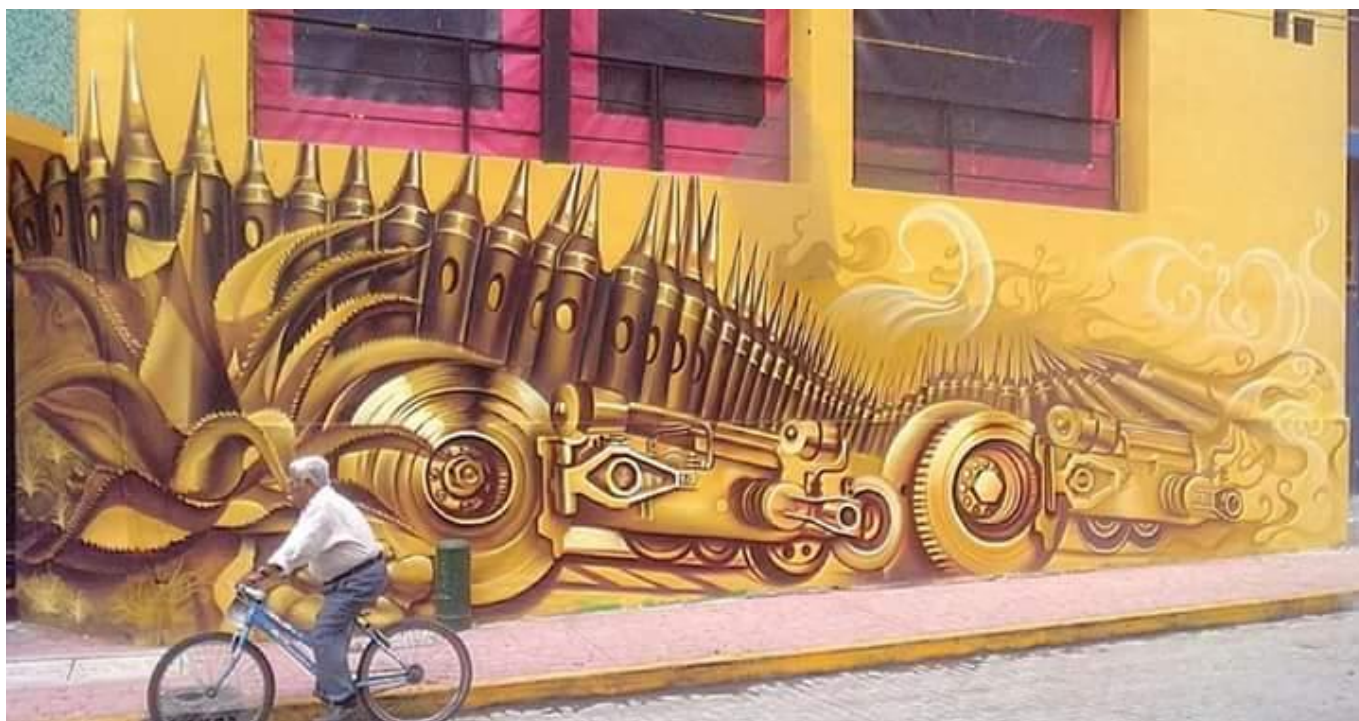
Mural sin título Medidas: 2x7 m2. Autor: "Bowen" Año: 2002

Alusivo al nombre del municipio de Tlazazalca, "tierra de arcilla" en Michoacán. Los elementos gráficos de la obra representan la actividad guerrillera que se vive en el municipio. Mismos amigos del autor pidieron la realización de este mural como reflejo de pertenencia cultural al ámbito de la guerrilla, los colores en tonos mostaza y arcilla representan el significado propio del lugar.