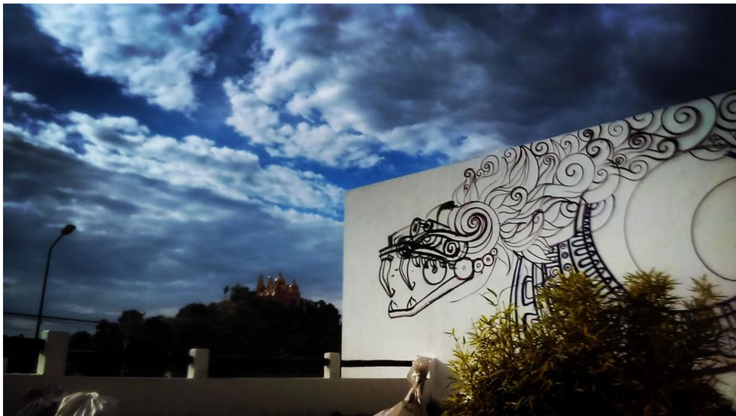
Bosquejo de mural en Cholula. Título: "Invención de un Dios maya". Medidas: Muro de 5x12 m2. Autor: "Bowen" Año: 2015 Fotografía: "Bowen"

Bosquejo y trazo de mural en representación de un dios maya, el cual muestra la visualización personal del artista con a las culturas antiguas y su relación con la actualidad, de ahí la ubicación de la obra, cercana al parque de las siete culturas en San Pedro Cholula, dejando ver en la fotografía el contraste teológico entre la concepción de una deidad maya y la materialización de la religión católica reflejada en la iglesia.