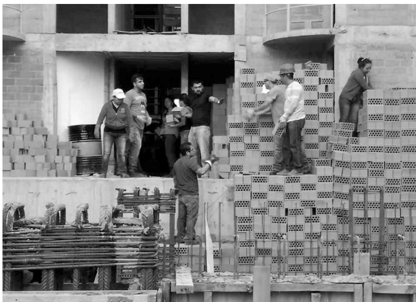
FOTO 3. Jornadas de acarreo de tabique, grava y arena en Centauro del Norte.

Las jornadas tienen su inspiración en otras formas colectivas de trabajo como el tequio, la mano vuelta, las mingas o la faena 143 . Tal como planteaba en el segundo capítulo, la OPFVII rescata un conjunto de prácticas colectivas provenientes de la memoria de lucha social, de la “tradición de lxs oprimidxs”. Además, es necesario reconocer que muchxs de lxs Panchxs provienen de una historia de proletarización y migración del campo a las ciudades; por lo que, reconocen dichas prácticas colectivas en su propia subjetividad.