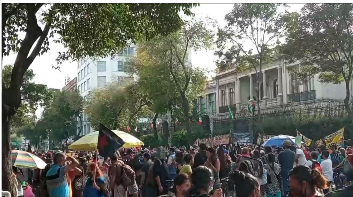
FOTO 4. Marcha y plantón en apoyo al EZLN y por el alto a la guerra. 25 de septiembre 2021.

En consecuencia, los plantones y las marchas resultan dos estrategias fundamentales para la OPFVII en su relación con las formas sociales capitalistas, en particular con los gobiernos de las diferentes alcaldías en los que se ubican sus asentamientos-cooperativas-comunidades y con el gobierno de la CDMX; pero también, para su relación con otras lucha sociales y entre lxs Panchxs. En cuanto a la relación con el gobierno, la intención de los plantones y las marchas es ejercer presión a fin de que se reconozcan sus derechos, se firmen acuerdos o se agilice la realización efectiva de los acuerdos firmados.