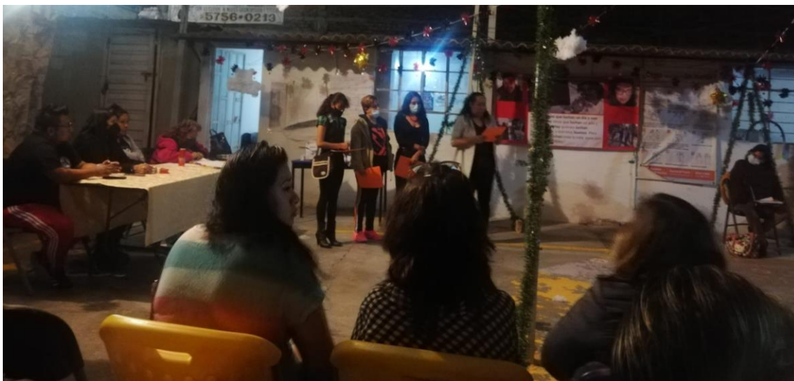
FOTO 6. Lectura de informes-balances, planes de trabajo y presupuestos para el año 2022. Comisiones de Centauro del Norte.

En este apartado no busco explicar a profundidad la configuración de las instancias de deliberación y organización de los trabajos colectivos de la OPFVII, por lo que no trataré qué son ni cómo se configuran las comisiones y el CGR; ello fue reflexionado con el analizador poder popular . En todo caso, la intención es reflexionar la pre-ocupación de la cual emanan las actividades realizadas en estos espacios y analizar las maneras en que dichas actividades concretas transforman los modos de subjetivación particulares de la OPFVII.