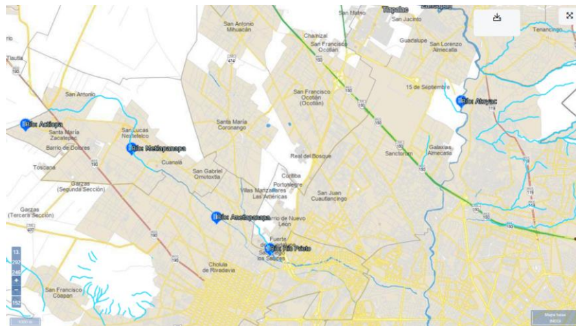
Ubicación del río Metlapanapa en el municipio de Juan C. Bonilla