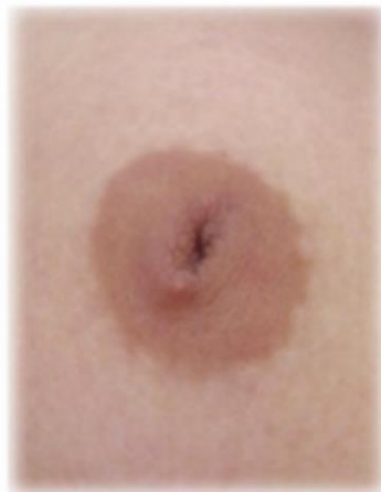
Figura 2. Grado II del Pezón.