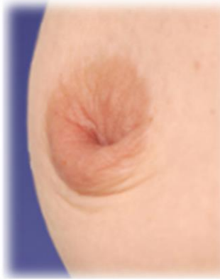
Figura 3. Grado III del Pezón. Recuperado de http://www.hispali.mx/wp-content/uploads/2014/03/SDVSDV.png

Además de los problemas de salud físicos que conlleva el embarazo en la adolescencia, este se puede ver afectado por aspectos psicológicos como lo es el trastorno de la imagen corporal donde hay una preocupación que produce malestar, hacia algún defecto imaginario de la apariencia física de la persona. Esto se le llama: distorsión perceptiva. Un ejemplo de hoy en día es el de las jóvenes que teniendo un peso normal se ven con sobrepeso. Raich, 2004. Desde este aspecto es importante que el profesional de Enfermería aborde e intervenga en el tema de embarazo en la adolescencia para su prevención de este, proporcionando educación sexual Armendáriz & Medel, 2010. Desde el rol profesional de enfermería es necesario educar y brindar apoyo a las adolescentes sobre las implicaciones que tiene un embarazo a temprana edad y con ello disminuir las complicaciones durante este proceso fisiológico; por lo que al abordar este tema enfermería contribuye en la estrategia de asegurar un enfoque integral y la participación de todos los involucrados para reducir la mortalidad materna del Plan Sectorial de Salud, Noguera & Alvarado 2012.