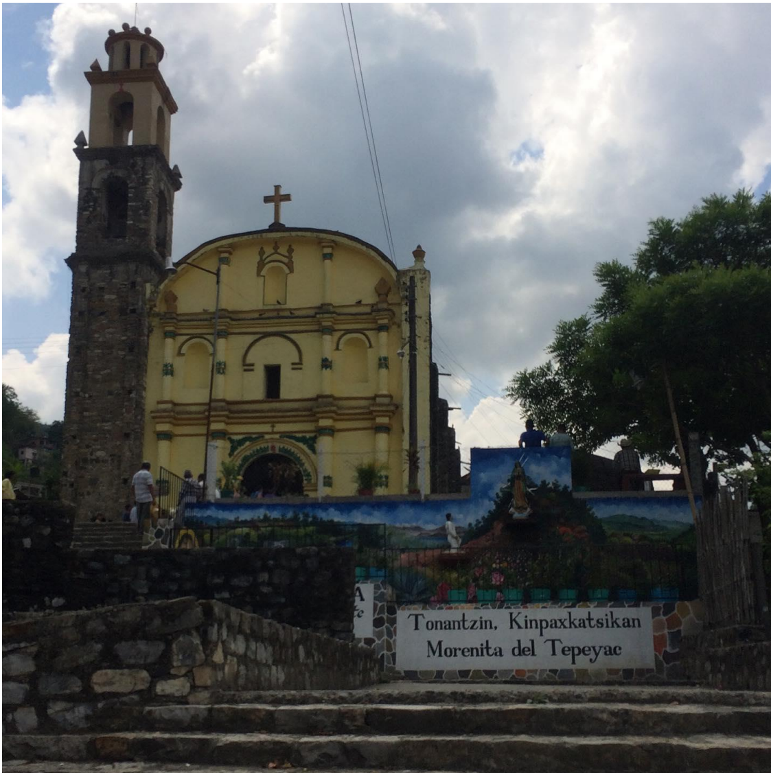
Foto 2.- Parroquia de San Andrés Chicontla, es de tipo colonial y data del siglo XVI. Es uno de los lugares más representativos de la comunidad, ya que en su mayoría la población es católica.