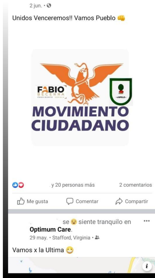
Foto 7.- Captura de pantalla del perfil de un migrante de Chicontla que radica en Estados Unidos, en donde demuestra su apoyo y pertenencia a un partido político en las elecciones de junio del 2021 en su municipio. En la parte inferior se encuentra una publicación que refiere su ubicación en Virginia y su situación respecto a la vacunación contra el virus SARS-Cov2.