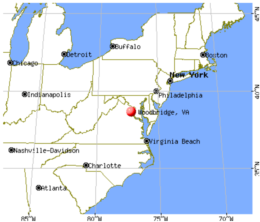
Mapa 3.- Ubicación geográfica de Woodbridge en el estado de Virginia, Estados Unidos, principal comunidad de destino en la que se asientan los migrantes de Chicontla debido a las redes sociales que se han establecido entre ambas comunidades desde hace varios años.