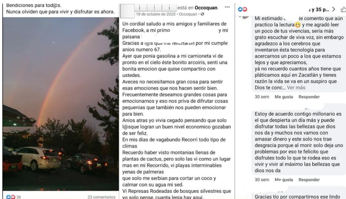
Foto 4. Capturas de pantalla vía Facebook en las que se muestra una reflexión personal del migrante dueño de la cuenta en torno a una fotografía que tomó y la interacción que se tiene con los destinatarios mediante los comentarios de la publicación. En este caso se puede observar que estos espacios son utilizados por migrantes como un modo de conexión con su familia, amigos y paisanos, por lo que esta red social responde a una lógica de expresión de afectos pública (bajo lógicas contextuales) lo cual otorga a los usuarios de esta red la posibilidad de elegir deliberadamente el contenido que desea que sea compartido en cada espacio, lo que nos deja ver una intencionalidad de la expresión de afectos, opiniones, recuerdos, etc., generando una expansión de la comunidad a espacios virtuales.