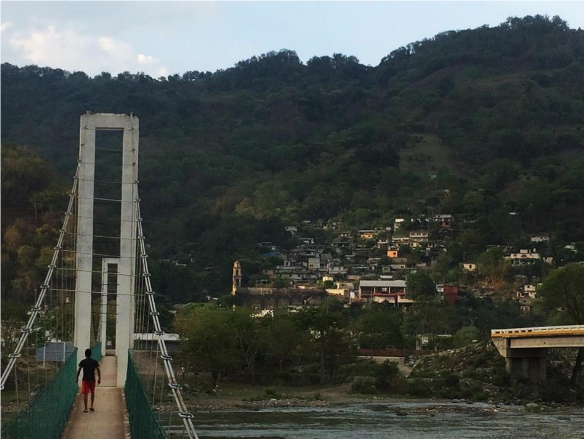
Foto 1.- Chicontla vista desde el puente peatonal que permite cruzar el río de Necaxa.