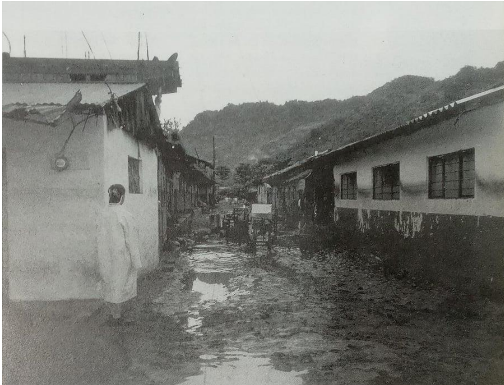
Foto 6.- Afectaciones tras la inundación en Chicontla en el año 1999, en el lado derecho se ubica la casa de la señora Flor, en donde se destacan las marcas en la pared que indican hasta dónde llegó el agua y el lodo durante la inundación.