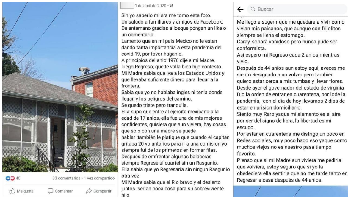
Foto 3. Capturas de pantalla de la publicación vía Facebook de un migrante de la comunidad en el que comparte una foto trabajando en el techo de una casa, junto a una reflexión personal que realiza en torno a su experiencia migratoria. A través de este ejemplo, se puede observar la expresión de los afectos por medio de las redes sociales, ya que estas posibilitan la interacción de los migrantes con su familia y el resto de la comunidad, creando espacios de interconexión en donde expresan pensamientos, recuerdos, opiniones o imágenes cargados de significados emotivos, como el que se muestra en este caso.