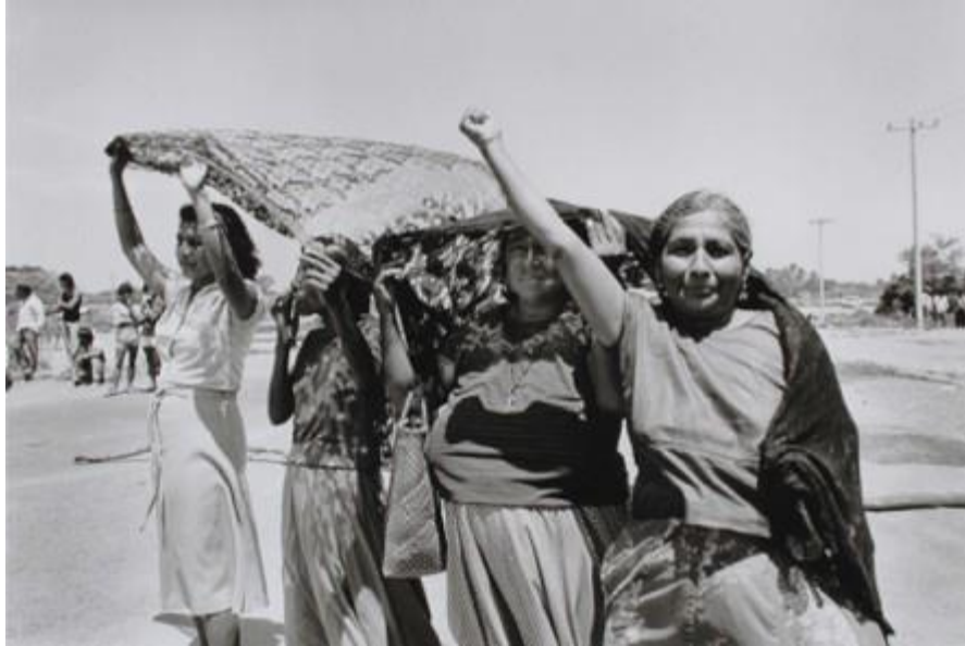
Figura 1. Marcha política de la COCEI. Graciela Iturbide. Juchitán, México, 1984 Del Instituto de Artes Gráficas de Oaxaca (IAGO)

No obstante, Rubin indica que la construcción del discurso del matriarcado es parte de un mito de la literatura [y del cine] que pretende colocar a la mujer istmeña como un ideal de autonomía distinto al masculino, en este tenor, se generó una romantización de la mujer tehuana, figura que ha sido retomada por algunas creaciones artísticas y estudios antropológicos. Misma figura que no sólo ha sido reproducida y apropiada por algunas mujeres, sino también adoptada, potenciada y proyectada por los muxe' quienes, según me han referido en las entrevistas que he realizado, en esos mismos años, empezaron a portar ropa de mujer (huipiles y rabonas). Los muxe' también participaron en los movimientos políticos de la época, a ellos se les adjudicó los espacios relacionados con las enfermedades sexuales como el VIH y SIDA (Rubin 1975).