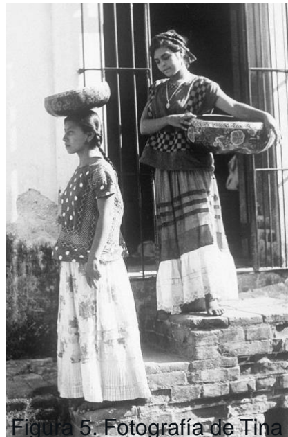
Figura 5. Fotografía de Tina Modotti (1929).