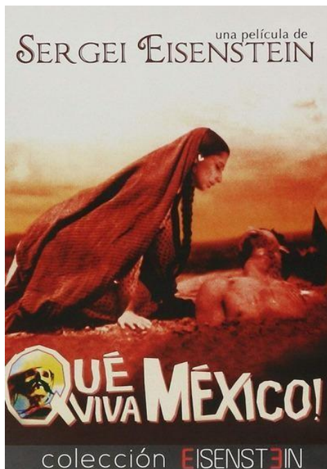
Figura 2. Portada de la película Qué viva México de Sergei Eisenstein (1930).