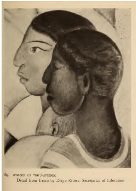
Figura 4. Ilustración por Diego Rivera en Idols Behind Altars (1929) de Anita Brenner.

El contacto temprano de Anita Brenner (1929), una escritora, antropóloga, historiadora y periodista mexicana, con los artistas posrevolucionarios Diego Rivera, Siqueiros, José Clemente Orozco y la fotógrafa Tina Modotti (ver figura 5) se encuentra también reflejado en la obra de la autora. Según De los Reyes es muy probable que también exista influencia de Brenner en el trabajo de Tina Modotti.