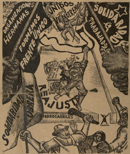
El reajuste debe hacerse a costa de los otros empleados de la Dirección y de los departamentos, no a costa de los obreros y empleados de la Confederación, como pretenden sus enemigos moralistas. Trabajadores del país: ¡Llanto a detener los cambios, cuente lo que cuente! Trabajadores de todo el país: ¡Llanto a prestar apoyo solidario a los ferrocarrileros!

ner en su dirección a trabajadores honrados. Aliarse con las demás organizaciones del transporte. Independizarse de la Compañía que puede falsear la conducta de los líderes laboristas como la de los "unionistas". Tal programa de edificación y saneamiento sindical, debe ser llevado a efecto con toda energía y con sistema. Los trabajadores de la República deben justipreciar, de lo que es la división entre los trabajadores. Ningún resultado práctico para los trabajadores, porque con dos organizaciones, la Compañía tiene la suficiente audacia para esparciendo su oro invalidar las peticiones de una y otra. La unidad es la única salvación de los tranviarios, y como la de éstos, la de toda la clase obrera. Por sobre los líderes, por sobre sus campañas de eterno divisionismo, debemos unificar el esfuerzo y el empuje de la clase trabajadora amenazada en sus más elementales intereses. ¡Por la Unidad! ¡Por el saneamiento sindical! ¡Por la independencia de las organizaciones obreras de controles burgueses y gubernamentales! ¡UNIDOS VENCEREMOS!