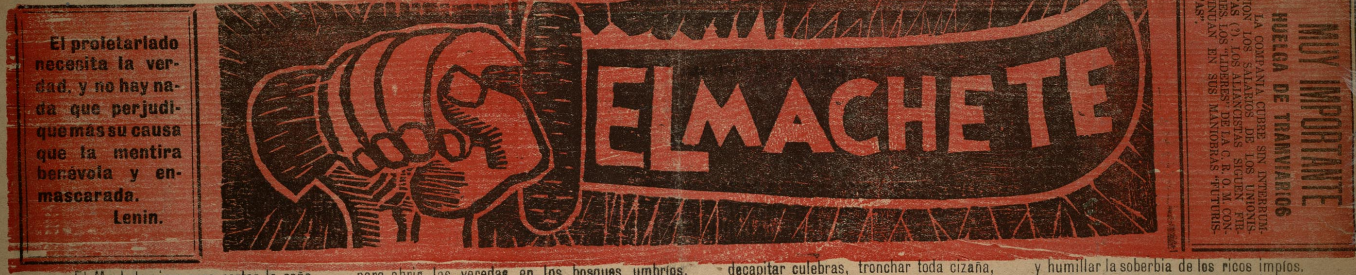
El Machete sirve para cortar la caña, para abrir las veredas en los bosques umbríos, decapitar culebras, tronchar toda cizaña, y humillar la soberbia de los ricos impíos.

Número 34 Responsable: JOSE ROJAS México, D. F., del 12 al 19 de Marzo de 1925 Registrado como artículo de 2a. clase el 15 de marzo de 1924. Redacción: Uruguay 160 Apartado 2793