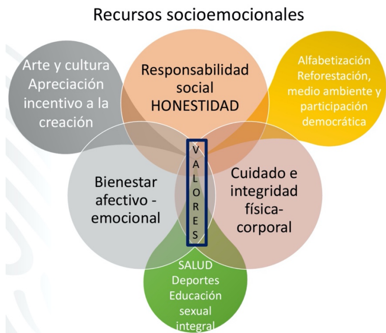
Figura 1. Recursos socioemocionales (SEP, 2019).

Por otro lado, se presenta el desarrollo integral en EMS con un currículum ampliado que promueve una escuela abierta, en la cual se pueda involucrar la comunidad participando en la transformación social, para lograr esto, se propone una serie de recursos socioemocionales que los docentes deberán desarrollar en los alumnos, mostrados en la figura 1.