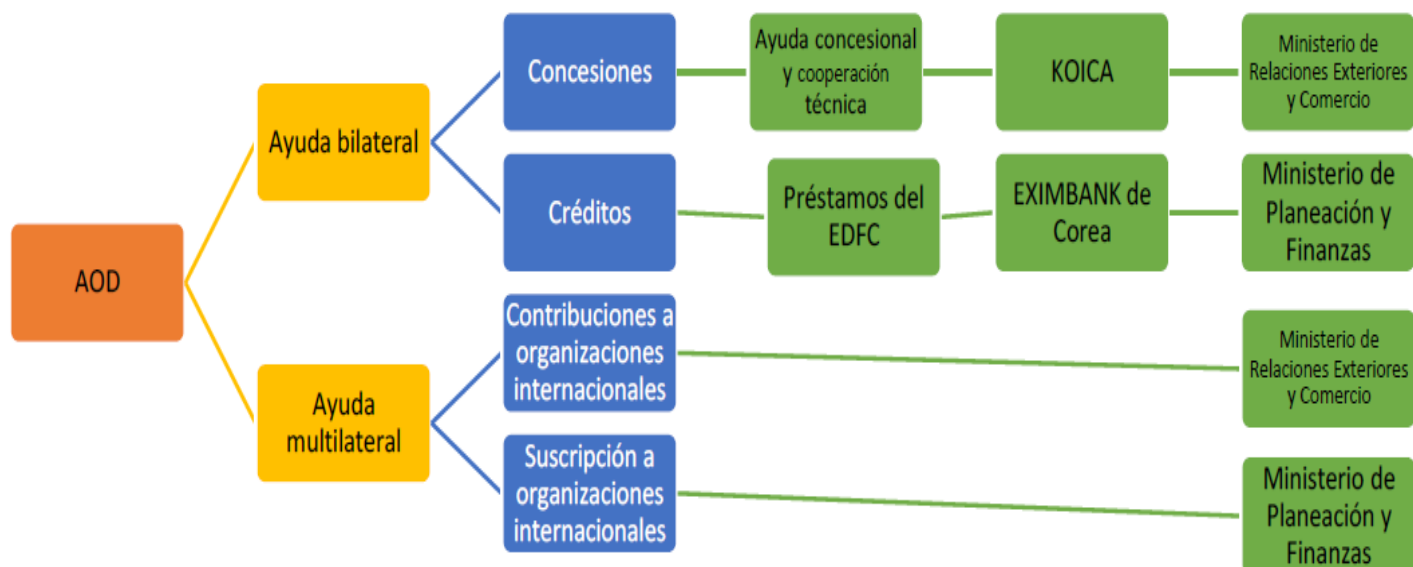
Esquema 1. Estructura de la AOD surcoreana