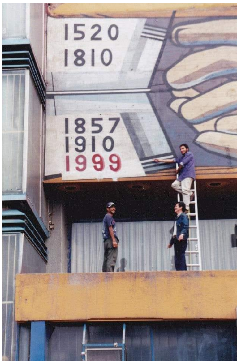
Imagen 5. Murales que fueron borrados después de la entrada de la PFP a las instalaciones de Ciudad Universitaria.

Posteriormente en el Palacio de Minería se reunieron para acordar el formato. El CGH exigió que fuera público, abierto y resolutivo mientras que la comisión de rectoría se mantuvo firme en la ausencia del público y de manifestaciones afuera del recinto. Se llegaron a reunir entre el 5 y 15 de julio sin llegar a un acuerdo.