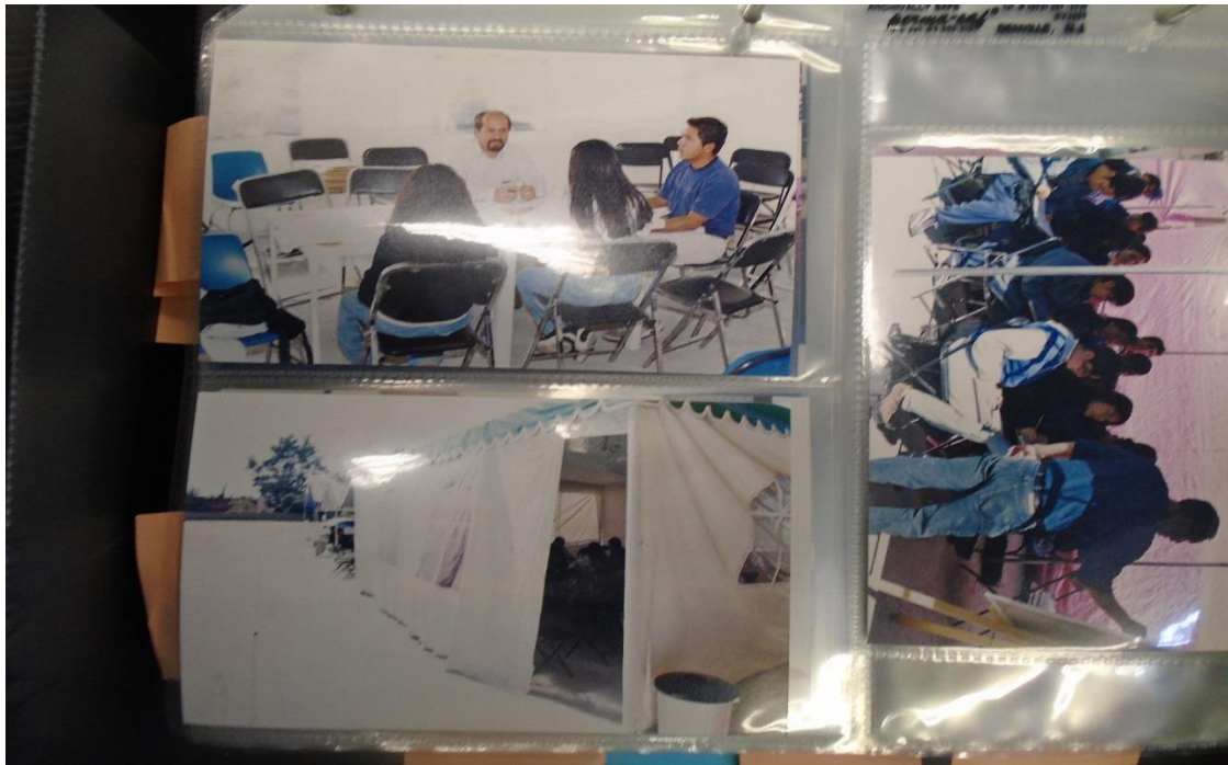
Imagen 3. Colección Huelga 1999-2000. Sobre 22, negativo 30. Imagen, serie Actividades extramuros