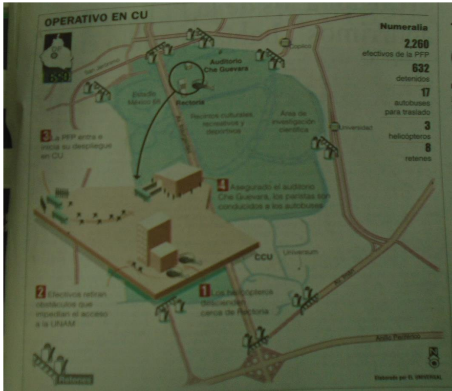
Imagen 7. Operativo en CU. Tomado del periódico El Universal. 7 de febrero 2000

muchacha de la preparatoria 6, sufre una crisis nerviosa. Camino a la ambulancia, una adolescente del CCH-Oriente gime; “yo no quiero ir, no me hagan nada”. Hay parejas que se dan largos abrazos de despedida. También llantos breves. Un grupo decide entonar el himno a la alegría. Los helicópteros vuelan más abajo cada vez. Aquí todo fue de manera muy educada, relata el hombre que comandó la ocupación policiaca de la Facultad de Derecho, rodearon el plantel, entraron y fueron despertando a cada uno de los muchachos, “¡ey, amigo, levántate! ¡Vámonos! No hubo resistencia. (Lara, 2000).