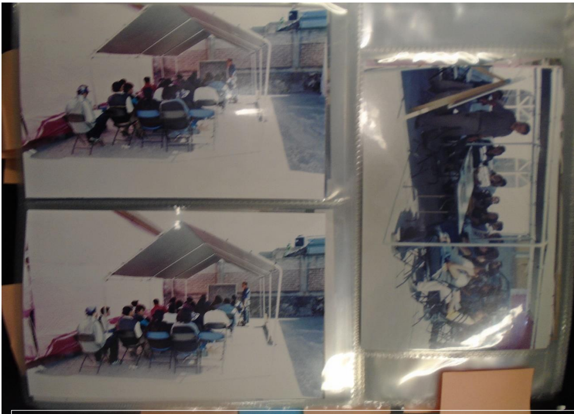
Imagen 2. Colección Huelga 1999-2000. Sobre 22, negativo 30. Imagen, serie Actividades extramuros