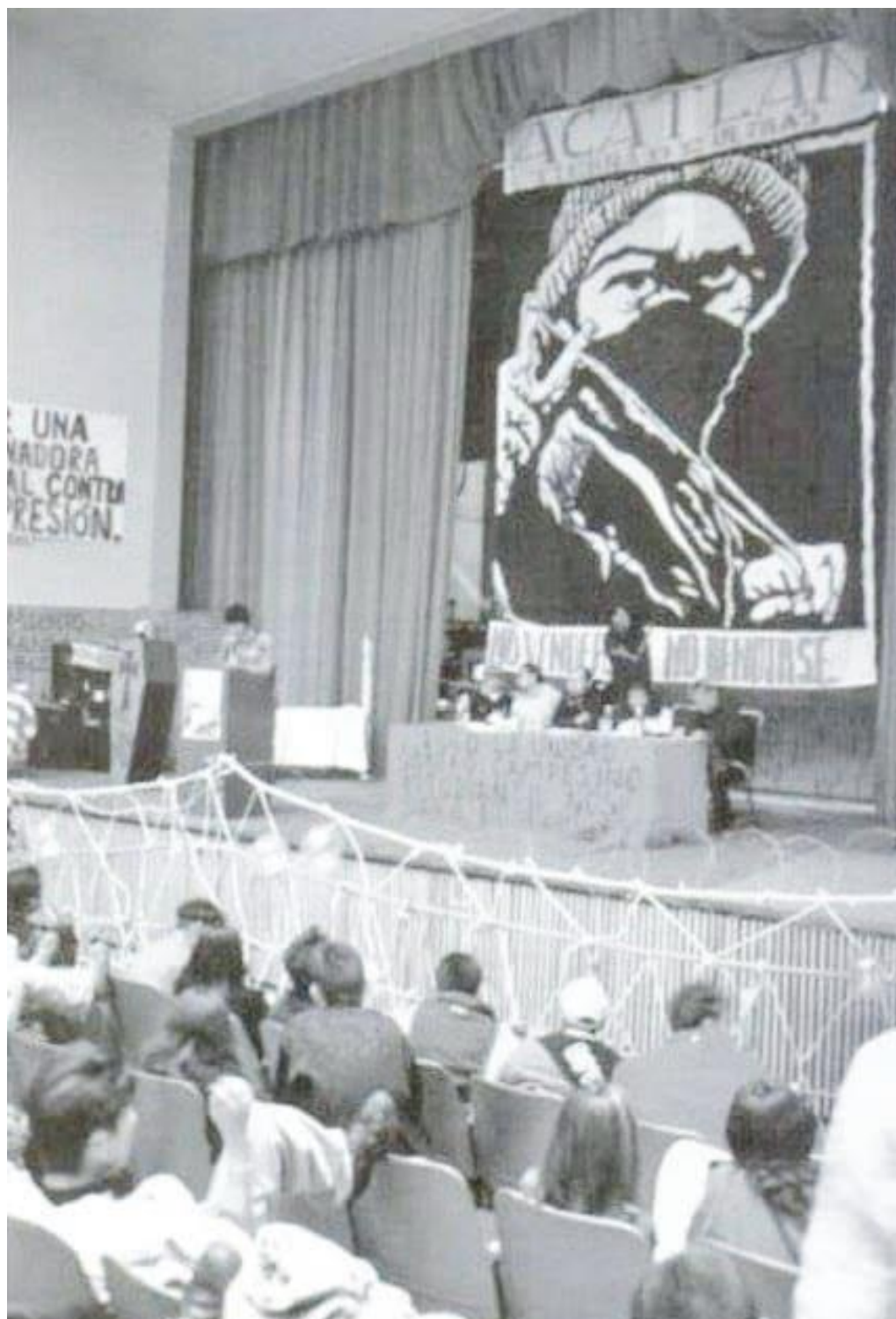
Imagen 6. El CGH en Acatlán, octubre 1999.