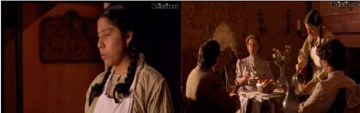
Fotograma 1. Primer plano, plano medio corto y plano medio. (Arau, 1992, 8'44")

Referente a la puesta en serie, se utilizan algunos nexos como record en donde se corta una escena para pasar a otra.