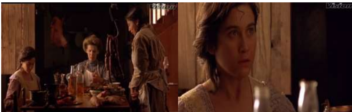
Fotograma 11. Plano General y Plano Medio (Arau, 1992, 48'30")

La situación en concreto es Mamá Elena y Tita se encuentran trabajando cuando Chenchá llega a decirles la trágica noticia de la muerte de su nieto y sobrino, respectivamente. Tita comienza a llorar, mientras que Mamá Elena se muestra seria y fría ante la situación. Incluso llega a gritar y golpear a Tita por su llanto.