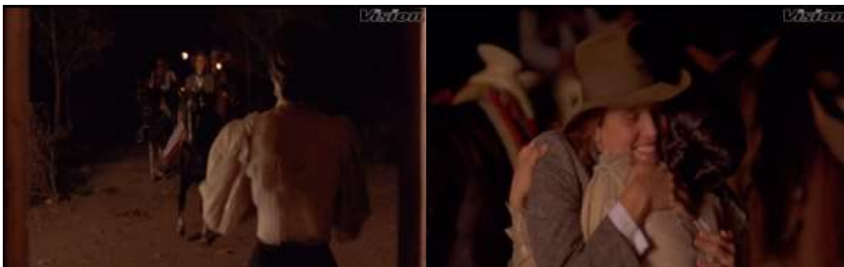
Fotograma 12. Plano general y plano medio (Arau, 1992, 1:13:00)

Las tomas son con planos generales y planos medio como se muestran en el fotograma 12. El plano general ayuda a mostrar cuando llega Gertrudis y poder ver a la gente con la que viene, los planos medio para observar la relación entre dos sujetos, en este caso las dos