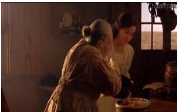
Fotograma 2. Cocina tradicional (Arau, 1992, 13'25")

Los tres personajes se encuentran en esta secuencia en una cocina tradicional hecha de madera y barro, cocinan con leña por lo que el lugar tiene ventanas hacia su patio haciéndolo un lugar agradable y fresco para estar tal como se ve en el fotograma 2; algunas hoyas y trastes cuelgan de las paredes e incluso encima de su larga estufa.