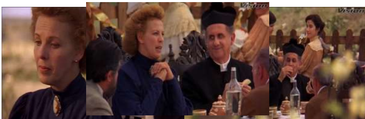
Fotograma 7 (Arau, 1992, 39'35")

Se utilizan también planos medios que cubren desde la cintura hasta la cabeza, normalmente ayudan a mostrar la distancia entre dos o más sujetos, mostrados en el fotograma 7.