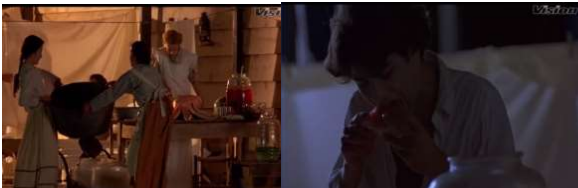
Fotograma 10. Arau, 1992, 41'08")

Respecto a los nexos que se observan en el fotograma número 10 se observa la transición de tiempo pues pasan del día a la noche