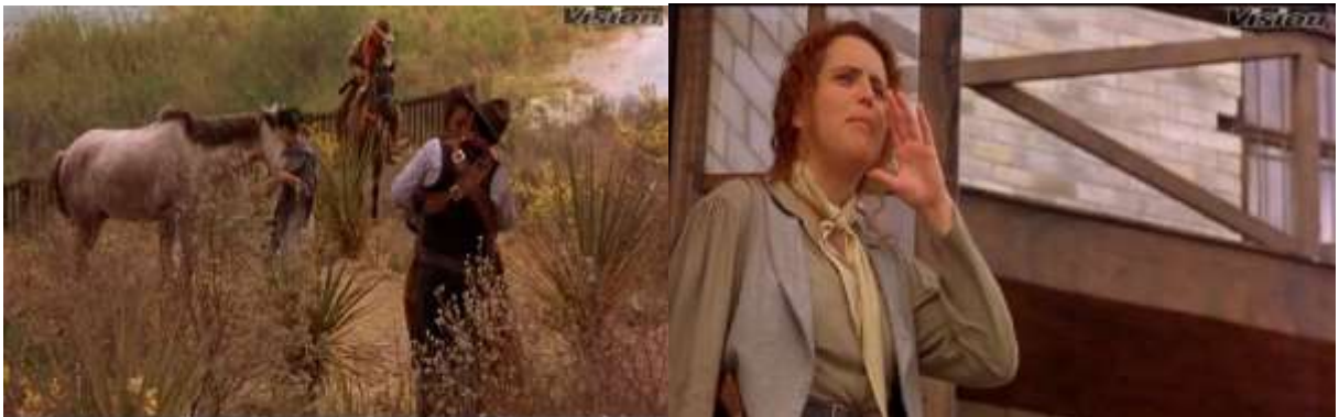
Fotograma 14. Plano general en imagen superior, plano medio en inferior (Arau, 1992, 1:15:45)

Mientras el siguiente es un plano medio en el que Gertrudis observa y da mandatos.