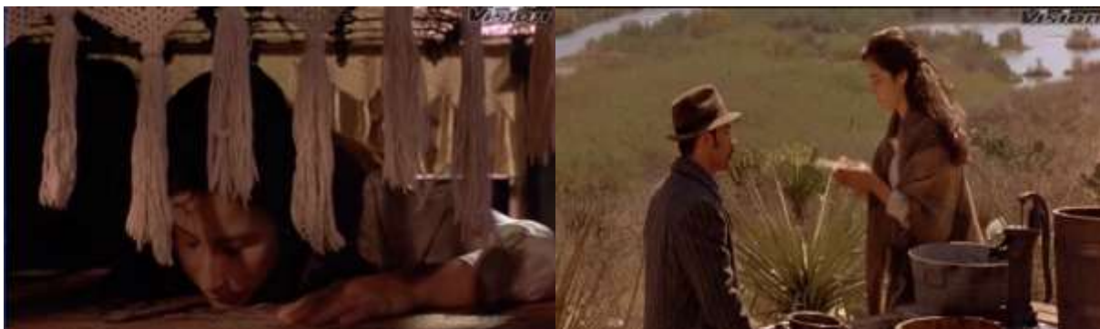
Fotograma 5. Nexos (Arau , 1992, 34')

fotograma 5 se observa las dos diferentes escenas, una en la cual Tita está acostada bajo la cama y el inicio de otra con Tita platicando con un trabajador.