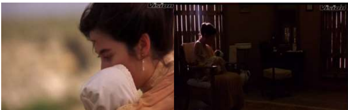
Fotograma 8. Nexos utilizados para la transición de secuencias (Arau, 1992, 39'50")

En los nexos para finalizar la escena simplemente se muestra a Tita caminando para dar paso al siguiente en el que se encuentra sentada en un cuarto oscuro mientras alimenta a su sobrino. (Fotograma 8.)