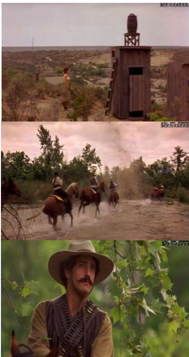
Fotograma 4. Planos generales, medios y cortos (Arau, 1992, 32'25")

La puesta en cuadro en esta secuencia prácticamente son todas planos generales en donde se muestra el entorno y todo lo que rodea al personaje. Se da relevancia al contexto. También se usan planos conjuntos para seguir viendo al sujeto principal pero el contenido cercano a él.