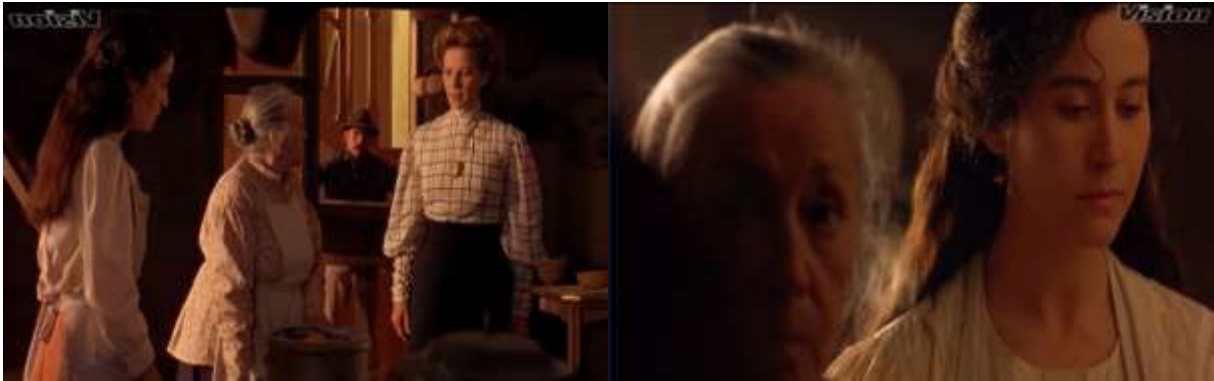
Fotograma 3. Medium Shot y Medium Close Up (Arau, 1992, 14'12")

Plano Medio Corto (Medium Close Up) En esta escena mostrada en el mismo fotograma parte inferior se busca ser más cercano al personaje de Tita y así identificar emocionalmente al espectador con ella. Su pecho, cara y cabeza quedan con el límite de la toma, para dar más detalle al momento. Es estable y natural pues no hay ningún movimiento en ella.