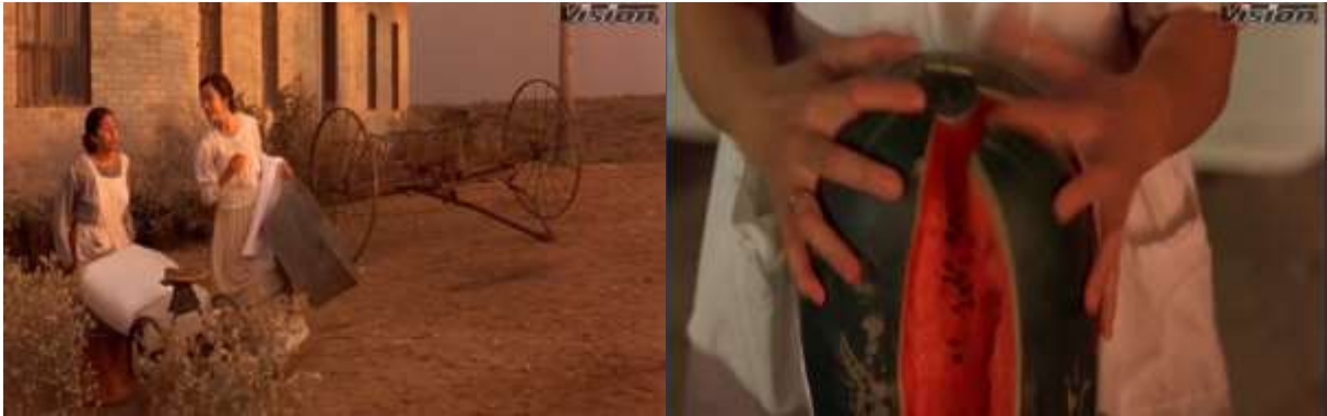
Fotograma 9. Plano detalle y Plano general (Arau, 1992, 41')

En esta secuencia para mostrar como Mamá Elena parte la sandía se utiliza el plano detalle ya que es importante que el espectador se dé cuenta de lo que está ocurriendo. Imagen superior fotograma 9.