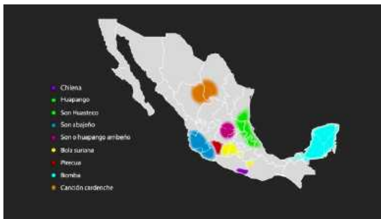
Fig. 1. Distribución regional de composiciones de la lírica popular mexicana

En el mapa se reconocen la chilena, típica de la región de la Costa Chica (estados de Guerrero y Oaxaca), el huapango o son de la Huasteca (estados de San Luis Potosí, Hidalgo, Puebla, Veracruz y Tamaulipas), el son y el huapango arribeños (estados de Nayarit, Jalisco y Michoacán), la bola suriana (estados de Michoacán, México y Oaxaca), la pirecua (estado de Michoacán), la bomba (estados de Yucatán, Quintana Roo y Campeche), y la canción cardenche (estados de Durango y Coahuila).