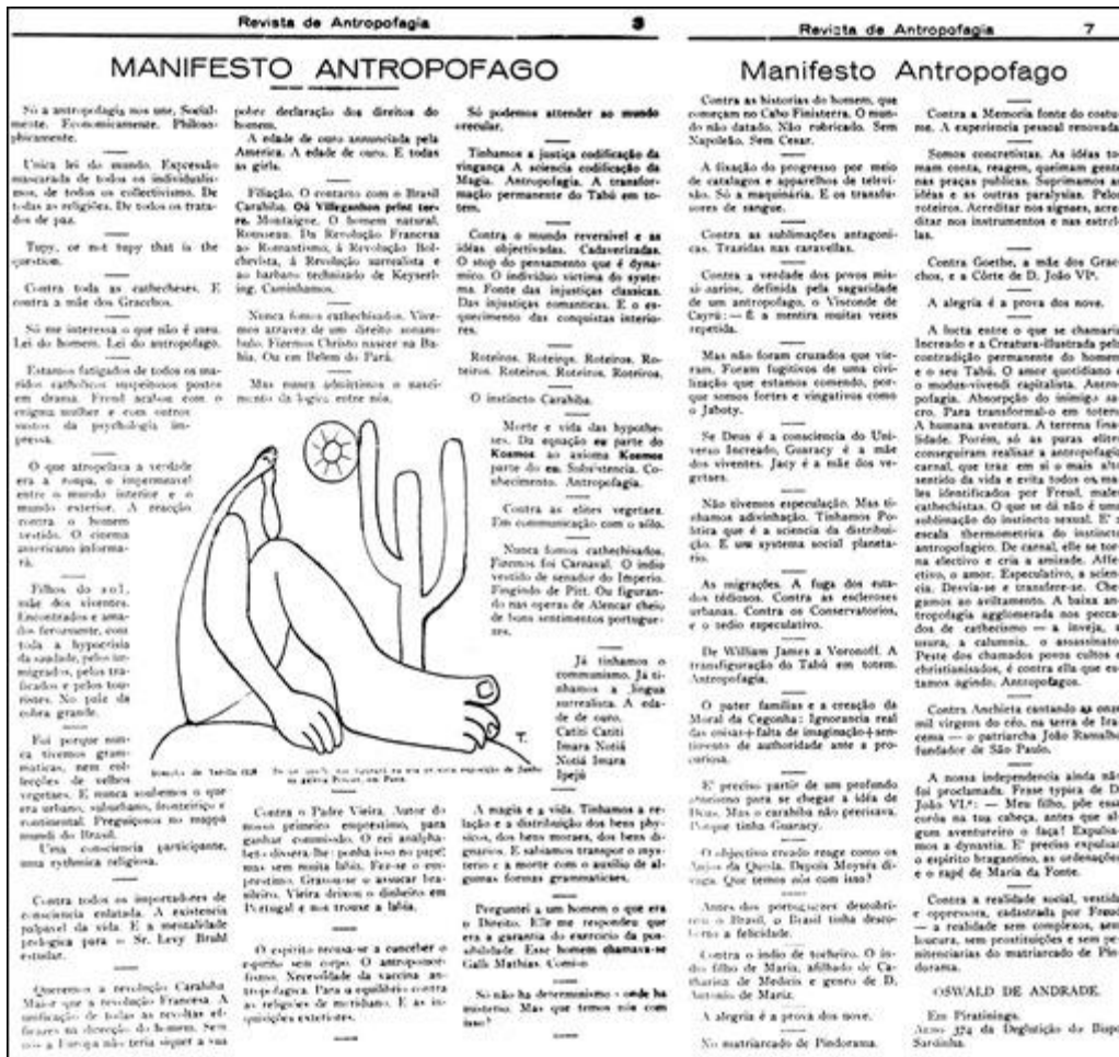
Figura 8. Oswald de Andrade. Manifesto Antropófago (facsimil) (1928).

Biblioteca Instituto de Estudos Brasileiros da USP. Imagen recuperada de: