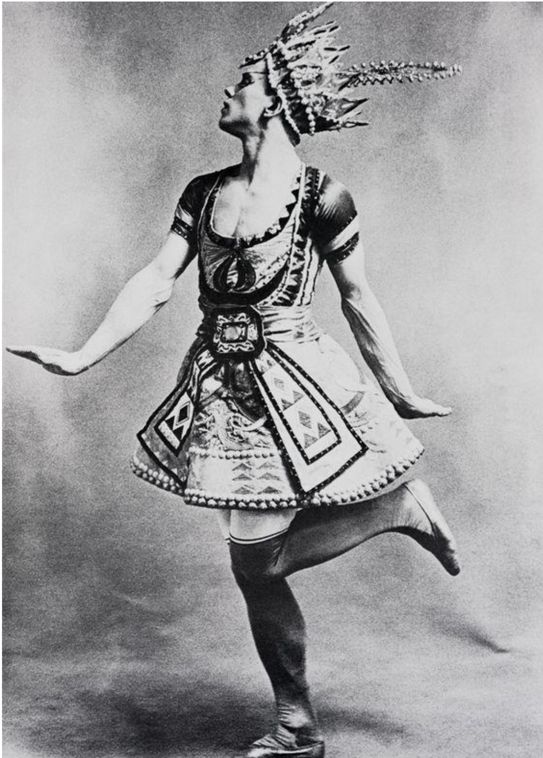
Figura 6. Waslaw Nijinsky, primer bailarín de los Ballets Russes -compañía central en la transformación de la danza y su escenificación-. Imagen recuperada de: In costume designed for the Ballets Russes production Le Dieu Bleu by Leon Bakst, c. 1912)