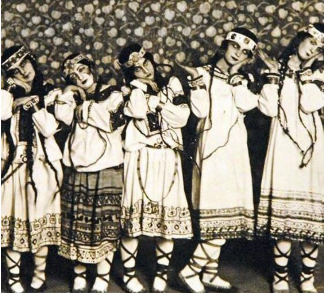
Figura 7. Nikolái Roerich: trajes para las adolescentes en el estreno de La consagración de la primavera , París, 1913.