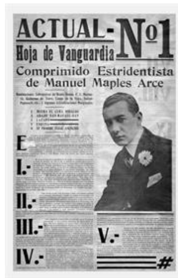
Figura 4. Manuel Maples Arce, Actual No.1: Hoja de Vanguardia. Comprimido Estridentista (1921) Museo Nacional de Arte, Ciudad de México.