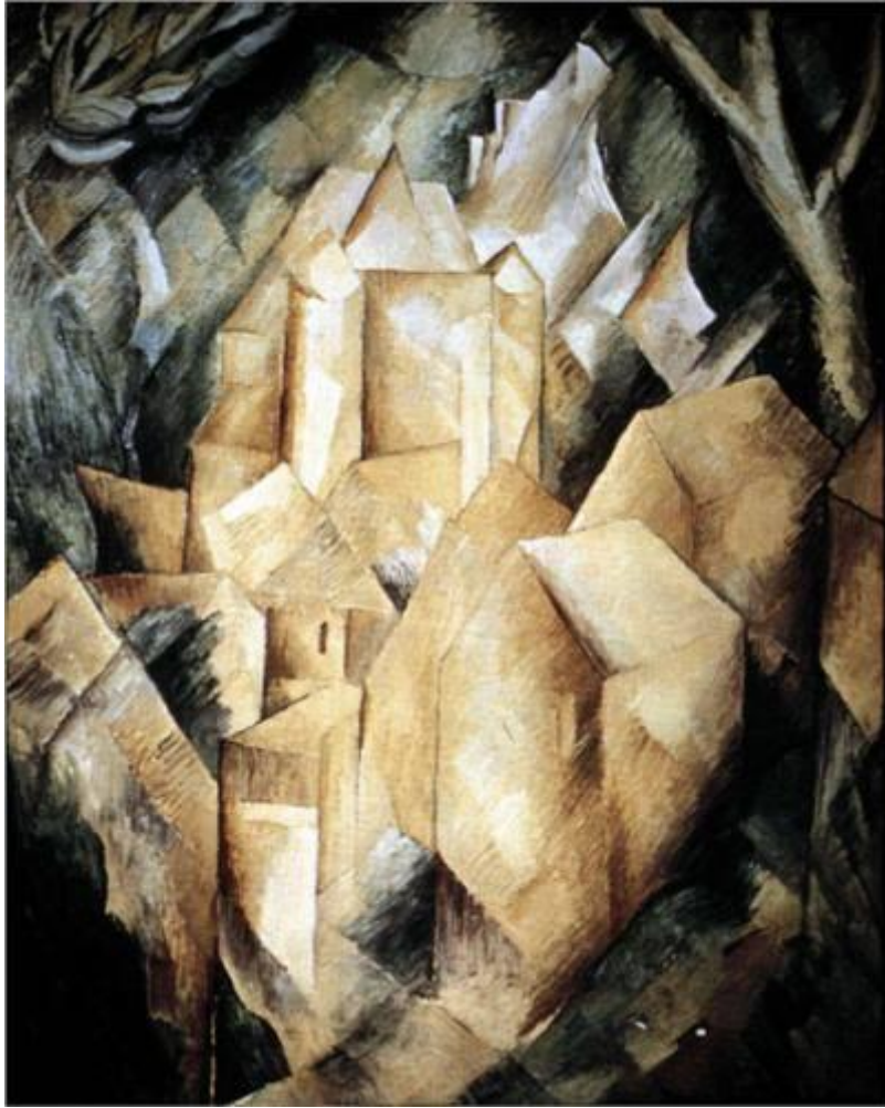
Figura 2. George Braque, Casas en L'Estaque (1908) Kunstmuseum, Berna