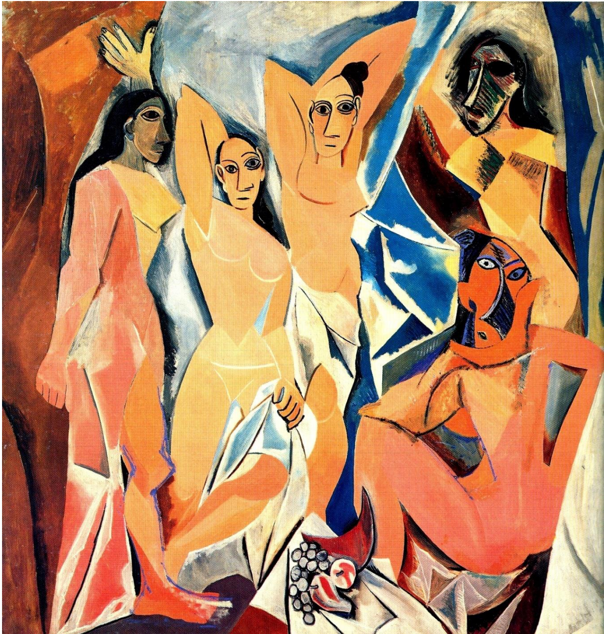
Figura 1. Pablo Picasso, Las señoritas de Aviñón (1907) Museo de Arte Moderno, Nueva York