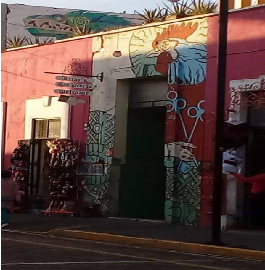
Foto3: Fachada frontal de la licorería San Pedrito, se observa el gallo como objeto icónico del lugar.

Otro de los elementos principales que distinguen a esta cadena de bares son sus objetos nocturnos, como las bebidas, las cuales se preparan con licores de aguardiente pero con diferentes sabores, lo que los convierte en un producto artesanal, la más emblemática del lugar es la grosellita, (Aguardiente y saborizante de grosella), el mezcal también es una bebida que está presente, se puede servir sola o con diferentes mezclas, en crema, con nieve de limón, pepino, entre otros, los refrescos con los que preparan las bebidas son producidos en la ciudad, y son difíciles de encontrar en otros sitios como la Lulú y el refresco Pascual, se vende comida tradicional mexicana pero renovada como las cemitas de chapulines, tacos de cochinita, entre otros. Por otro lado, la música que se