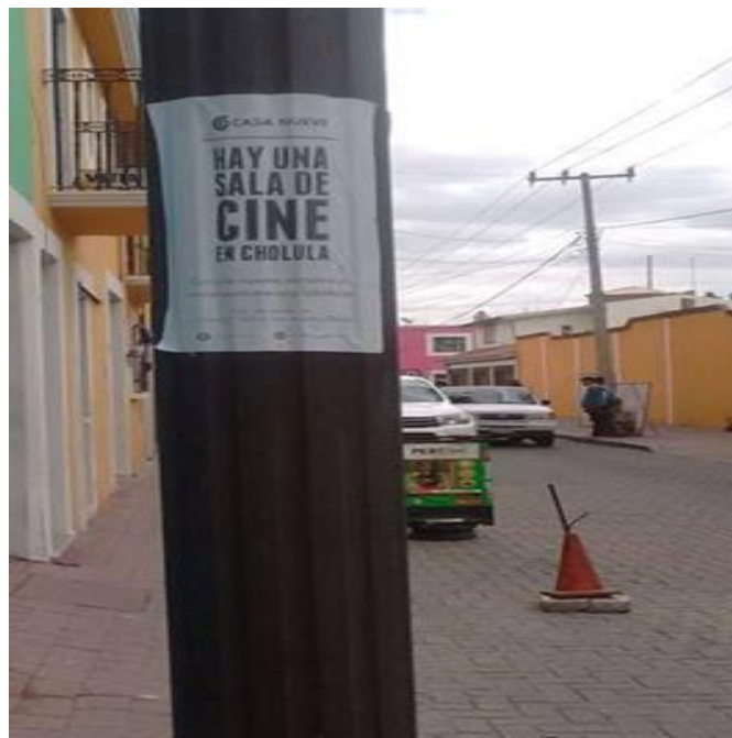
Foto4: Promocional de cine en Casa nueva

Este local nocturno ofrece un concepto, dónde los noctívagos no solo van a reunirse con sus amigos y tomar unos tragos, sino que también pueden consumir otros objetos como cine, arte, dentro de una zona nocturna, estas ofertas forman parte de la industria alternativa, debido a que ofrecen un lugar que vende el discurso de consumo consiente o cultural.