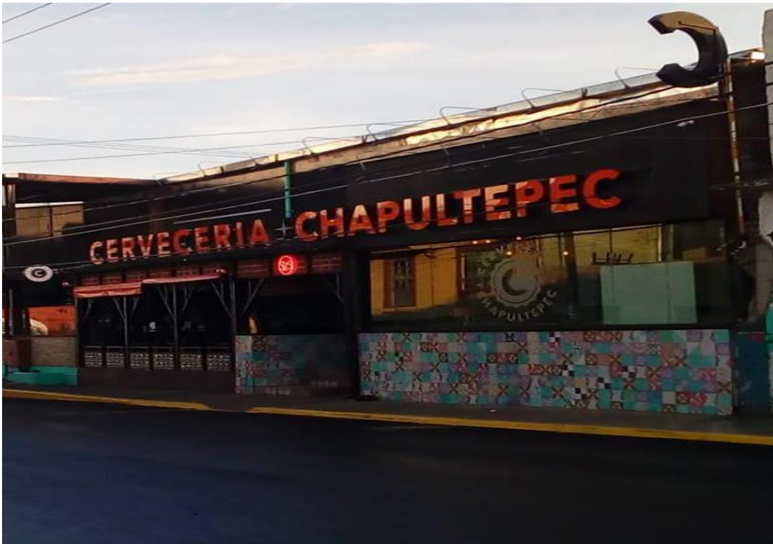
Foto2: Cervecería Chapultepec, fachada frontal.

Otro de los ejemplos que sirven para ilustrar este tipo de bares de cadena comercial, se encuentran aquellos que en su concepto o presentación destacan la especialización en bebidas y se hacen llamar por el nombre de aquella que distinga el lugar, como las cervecerías, licorería, mezcalerías, en cada uno de estos lugares, el objeto nocturno que más se consume es la bebida que se oferta, como franquicia suelen tener más de una sucursal, poseen el mismo diseño, la misma carta con oferta de bebidas, alimentos y a veces suelen tener actores con características similares no importando el escenario, debido a que en estos lugares la industria de consumo alternativo es más explícita, especialmente en los discursos de las bebidas.