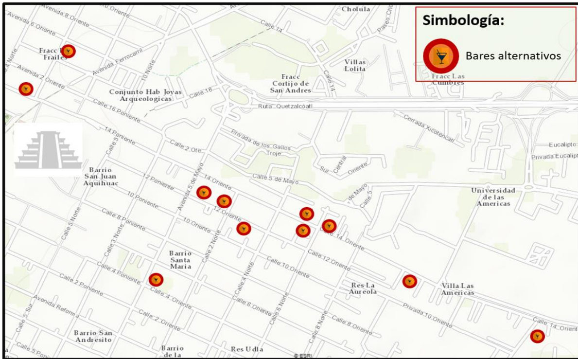
Mapa2: Ubicación de los bares más importantes para la escena alternativa.

Tal es el caso del bar Mc Carthy's, una franquicia de local nocturno poblana, con presencia en distintas zonas de la ciudad de Puebla aproximadamente 6 establecimientos, y un total de 56 sucursales en diferentes ciudades del país (contando los de la ciudad y el Estado de Puebla). Estas cadenas comerciales de la industria de la diversión nocturna, tienen un conocimiento estratégico de las zonas nocturnas dónde deben ubicarse y hacia qué sectores irán dirigidos, en la ciudad de Puebla se encuentran en las más importantes la avenida Juárez, Sonata y Cholula, tal como lo refería el gerente de de la sucursal más importantes en Puebla, la de la Juárez, en una entrevista dirigida a la revista Subterráneos: "Buscamos plazas, donde podamos establecer nuestro concepto de rock , porque generalmente todos llevamos un rockero dentro". (López, 2014)