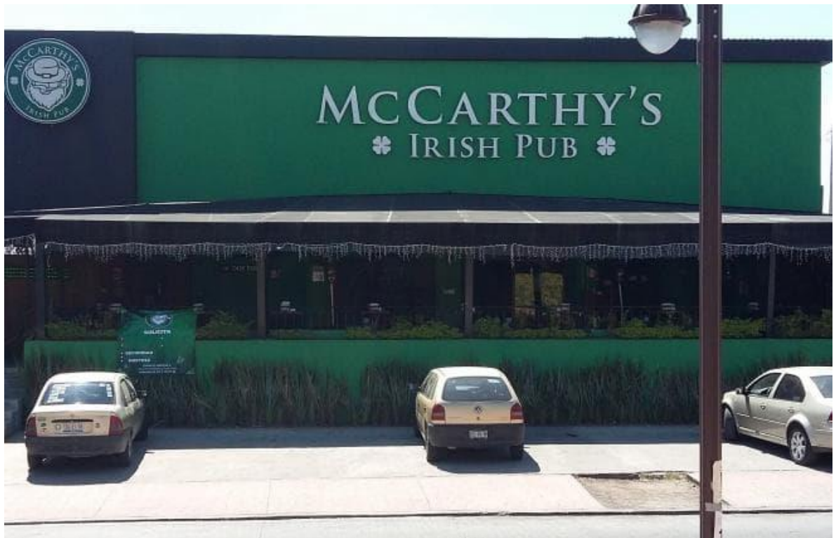
Foto1: McCarthy's.

Este bar-franquicia se caracteriza por presentarse bajo el concepto de Irish Pub o Pub irlandés, por tanto, en su decorado resaltan los colores representativos de este país, el verde; símbolos que hacen referencia a esta cultura como los duendes, los tréboles; también celebran las festividades tradicionales el día de San Patricio cada 8 de marzo. Por otro lado, los meseros utilizan un vestuario que hace referencia a la cultura de este país, la falda de los gaiteros (verde, tableada y a cuadros), originalmente, se reconoce la imagen de un hombre vistiéndola y tocando la gaita, pero en el bar-pub, la falda es utilizada por los meseros tanto, hombre, como mujeres, este concepto según el marketing que lo promociona revaloriza la cultura irlandesa en el contexto mexicano.