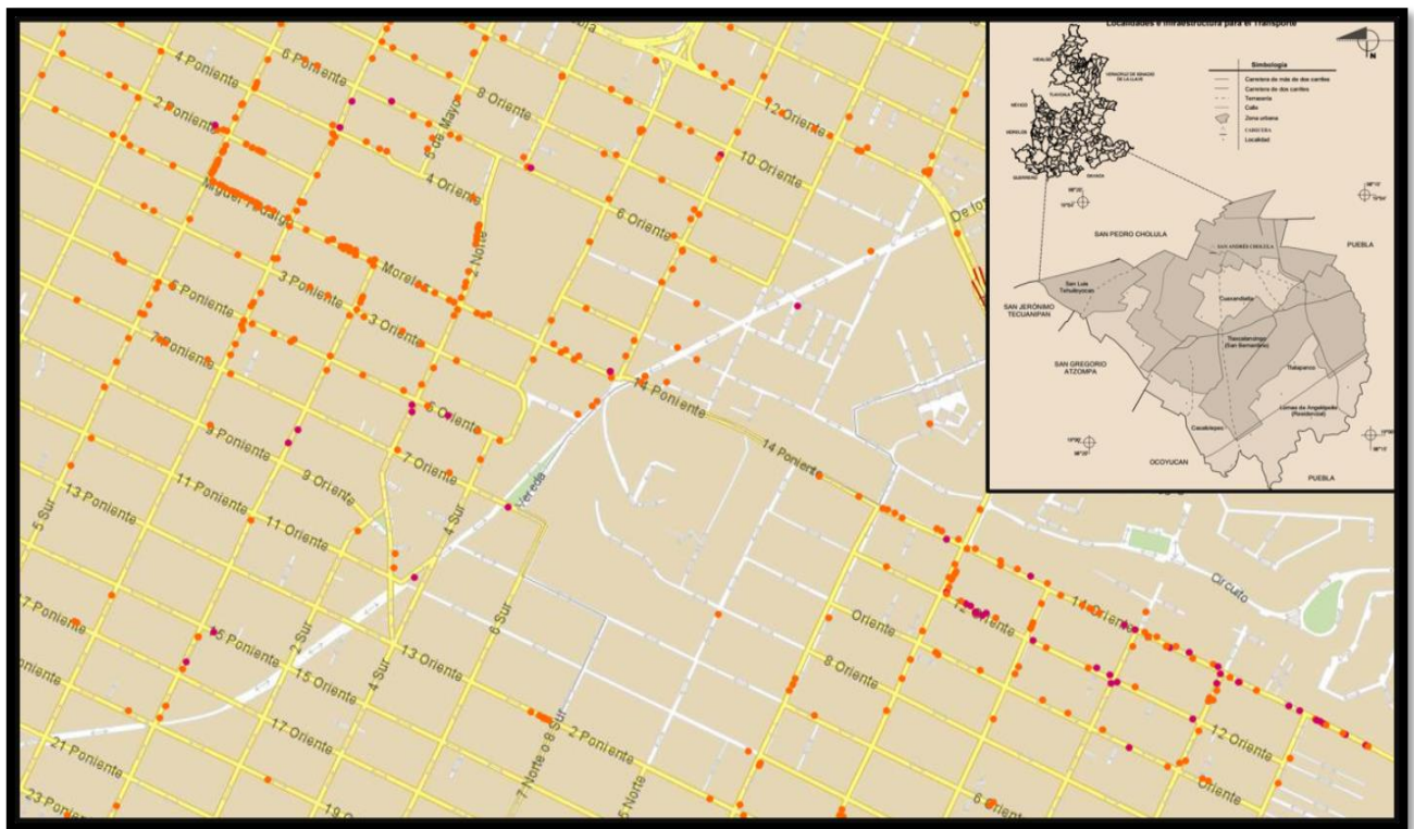
Mapa1. Ubicación de Cholula y de establecimientos con giro comercial de restaurantes y bares en San Pedro y San Andrés Cholula.

interés, en la primera localidad se ubica a los alrededores de la pirámide, y en la segunda, se expande hasta el zócalo. Esta zona nocturna se conforma por una diversidad de restaurantes, bares, distintos giros comerciales, que están estrechamente relacionados con los consumos de los habitantes foráneos en esta localidad.