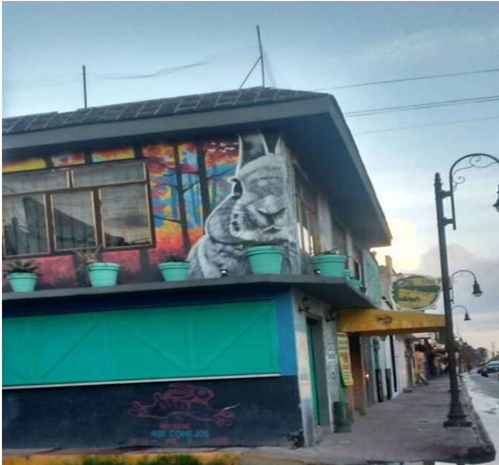
Foto7 Mezcalería 400 conejo. En la foto se muestra el diseño de la fachada frontal de una mezcalería alternativa, se utiliza arte urbano para su decoración con elementos referentes a la naturaleza y la cultura prehispánica

De igual manera, el pulque es otra bebida importante para la escena alternativa, se ha resignificado, su uso social hasta hace unas décadas se relacionaba con la clase popular, lo consumían los adultos, pero actualmente, el pulque se bebe en zonas nocturnas, en especial, donde se encuentran escenas sociales de noctívagos de consumo alternativo o de estudiantes, por lo general los nombres de los lugares en el escenario de nocturnidad hacen alusión al objeto, por ejemplo: El sagrado pulque, La pulkata, El pulke para 2, y en otros lugares que se ofertan por lo general son de la escena alternativa y tienen nombres relacionados con lo