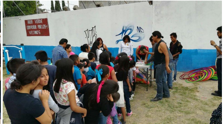
Figura 12: El colectivo Recréate Loma Linda convocó a los vecinos con motivo del Día del Niño. [Fuente: Recréate Loma Linda].

El evento de “Leyendas Comunitarias”, celebrado con razón del día de muertos, se realizó en el Solar Loma Linda. En aquel evento hubo concursos de disfraces (ver figura 18), una representación teatral (ver figuras 13 y 15), otra de danza (ver figura 14), espectáculo de malabares y finalizó con un cuentacuentos de leyendas de terror. Para la realización de este evento se adecuó previamente el Solar Recréate Loma Linda con mobiliario y equipos de sonido que nos fueron proporcionados por la “Fundación Learny”, organización colaboradora en esta ocasión. Se dispuso de una carpa para realizar el evento bajo ella, y se montó conjuntamente un altar de muertos con neumáticos y elementos que distintos vecinos trajeron para la ocasión (Ver figuras 16-17).