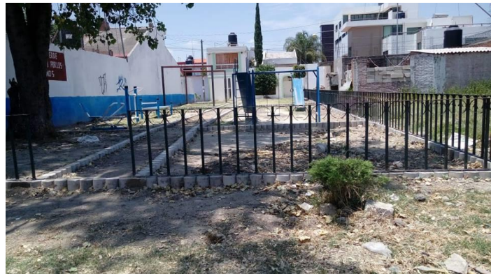
Figuras 22 y 23: Proceso de obras de adecuación del área verde vecinal. El nuevo Parque de los Pericos.