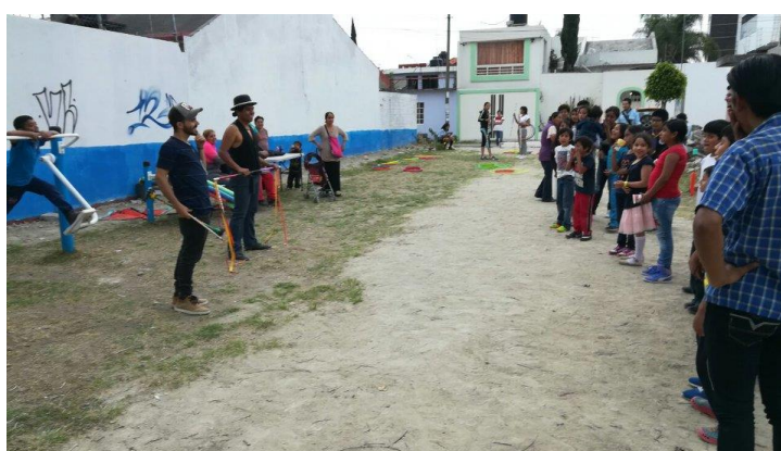
Figura 10: Se realizó un espectáculo de malabarismos ante el público asistente al evento. [Fuente: Recréate Loma Linda].