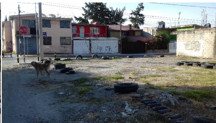
Figura 8: El predio fue despejado de maleza y escombros por el equipo de Recréate Loma Linda, y se adecúa ad hoc para cada evento. [Elaboración propia].