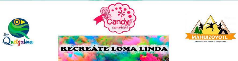
Figuras 20 y 21: Empresas locales que participaron en la reactivación de espacios públicos a través del patrocinio hacia el colectivo Recréate Loma Linda. Los patrocinadores fueron incluidos en los carteles de difusión de los eventos. Ejemplo del cartel empleado para el evento del Día del Niño.