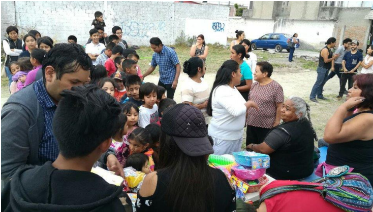
Figura 11: Los niños asistentes pudieron recibir un regalo gracias al apoyo de los patrocinadores que siguieron el evento. [Fuente: Recréate Loma Linda].

Finalizando el evento, y gracias al apoyo de los patrocinadores con los que se había negociado previamente a la realización del mismo, pudo haber una entrega de regalos para todos los niños participantes.