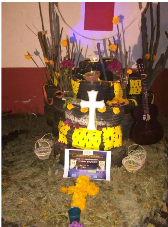
Figuras 16 y 17: Desde el colectivo Recréate Loma Linda organizamos, para el evento “Leyendas Comunitarias”, la construcción colectiva de un altar de muertos público en la colonia. Cada quién trajo lo que quiso para poner en el altar. [Elaboración propia].