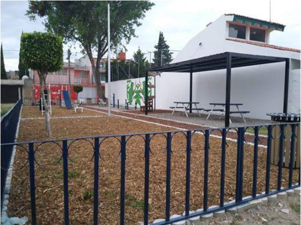
Figura 24: Estado del nuevo Parque de los Pericos tras las obras de remodelación.