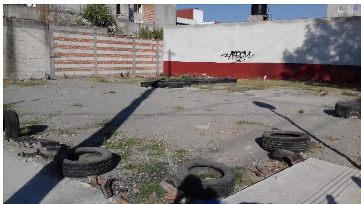
Figura 7: En el Solar Recréate Loma Linda se llevaron a cabo algunas de las actividades de reactivación de espacios públicos en la colonia.

Tras la última transformación acaecida en el área verde vecinal, el Solar Recréate Loma Linda está volviendo a ser usado para la realización de los eventos propuestos desde el colectivo; se ha mantenido gracias a estas actividades eventuales en mejor estado de limpieza, se ha reducido la percepción de inseguridad en el entorno y ha comenzado a consolidarse en la colonia como un espacio de reunión colectiva con ocasión de eventos o fechas especiales.