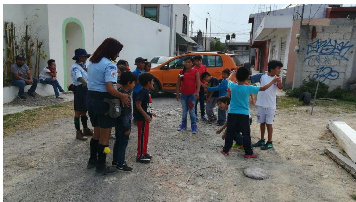
Figura 9: El grupo de scouts de la colonia nos apoyó en la organización y preparación del evento del Día del Niño. [Fuente: Recréate Loma Linda].

Esta ocupación lúdica del espacio público la realizamos desde el colectivo Recréate Loma Linda, vinculando además a otros colectivos con vocaciones afines. Así, por ejemplo, para el evento del Día del Niño, realizado en el área verde vecinal (anteriormente a las obras de su adecuación definitiva) el día 28 de abril del 2018, coadyuvaron sobre el área verde vecinal distintas puestas en escena de carácter lúdico y con la participación de todos los asistentes (ver figuras 9-12). Desde Recréate Loma Linda planteamos espectáculos de malabarismo, y posteriormente se enseñó a los niños y niñas interesados a realizar los juegos malabares, con pelotas, palos chinos y bastones. También se organizaron para los niños múltiples juegos; el material para éstos fue dispuesto en distintas zonas del área verde. El grupo de Scouts de la colonia acudió también para apoyarnos en la organización de los juegos, y nos enseñaron canciones que incidieron en fortalecer los lazos de identidad que unen a sus vecinos con la colonia, cantos entre los cuales los scouts nos pedían que gritáramos: “¿Cuál es nuestra colonia? ¡Loma Linda!”.