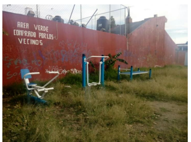
Figuras 1-6: Estado de degradación en que se encontraba el predio del área verde vecinal al iniciarse el proceso de investigación-acción participativa que tuvo como fin reactivarlo. [Elaboración propia].