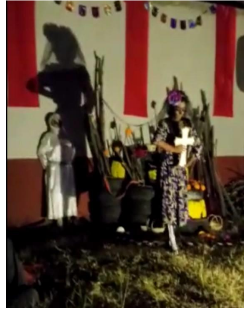
Figuras 13, 14 y 15: Representación de espectáculos artísticos con motivo de día de muertos durante el evento “Leyendas Comunitarias” en el Solar Loma Linda. El lugar fue adecuado para la ocasión en el marco de la reactivación de espacios públicos en la colonia. [Elaboración propia]