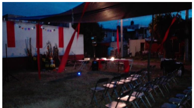
Figuras 18 y 19: Concurso infantil de disfraces y adecuación del Solar Loma Linda previo a la realización del evento “Leyendas Comunitarias”.