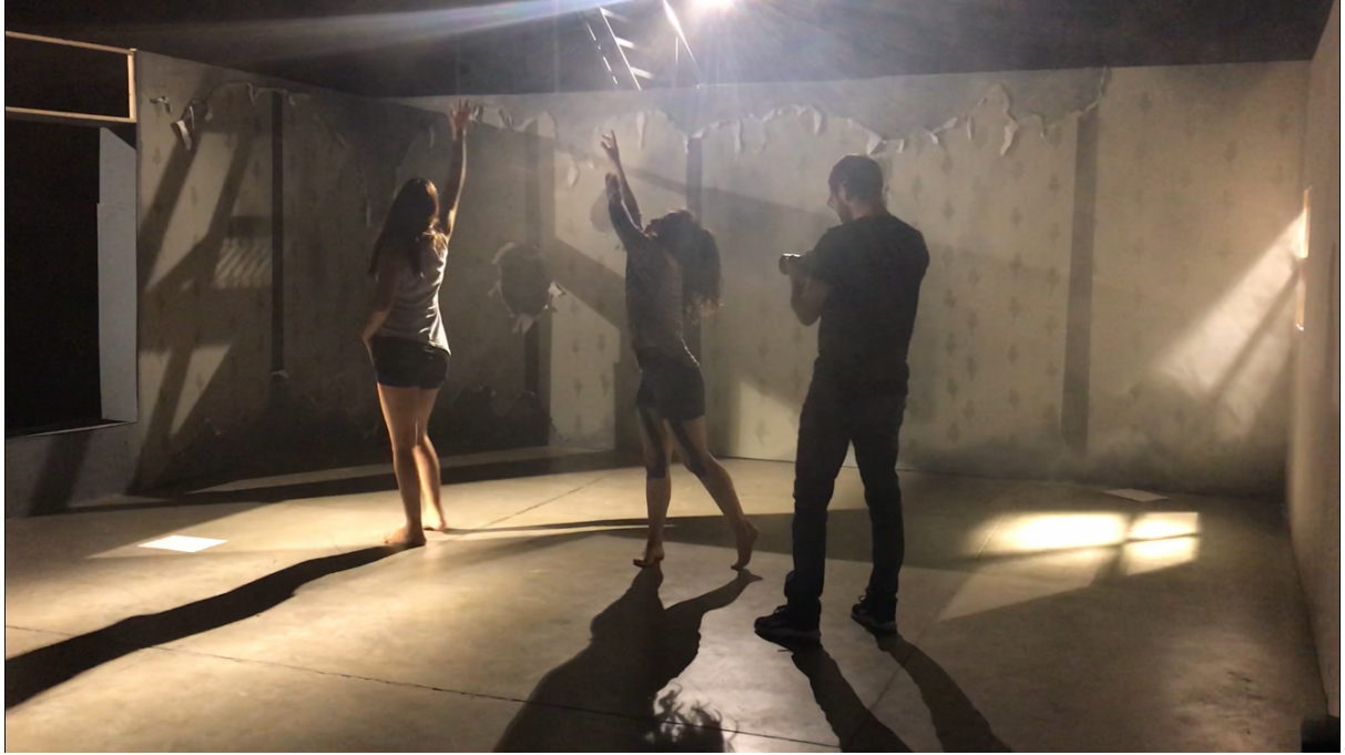
Ilustración 13, 14 y 15. Construcción Y Montaje De La Obra.