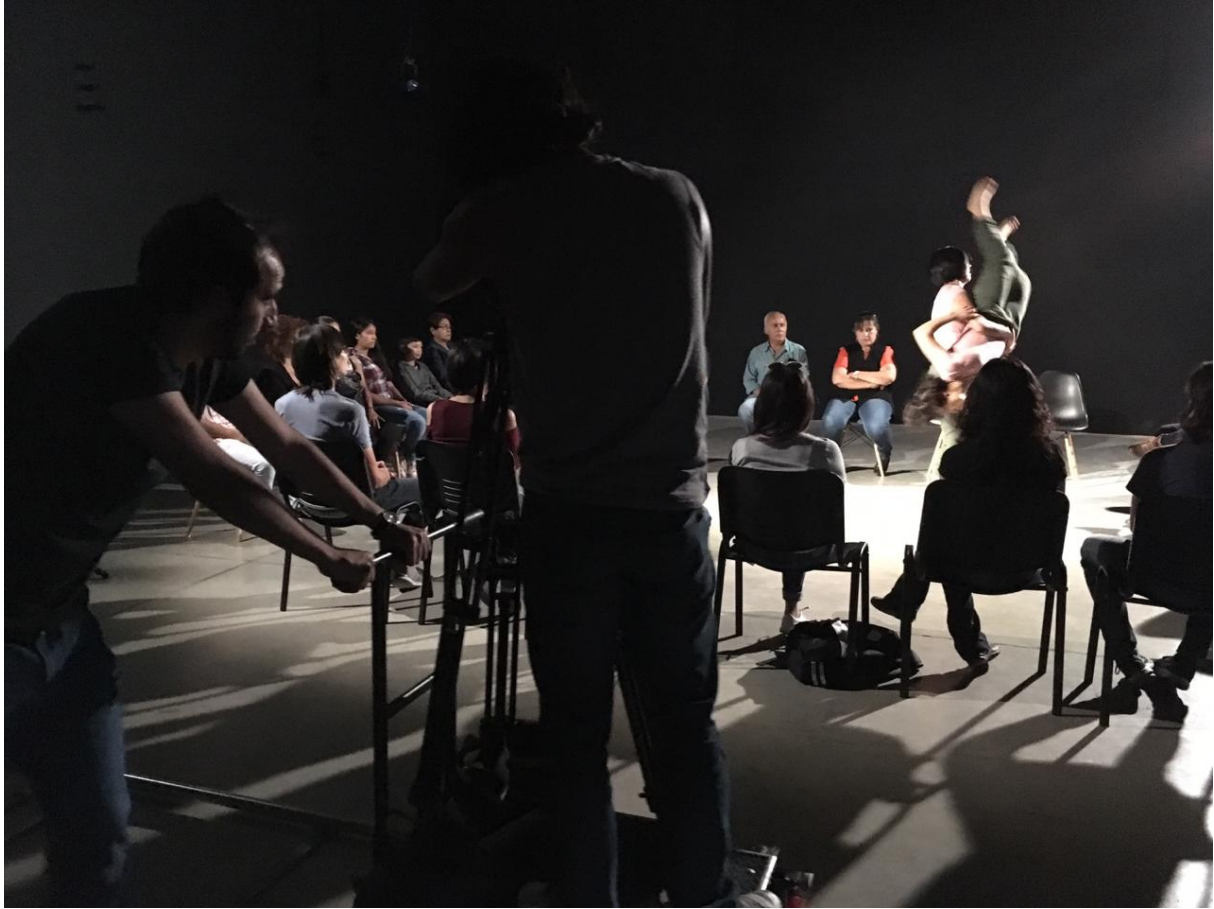
Ilustración 16, 17, 18 y 19. Puesta En Escena.