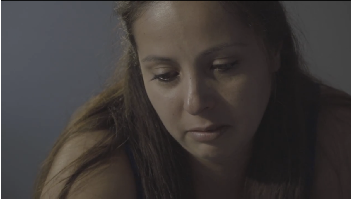
Ilustración 4, 5 y 6. Vincularse Con El Mapa.