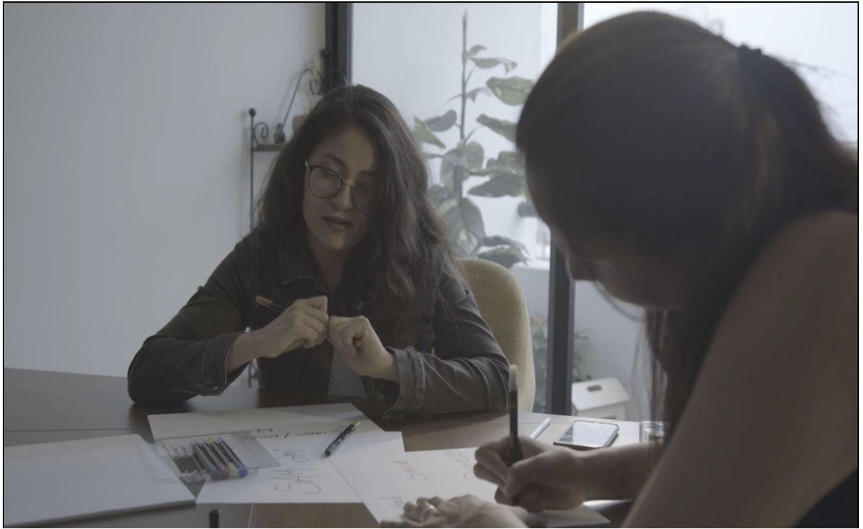
Ilustración 3. Pensamiento Colectivo