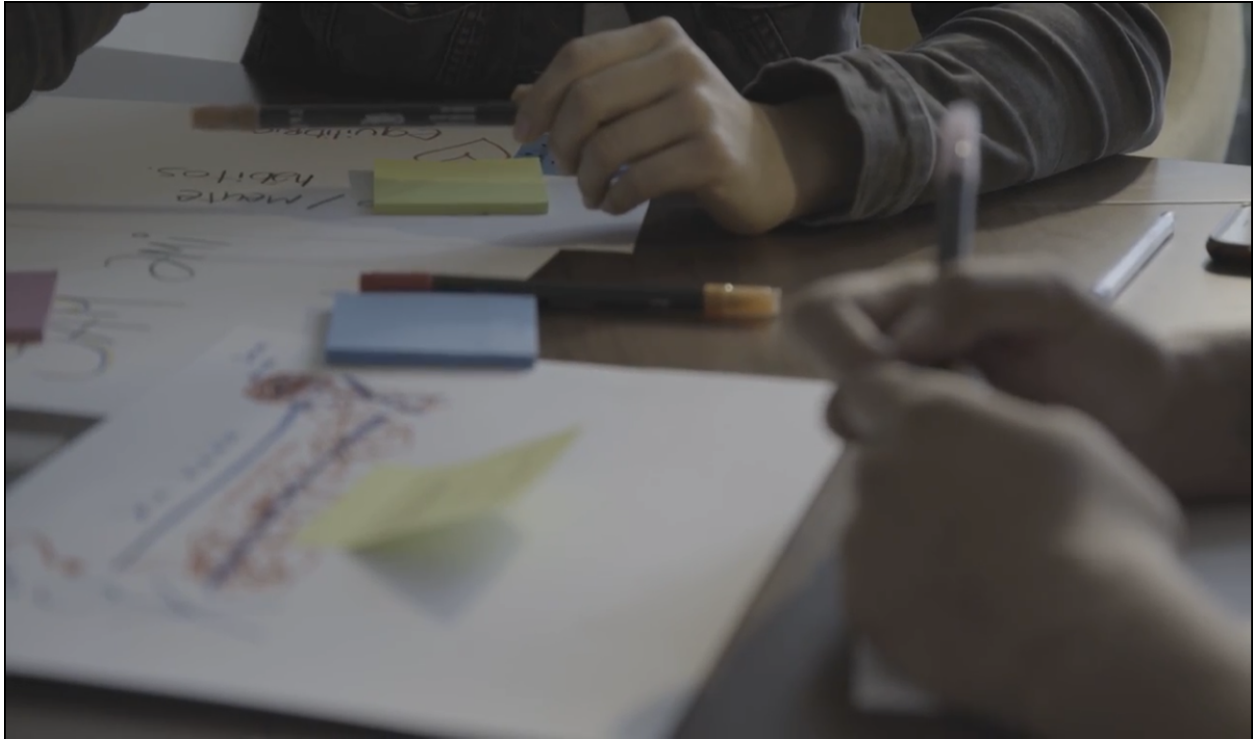
Ilustración 2. Mapa Creativo De Modelo Rizomático.