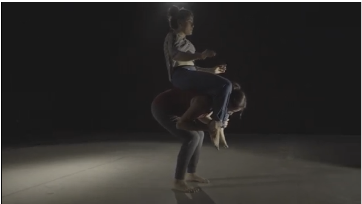
Ilustración 10, 11 y 12. Exploración Enfocada.