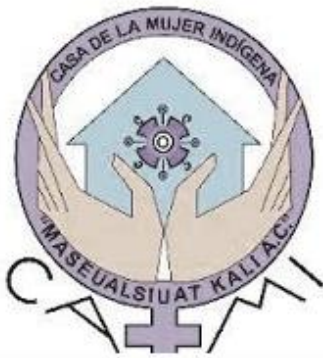
Ilustración 3 CAMI

La visibilidad de Maseual Siuamej Mosenyolchicauani se debe a quienes defienden los territorios que las féminas indígenas y las mestizas de la Sierra Norte contribuyen al cuerpo-territorio con un propósito para proteger la biodiversidad, impulsar la soberanía y seguridad alimentarias y ejercer nuestros derechos comunitarios, además de recuperar la medicina tradicional y la sabiduría ancestral.