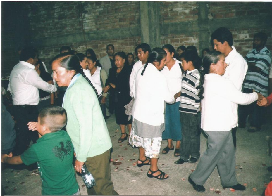
TÍTULO Los pequeño toman parte del ceremonial AUTOR María Luisa Susana Santamaría López FECHA 14 de julio de 2011