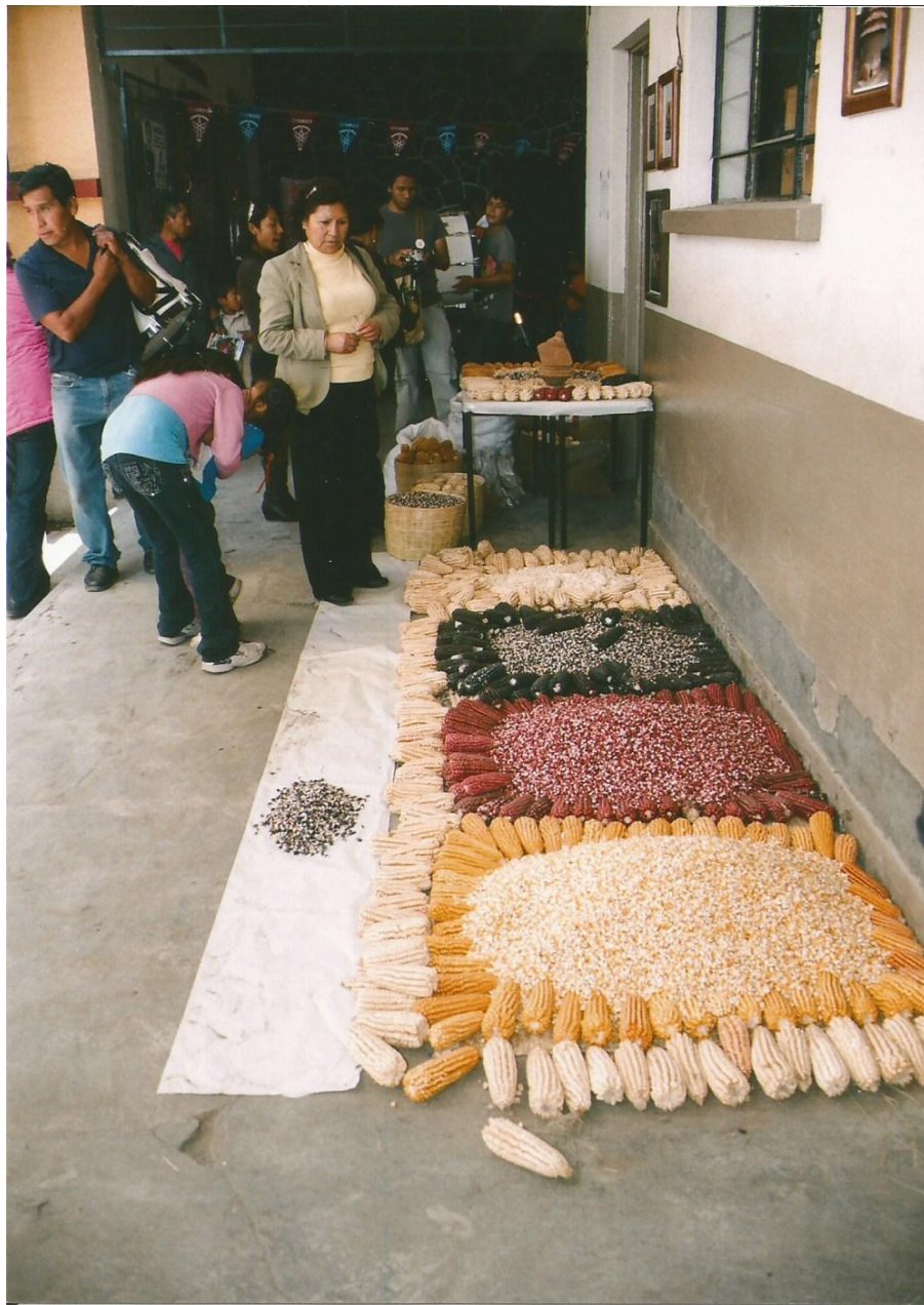
TÍTULO Aun no es transgénico AUTOR María Luisa Susana Santamaría López FECHA 14 de julio de 2011