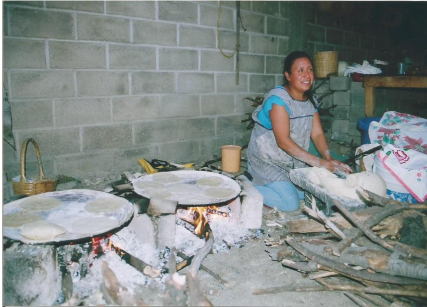
TÍTULO Tortillas calentitas de maíz de la localidad AUTOR María Luisa Susana Santamaría López FECHA 20 de Julio de 2011