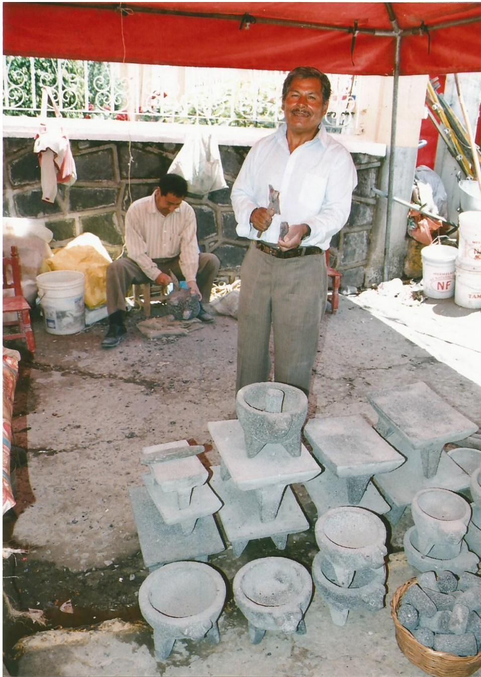
TÍTULO Artisanos transformando la cantera. AUTOR María Luisa Susana Santamaría López FECHA 20 de Julio de 2014