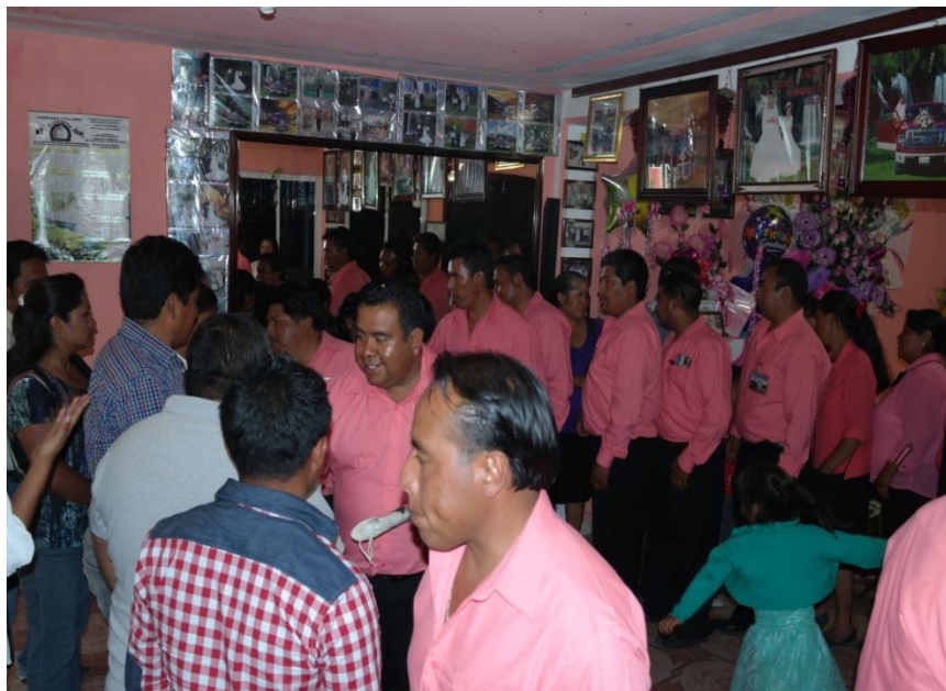
TÍTULO Saludo cordial fiscal mayor de frente, de espalda el Presidente Municipal. AUTOR María Luisa Susana Santamaría López. FECHA 14 de Julio de 2014