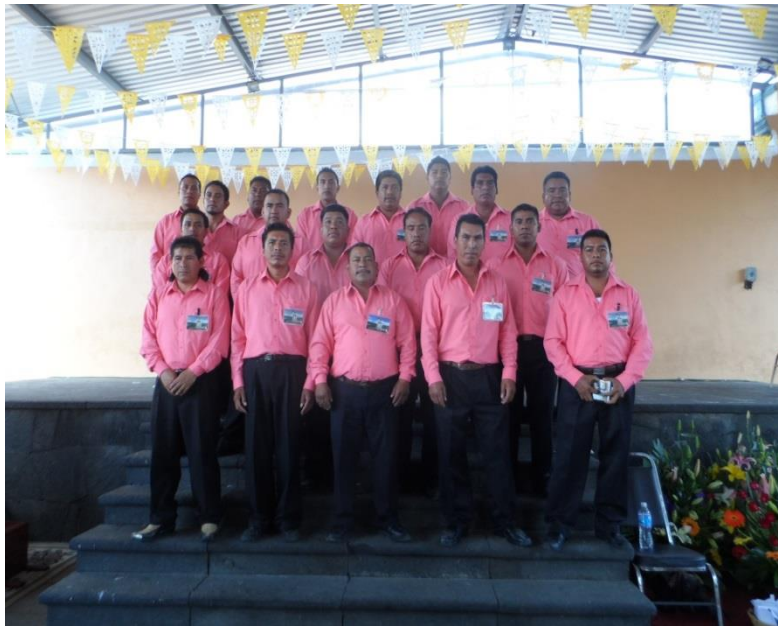
TÍTULO Los fiscales Julio 14 de 2014