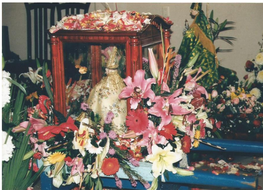
TÍTULO Esculturas de la misma Imagen AUTOR María Luisa Susana Santamaría López FECHA 14 de Julio de 2014