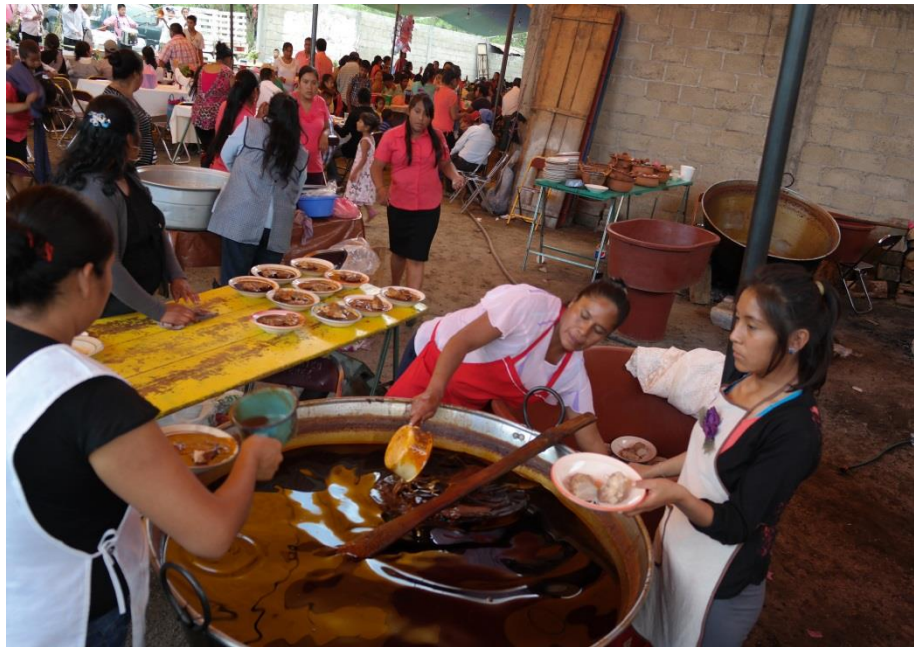
TÍTULO Las cocineras sirviendo mole poblano. AUTOR María Luisa Susana Santamaría López FECHA 20 de Julio de 2014