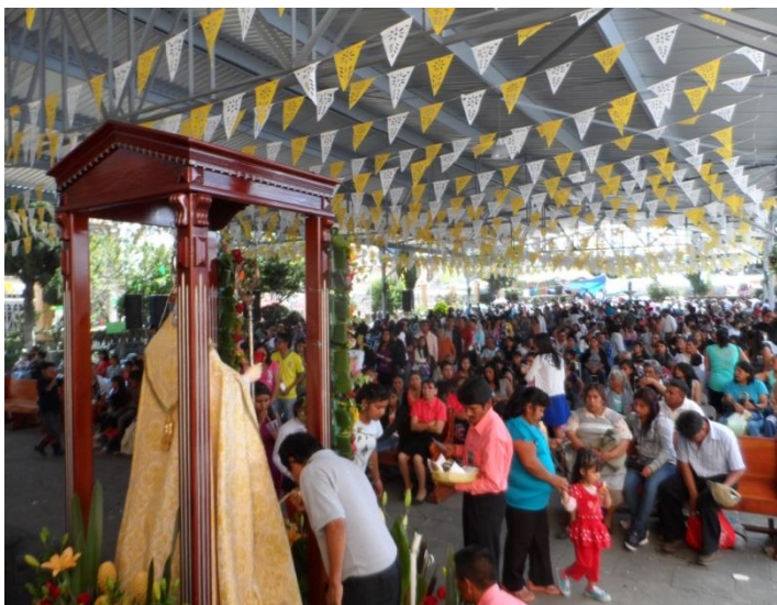
TÍTULO Las personas esperando el inicio de la eucaristía FECHA 14 de Julio 2014