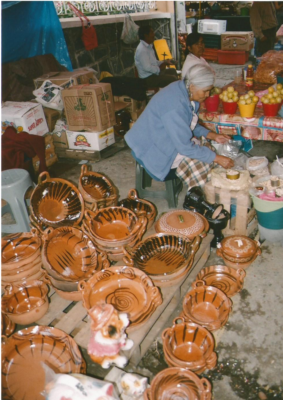
TÍTULO Utensilios de barro y productos del campo AUTOR María Luisa Susana Santamaría López FECHA 20 de Julio de 2011