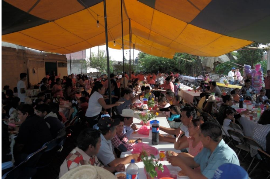
TÍTULO Aistentes a la comida en la casa del fiscal mayor. AUTOR María Luisa Susana Santamaría López. FECHA 20 de Julio de 2014.