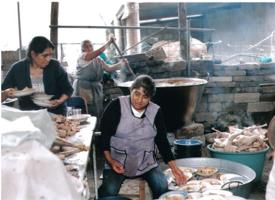
TÍTULO Preparando platos para los asistentes AUTOR María Luisa Susana Santamaría López. FECHA 14 de julio 2011