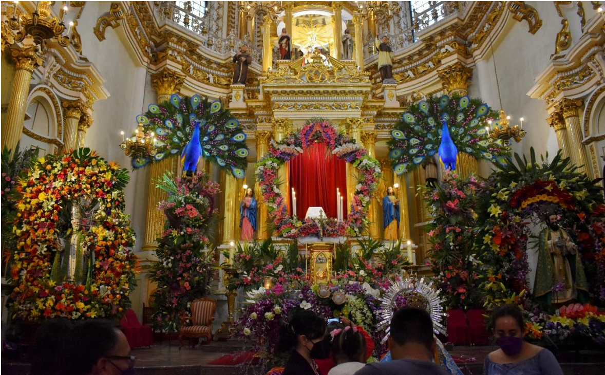
Figura 3. Exconvento en fiesta de los floricultores.

Fotografía de: Fabian Toxqui Rodriguez 13 de junio de 2022.