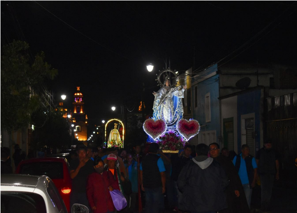
Figura 7. Procesión de los faroles

31 de agosto de 2022. En la imagen se puede ver a los feligreses cargando a la Virgen del barrio de Santa María Xixitla, atrás a San Pablo Tecama y al fondo la parroquia de San Pedro Cholula.