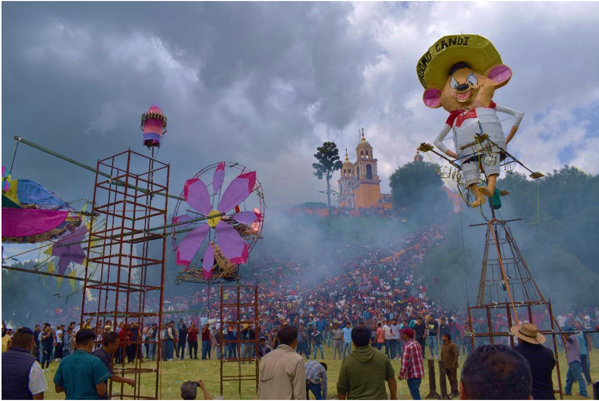
Figura 10. La quema de los panzones

8 de septiembre de 2023.