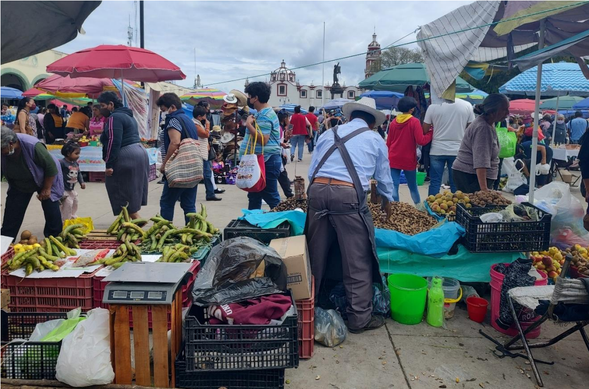
Figura 12. Comerciante de la región

Fotografía de: Fabian Toxqui Rodriguez 8 de septiembre de 2022.