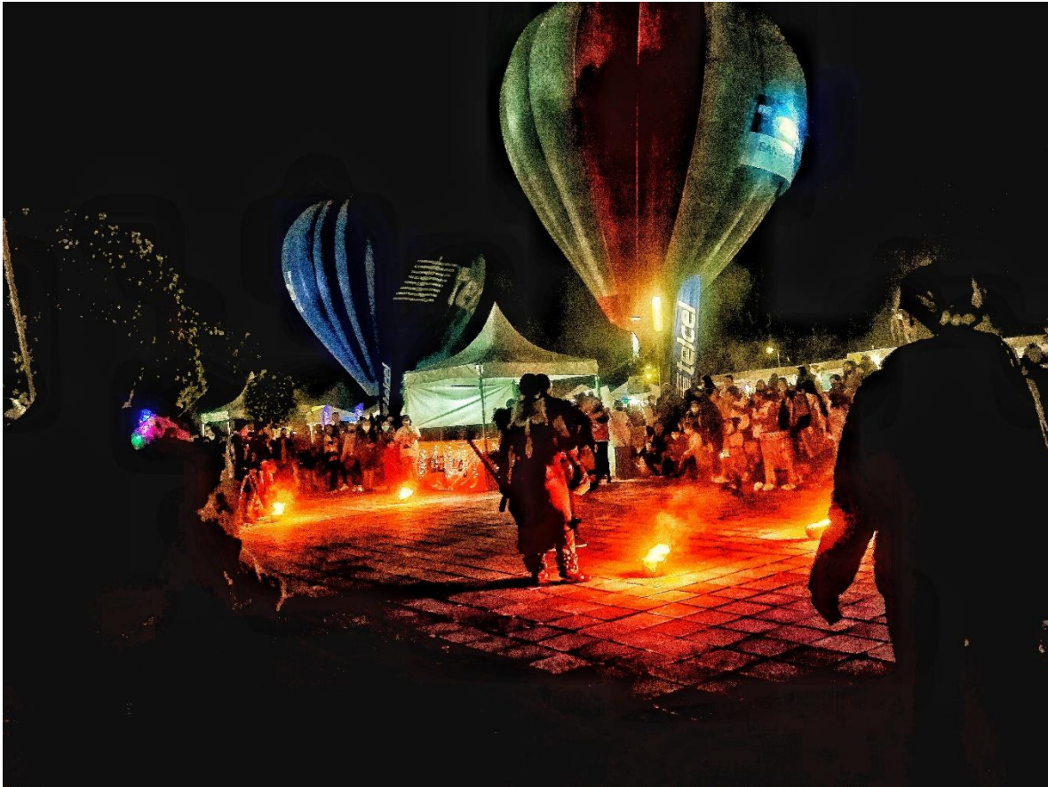
Figura 18. Consumo del símbolo prehispánico

Fotografía de Fabián Toxqui Rodríguez en diciembre de 2021. Es una fotografía del hockey sobre césped que se organizó en el parque intermunicipal, sin embargo, este evento no se repitió al año siguiente. Las actividades que se realizan en el espacio simbólico de Cholula pueden variar año con año e incluso las fechas, lo que se mantiene son los símbolos dominantes a partir de los cuales se fundamenta el consumo cultural.