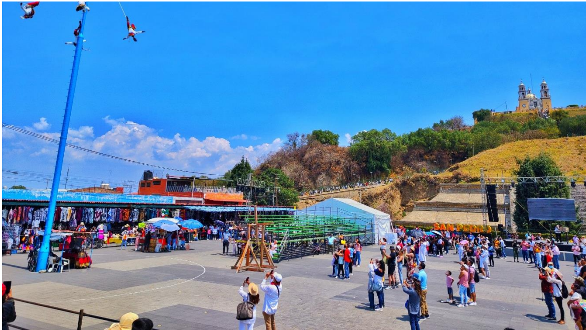
Figura 20. Los voladores en Cholula

Fotografía de Fabián Toxqui Rodríguez en marzo de 2022. Se muestra una parte del parque Soria con los asistentes vestidos de blanco. Del otro lado se encontraban los chamanes que realizaban servicios de limpias y purificación