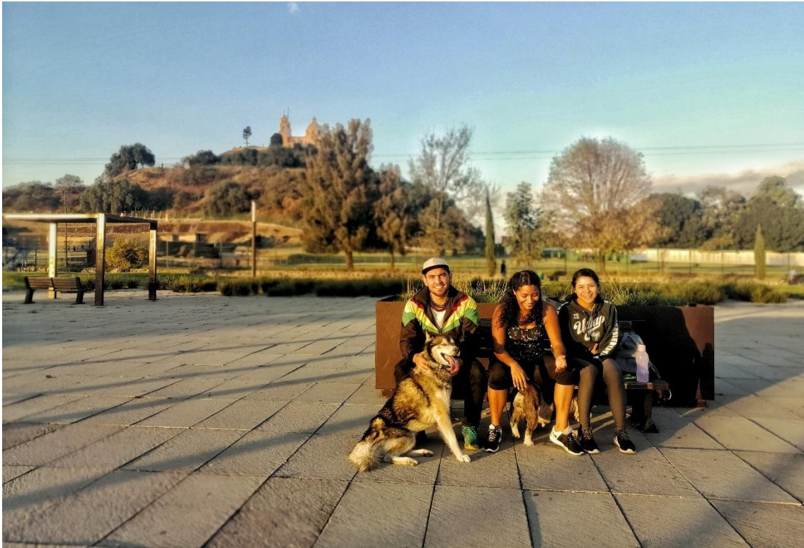
Figura 8. Los nuevos residentes de Cholula

Fotografía de: Fabian Toxqui Rodriguez abril de 2022.