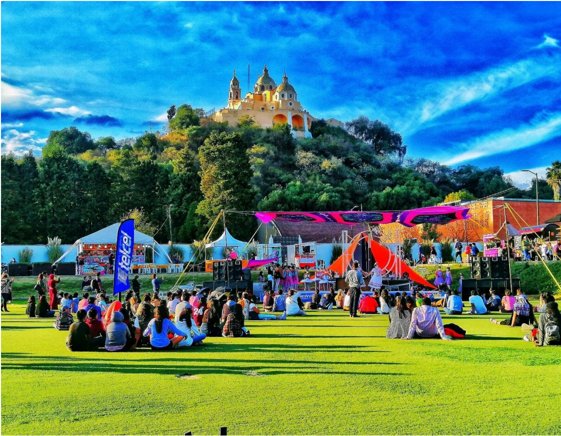
Figura 23. Festival del equinoccio en San Andrés Cholula

Fotografía de Fabián Toxqui Rodríguez en marzo de 2022. La fotografía se trata del parque intermunicipal, en donde la administración de San Andrés Cholula constantemente realiza eventos artísticos, ferias o festivales para promover el turismo y la derrama económica.