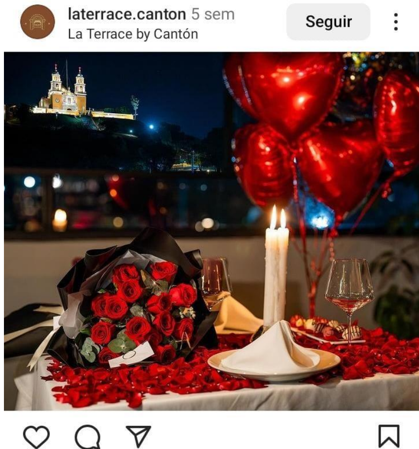
Figura 2. Cita en Cholula