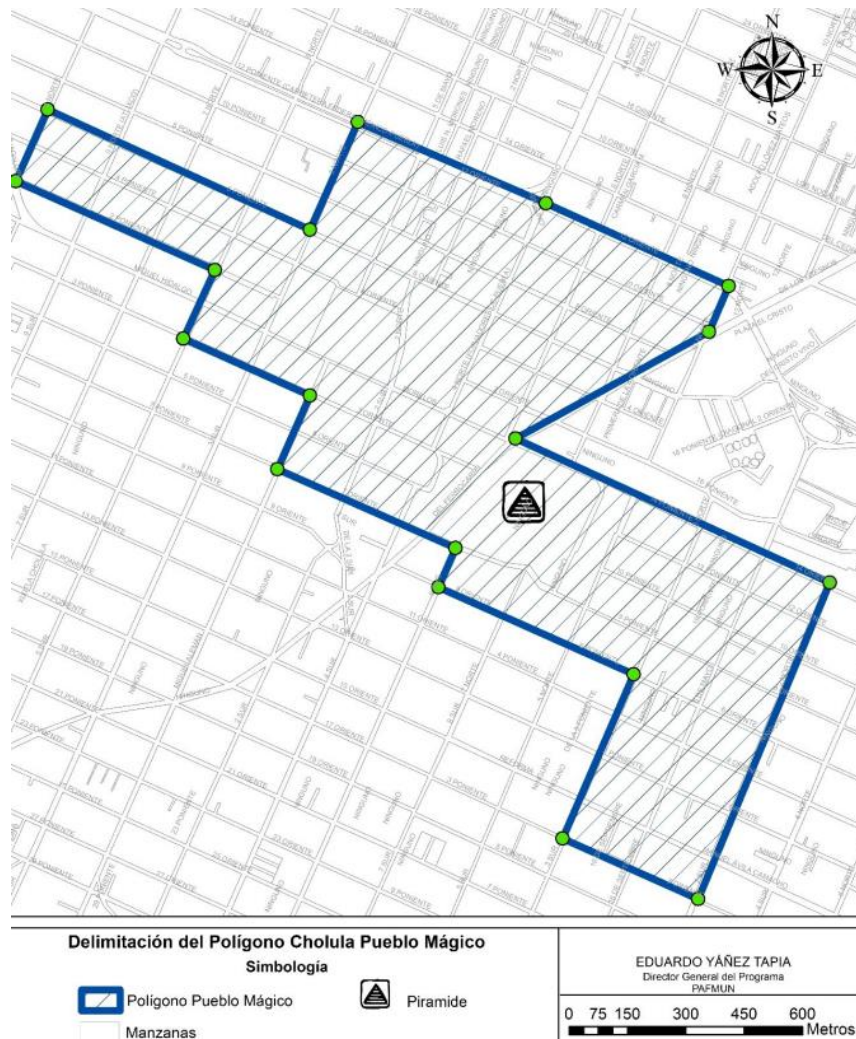
Figura 9. Polígono del Pueblo Mágico de Cholula 14

Otro proyecto que altero significativamente el espacio cholulteca y las practicas sociales fue el proyecto del Parque de las Siete Culturas en 2014, el cual pretendía transformar por completo el espacio físico de las inmediaciones de la pirámide “mejorando la imagen” y creando espacios recreativos, así como hoteles y hostales para el turismo. Sin embargo este proyecto fue ofuscado a medias gracias a la resistencia de los originarios quienes se opusieron a la implementación de dicho proyecto que atentaba contra el patrimonio y la cultura de los oriundos, pues la