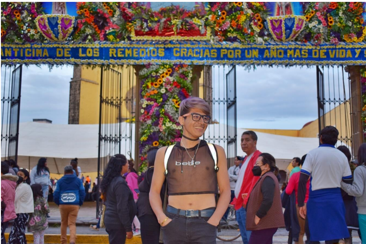
Figura 5. Vamos al baile

13 de junio de 2022. A pesar de que dentro del canon y la institucionalidad católica no está claro su posicionamiento frente a la comunidad LGBTTTIQ+ la comunidad originaria que se encuentra fuera de la heteronormatividad y cismnormatividad también asiste a los bailes. La persona que me concedió la foto no va a la iglesia, va más bien al baile.