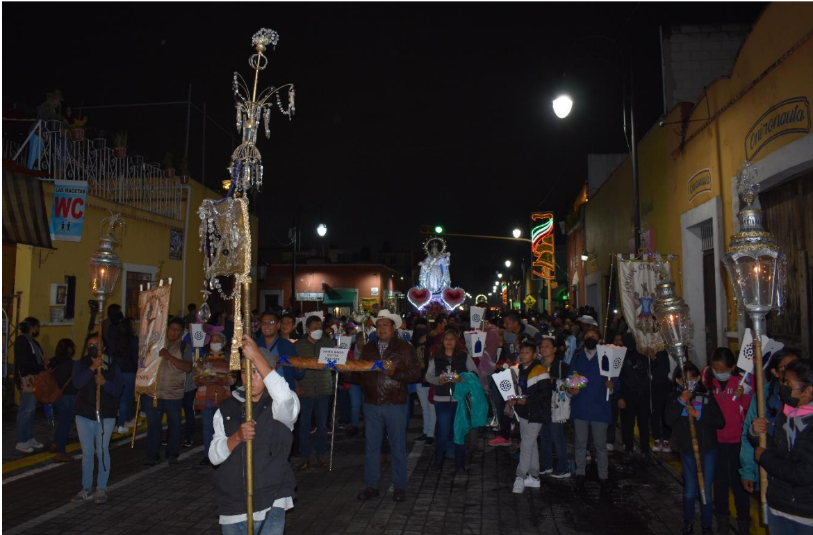
Figura 6. Los faroles de Cholula

31 de agosto de 2022. Inicio de la procesión en la avenida Morelos a una calle del pie de la pirámide. Los cetros y estandartes siempre son parte de las procesiones cholultecas a excepción de las procesiones de las personas difuntas.