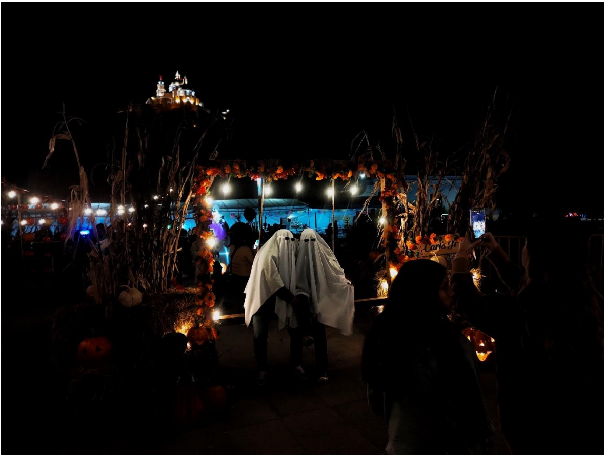
Figura 16. Escenario turístico de simulación

Fotografía de Fabián Toxqui Rodríguez en 31 2023. Las fotografías son una parte central del consumo cultural en Cholula por lo que en ocasiones es más importante tener escenarios fotografiables que simulen experiencias que vivir experiencias distintas.