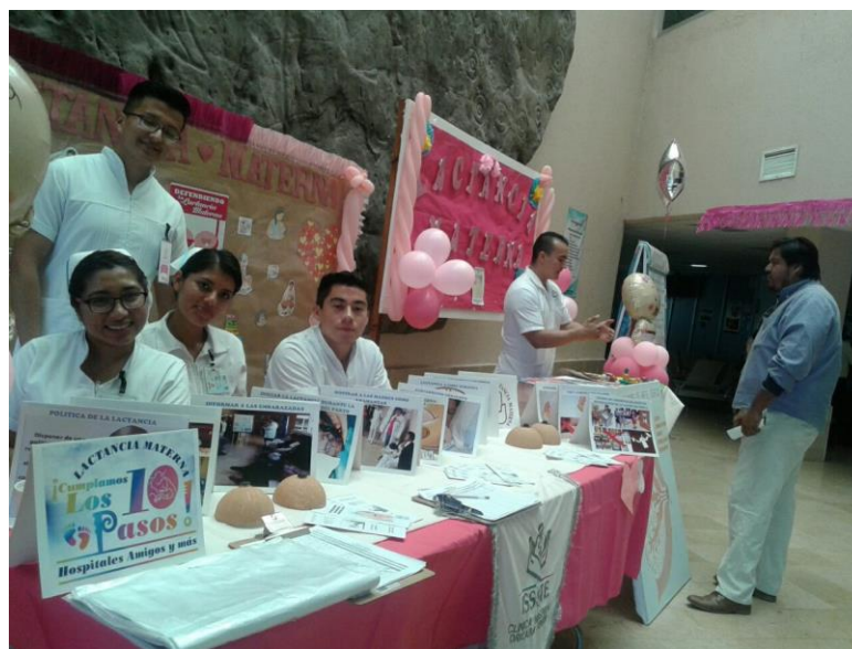
Fotografía 1 Título: Capacitación Lactancia Materna 1

Además se realizaron carteles que fueron colocados dentro de la institución de salud, promoviendo la lactancia materna, se coordinó el trabajo con estudiantes de otras instituciones a quienes se les indico el mensaje primario de esta campaña.