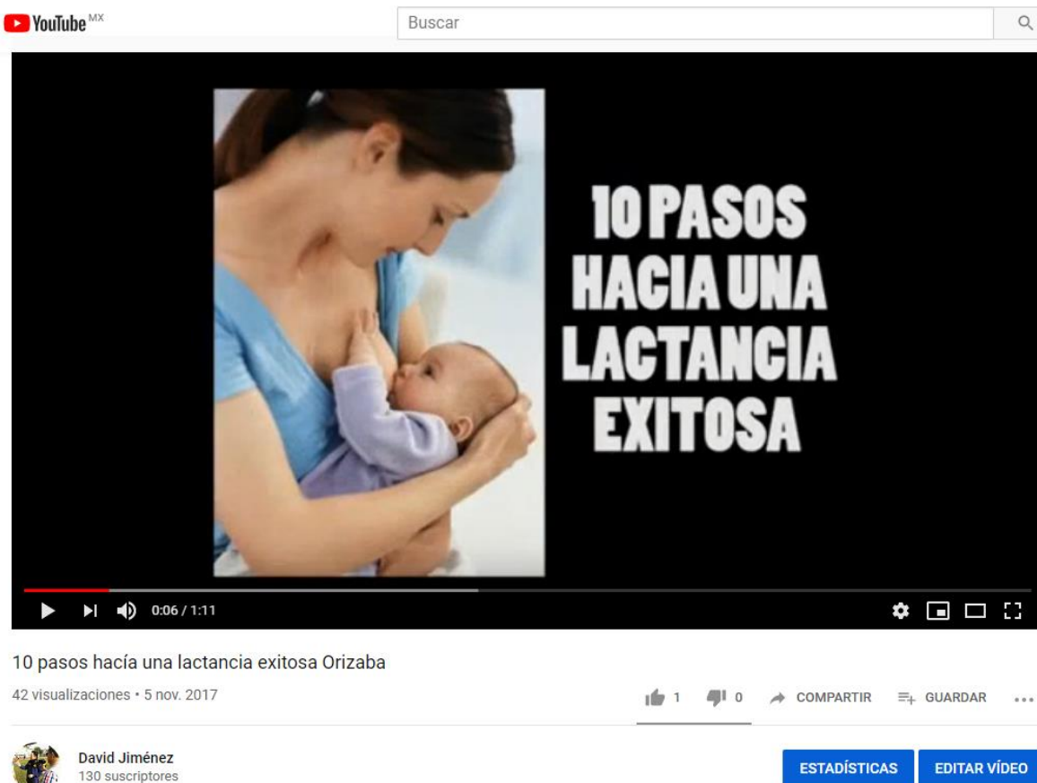
Captura de pantalla: Video Lactancia Materna Fuente: YouTube Autor: David Jiménez

Al proyectar la campaña audiovisual para la acreditación de la clínica hospital ISSSTE Orizaba en la IHAN (iniciativa hospital amigo del niño - 2017) se realizó un video en donde se dan a conocer los “10 pasos hacia una lactancia exitosa”