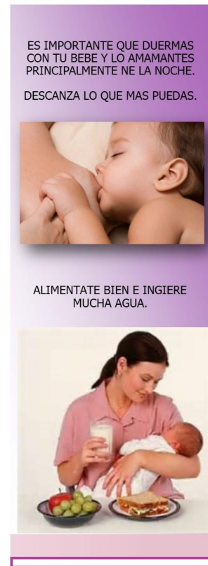
Tríptico Lado B Título: Lactancia Materna ISSSTE

Además se realizaron carteles que fueron colocados dentro de la institución de salud, promoviendo la lactancia materna, se coordinó el trabajo con estudiantes de otras instituciones a quienes se les indico el mensaje primario de esta campaña.