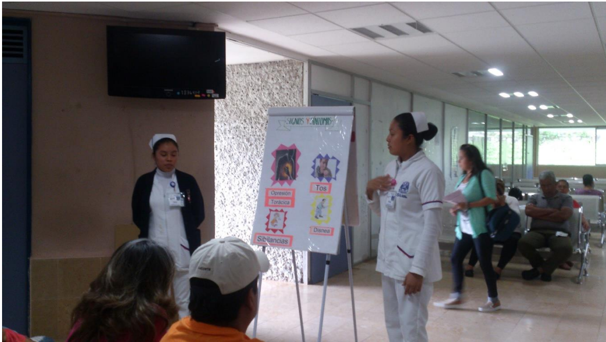
Fotografía 2 Título: Capacitación Lactancia Materna 2