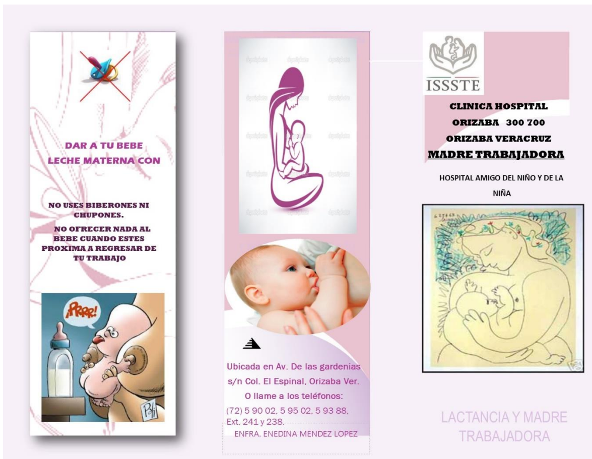
Tríptico Lado A Título: Lactancia Materna ISSSTE

Unos de los puntos que destaca esta iniciativa es la eliminación del biberón y las fórmulas para los recién nacido, por este motivo se les muestra la importancia de darle al bebe el pecho desde la temprana edad.