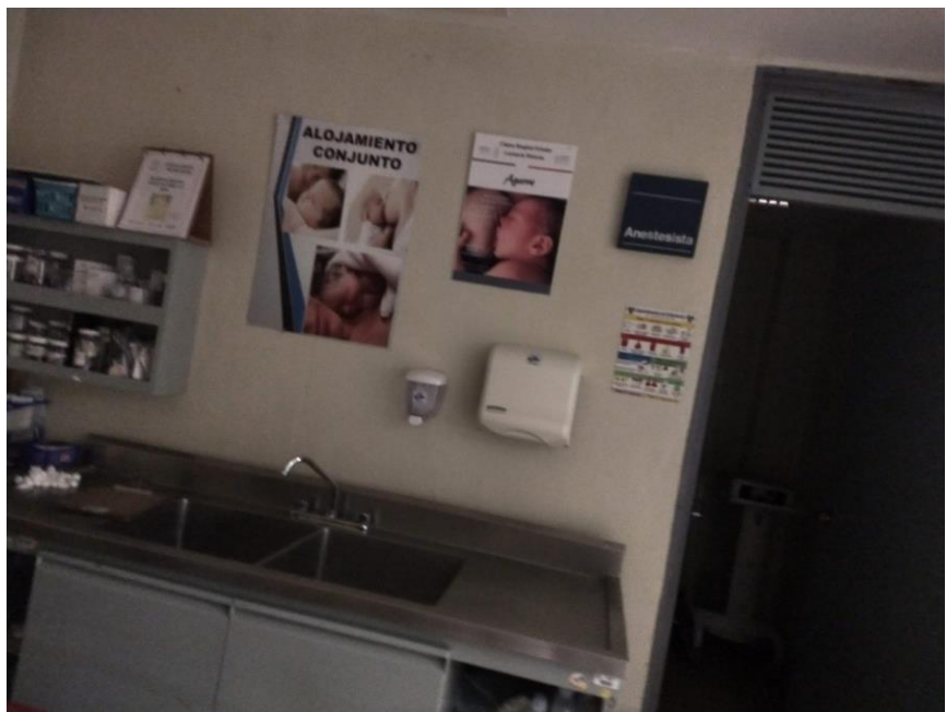
Fotografía 3 Título: Capacitación Lactancia Materna 3