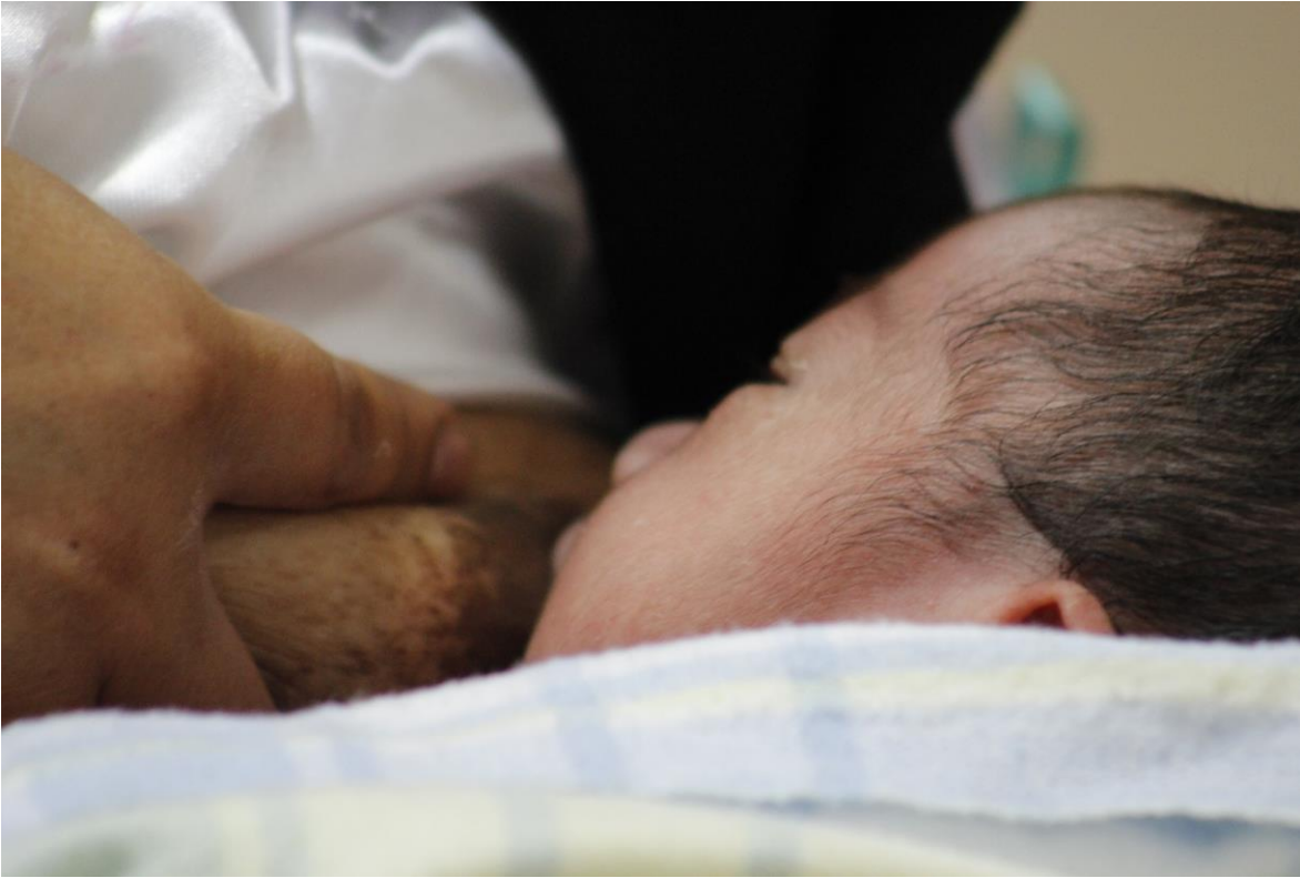
Fotografía 6 -7 Título: Sesión Fotográfica Lactancia Materna Fuente: Propia dura