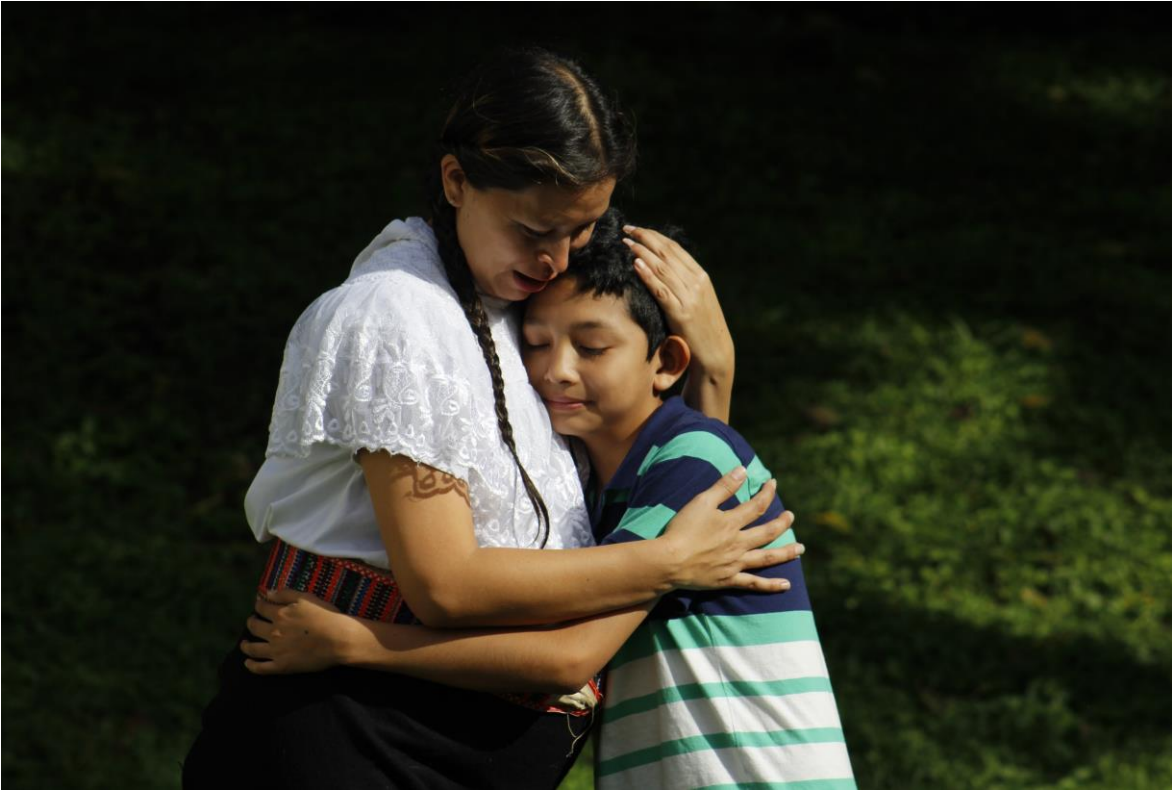
Fotografía 8 - 9 Título: Sesión Fotográfica Lactancia Materna