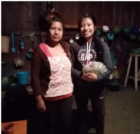
Ilustración 1 Casa de la Sra. Valentina Tzanahua