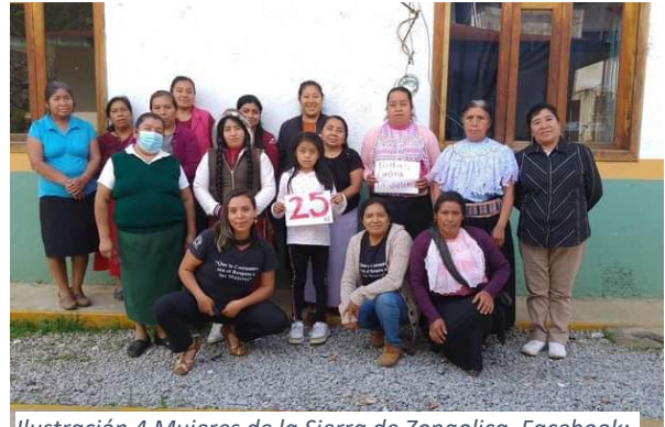
Ilustración 4 Mujeres de la Sierra de Zongolica. Facebook: Kalli Luz Marina