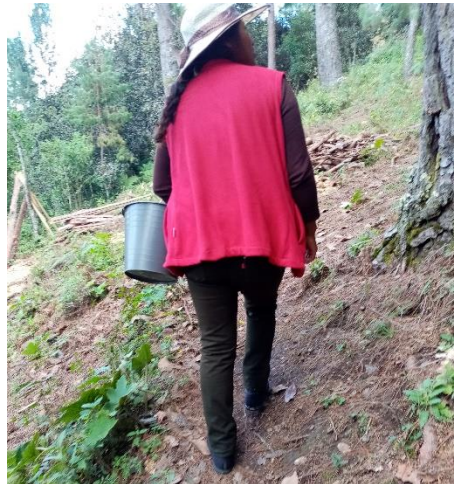
Ilustración 2 Cosecha en Tlaquetzaltitla, Tlaquilpa, Ver.