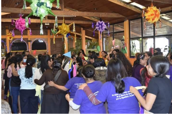
Ilustración 3 Asamblea REPRODMI.