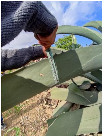
Figura 33. Ancho de la hoja

Con hojas largas de 145-220 cm y un ancho de 30-47 cm (Figura 33). El número de espinas laterales de 48 a 100 y distancias entre ellas de 5.4-6.9 cm. Y la longitud de la espina terminal de 5.4-7.9 cm (Figura 34).