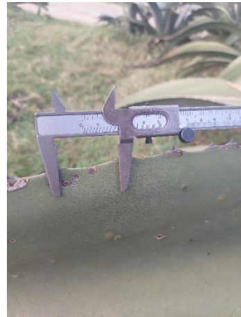
Figura 22 Distancia entre espinas laterales

La altura de las plantas de 240-250 cm, diámetros de la roseta de 70-75 cm. El número de hojas de 64 a 74, con longitud de 140-180 cm (Figura 20) y ancho de 30-31 cm (Figura 21). El número de espinas laterales va de 75 a 80, en la parte media de la hoja están separadas por 4.2-4.3 cm (Figura 22). Con longitudes de espinas terminales de 4.5-5.4 cm.