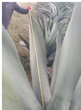
Figura 4. Longitud de la hoja