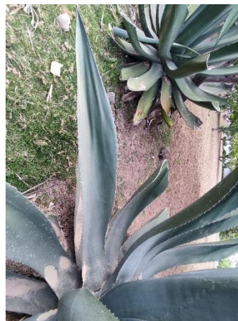
Figura 36. Forma de la hoja

Con altura de la planta de 180-260 cm, un diámetro de la roseta de 50-95 cm. El número de hojas de 29 a 69 en las plantas más altas. Con hojas de 135-190 cm de longitud y un ancho de 25-39 cm (Figura 37). El número de espinas laterales de 45 a 69, y distancias entre ellas de 4.6-6.3 cm (Figura 38). Y la longitud de la espina terminal de 4.6-7.7 cm.