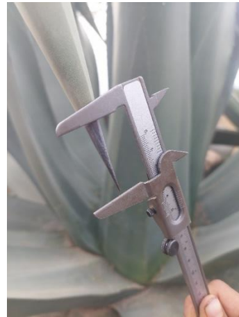
Figura 18. Longitud de espina terminal

El número de espinas laterales de 40 a 58, que están separadas de 6.2-7.4 cm (Figura 17). Las espinas terminales tienen longitudes de 5.6-.6.5 cm (Figura 18).