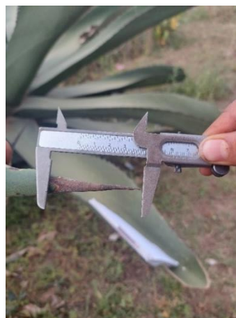
Figura 6. Longitud de espina terminal

El segundo grupo identificado como Maguey Tepezorra Macho (Figura 7) con 25 individuos, la forma de la hoja es lineal, de corte transversal en forma de V, color verde y la espina terminal en forma recta. La altura de las plantas va de 170-270 cm, diámetros de la roseta de 40-80 cm. El número de hojas de 30 a 65, con longitudes de la hoja de 130-200 cm (Figura 8), el ancho 26-40 cm. Con número de espinas laterales de 33 a 70, en la parte media de la hoja tienen una distancia entre ellas de 4.1-7.2 cm (Figura 9). La espina terminal con una longitud de 4.6-.7.6 cm (Figura 10).