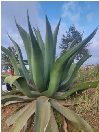
Figura 7. Maguey Tepezorra Macho