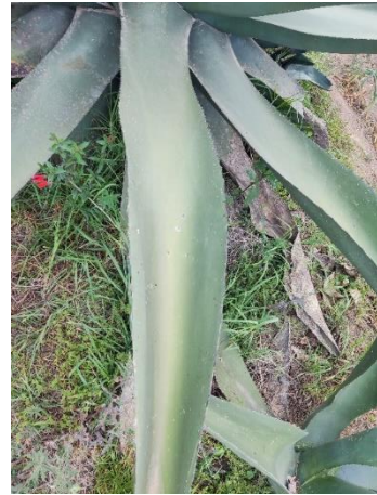
Figura 24. Forma de la hoja

La altura de las plantas va de 100-270 cm, con diámetros de roseta desde los 30 cm en los individuos jóvenes, hasta 90 cm en los de mayor edad. El número de hojas varia de 18 a 65 en los individuos más altos, la longitud de la penca varia de 65-210 cm, el ancho mayor de la hoja de 18-47 cm (Figura 25). El número de espinas laterales de 25 a 84 dependiendo la longitud de la penca y la edad de la planta, la distancia entre las espinas laterales de 3.2-7.7 cm. La longitud de la espina terminal de 5-7.9 cm (Figura 26).