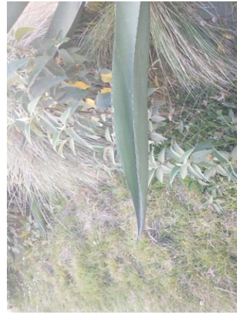
Figura 28. Forma de la hoja

Y la longitud de la espina terminal de 6.2-7.2 cm (Figura 30).