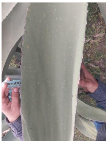
Figura 5. Ancho de la hoja