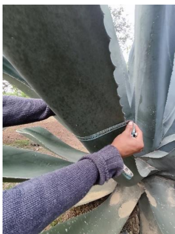
Figura 37. Ancho de la hoja

Con altura de la planta de 180-260 cm, un diámetro de la roseta de 50-95 cm. El número de hojas de 29 a 69 en las plantas más altas. Con hojas de 135-190 cm de longitud y un ancho de 25-39 cm (Figura 37). El número de espinas laterales de 45 a 69, y distancias entre ellas de 4.6-6.3 cm (Figura 38). Y la longitud de la espina terminal de 4.6-7.7 cm.