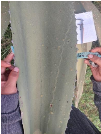
Figura 21. Ancho de la hoja