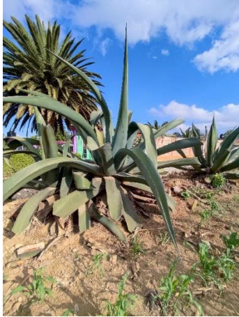
Figura 31. Maguey Macho

recta. Con altura de la planta de 275-310 cm, un diámetro de la roseta de 75-100 cm. El número de hojas de 45 a 72 en las plantas más altas.