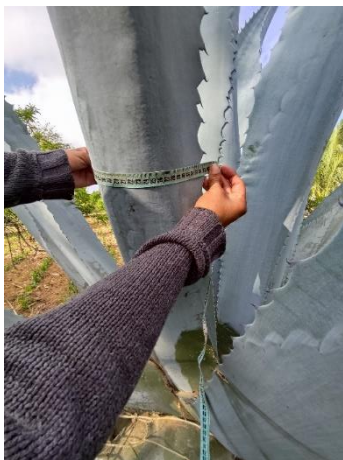
Figura 41. Ancho de la hoja