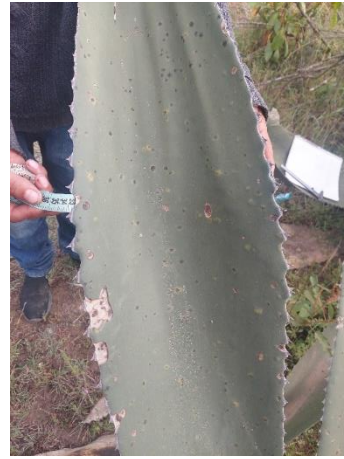
Figura 12. Ancho de la hoja