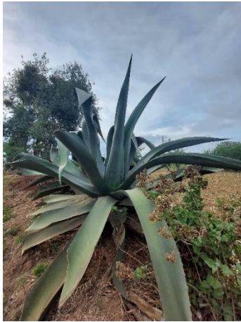
Figura 15. Maguey Macho