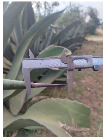
Figura 10. Longitud de espina terminal

Con 23 individuos el grupo de Maguey Tepezorra Hembra (Figura 11) presenta forma de la hoja lanceolada, un corte transversal de la hoja en forma de V, color verde y la espina terminal en forma recta. La altura de las plantas va de 130-270 cm, diámetros de la roseta de 35-90 cm. El número de hojas de 22 a 62, con longitudes de la hoja de 112-220 cm, el ancho de 27-40 cm (Figura 12). El número de espinas laterales de 30 a 56, en la parte media de la hoja las espinas están separadas por 4.2-6.6 cm (Figura 13). Y la longitud de espina terminal de 4.9-.7.7 cm (Figura 14).