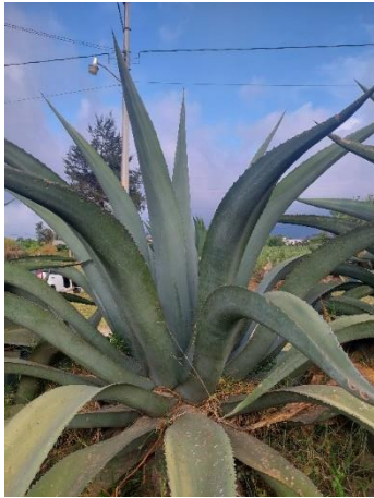
Figura 19. Magüey Xaco