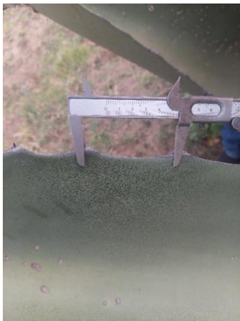
Figura 9. Distancia entre espinas laterales