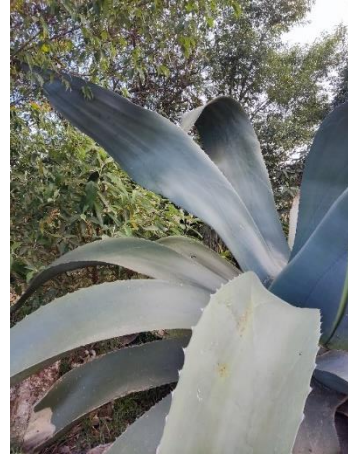
Figura 32. Forma de la hoja

Con hojas largas de 145-220 cm y un ancho de 30-47 cm (Figura 33). El número de espinas laterales de 48 a 100 y distancias entre ellas de 5.4-6.9 cm. Y la longitud de la espina terminal de 5.4-7.9 cm (Figura 34).