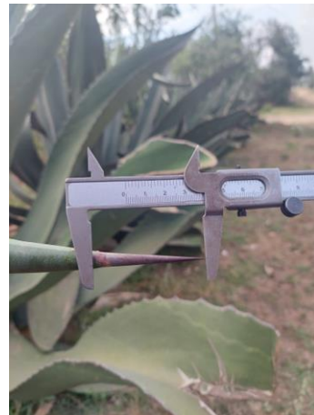
Figura 30. Longitud de espina terminal

El siguiente grupo Maguey Macho (Figura 31) con 10 ejemplares la forma de la hoja oblonga (Figura 32), corte transversal de la hoja cóncavo, color azul y espina terminal