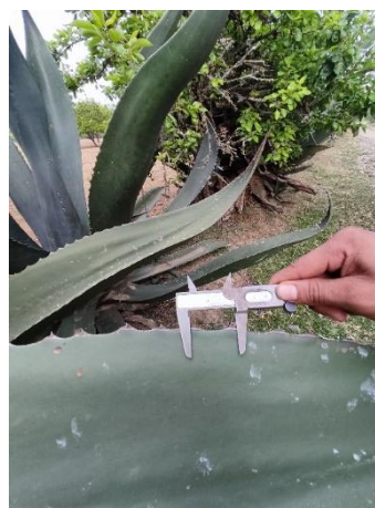
Figura 38. Distancia entre espinas laterales

El Maguey Cenizo (Figura 39) con dos ejemplares presenta forma de la hoja lineal, corte transversal en forma de V, color azul y espina terminal recta. Con altura de la planta de 230-250 cm, un diámetro de la roseta de 65-75 cm. El número de hojas de 53 a 75 en las plantas más altas. Con hojas de 175-190 cm de longitud (Figura 40) y un ancho de 28-30 cm (Figura 41). El número de espinas laterales de 55 a 65, y