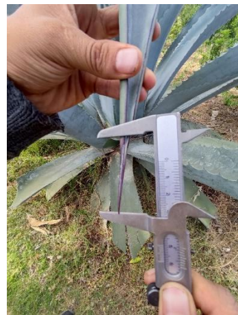
Figura 42. Longitud de la espina terminal