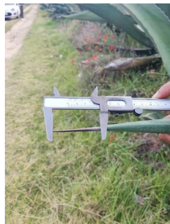
Figura 26. Longitud de espina terminal