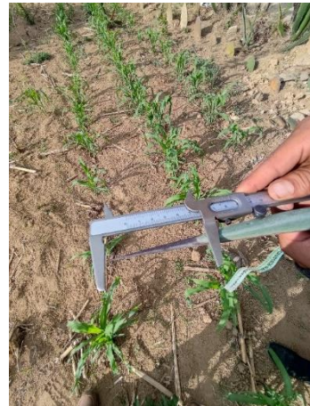
Figura 34 Longitud de la espina terminal

Con siete ejemplares Maguey Sierrilla (Figura 35) con forma de la hoja lineal (Figura 36), corte transversal en forma de V, color verde y espina terminal recta.