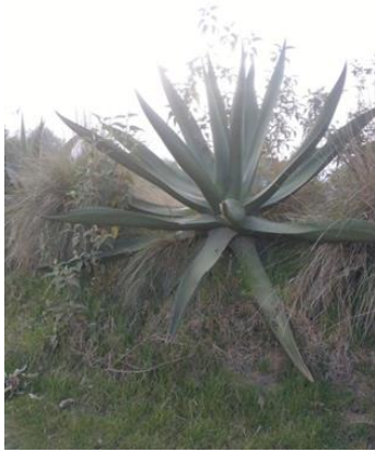
Figura 27. Maguey Cosante Verde

El segundo grupo de 23 ejemplares de Maguey Cosante Verde (Figura 27), con forma de la hoja lanceolada (Figura 28), corte transversal en forma de V, color verde y espina terminal recta. Con altura de la planta de 100-245 cm, un diámetro de la roseta de 35-70 cm. El número de hojas de 20 a 62 en las plantas más altas. Con hojas largas de 90-200 cm, un ancho de hoja de 25-40 cm. El número de espinas laterales de 23 a 65, y distancias entre ellas de 4.7-6.8 cm (Figura 29).