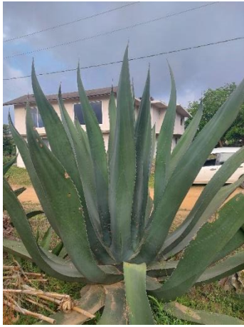
Figura 11. Maguey Tepezorra Hembra