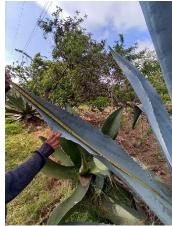
Figura 40. Longitud de la hoja