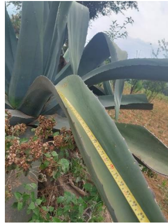
Figura 16. Longitud de la hoja