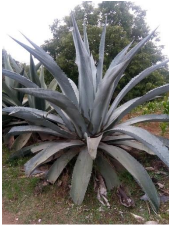
Figura 39. Maguey Cenizo

distancias entre ellas de 2.9-4.6 cm. Y la longitud de la espina terminal de 4.7-5.2 cm (Figura 42).