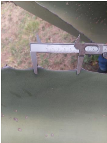
Figura 29. Distancia entre espinas laterales

Y la longitud de la espina terminal de 6.2-7.2 cm (Figura 30).