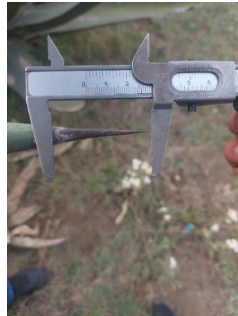
Figura 14. Longitud de espina terminal

En el cuarto grupo se miden solo seis ejemplares que corresponden a Maguey Macho (Figura 15), su población es baja y presentan forma de la hoja oblonga, un corte transversal de la hoja cóncavo, el color de la planta en este caso es azul y la espina terminal en forma recta. Presenta las mayores medidas en la altura de la planta de 280-290 cm, así mismo presenta los diámetros de la roseta más grandes de 75-100 cm. Gracias a su mayor altura el número de hojas también aumenta de 55 a 70, con longitudes de 170-270 cm (Figura 16), el ancho va de 36-40 cm.