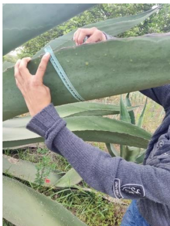
Figura 25. Ancho de la hoja

La altura de las plantas va de 100-270 cm, con diámetros de roseta desde los 30 cm en los individuos jóvenes, hasta 90 cm en los de mayor edad. El número de hojas varia de 18 a 65 en los individuos más altos, la longitud de la penca varia de 65-210 cm, el ancho mayor de la hoja de 18-47 cm (Figura 25). El número de espinas laterales de 25 a 84 dependiendo la longitud de la penca y la edad de la planta, la distancia entre las espinas laterales de 3.2-7.7 cm. La longitud de la espina terminal de 5-7.9 cm (Figura 26).