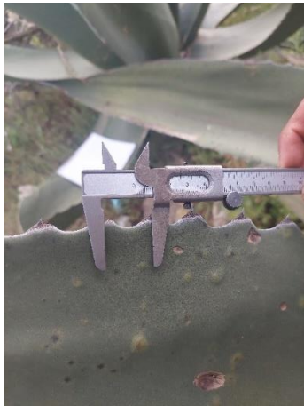
Figura 13. Distancia entre espinas laterales