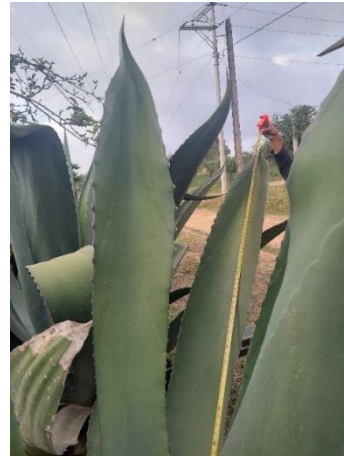
Figura 8. Longitud de la hoja