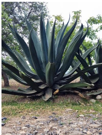
Figura 35. Maguey Sierrilla