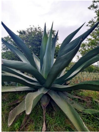
Figura 23. Maguey Verde