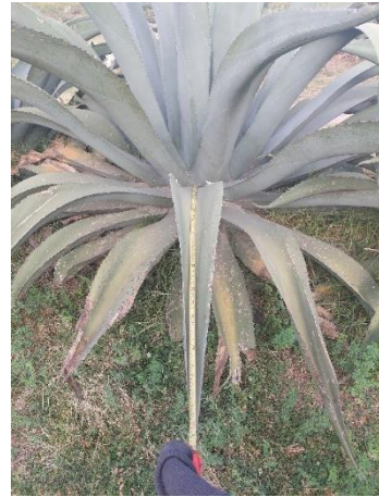
Figura 20. Longitud de la hoja