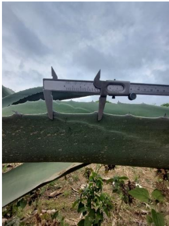
Figura 17. Distancia entre espinas laterales