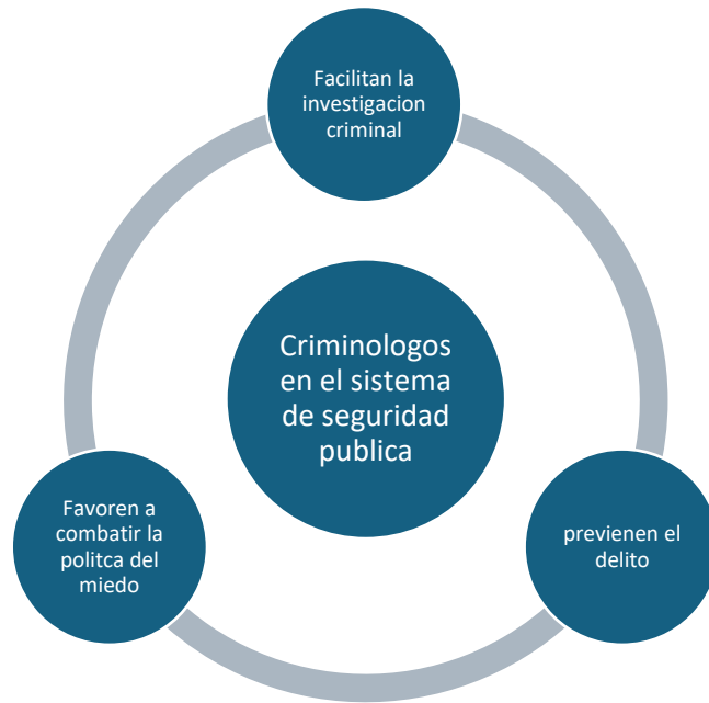
Gráfico 1: Análisis de aplicaciones de criminólogos al sistema de seguridad pública de Puebla, autoría propia.

Aunque este gráfico es favorable, personalmente añadiría otro el cual es agilizar los procesos de la seguridad pública, ya que están comprobados que los criminólogos como parte de su formación buscan conocer y prevenir la actividad delictiva en ciertas situaciones y ciudades, por ello el gráfico quedaría de esta manera.