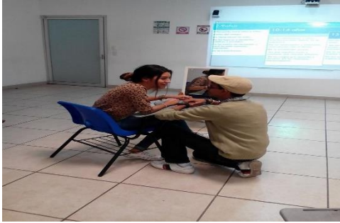
hablar fig. 3.3

Los padres y las madres (fig. 3.3) deberían de ser las personas a quienes ellos piden consejos y orientación y hablando francamente: puede ser difícil hablar de la sexualidad en general, pero hablar con los o las hijas sobre la sexualidad los hace sentir todavía más presionados. Por lo tanto, es aquí donde radica la importancia del taller porque si entonces, los padres y las madres se sienten incómodos o incomodas al