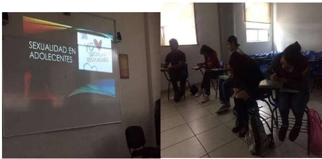
fig. 4.1 y 4.

difícil de formularlas, aun así fuimos de la mejor manera.