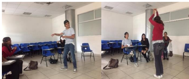
fig. 4.3 y 4.4

La actitud de los participantes fue muy activa (como se muestra en las figuras 4.3 y 4.4) es un público muy curioso, y aunque fueron pocos asistentes se lograron contestar todas las preguntas, la mayoría en torno a bases bilógicas “¿Qué es un orgasmo?” “¿Cómo se producen los espermatozoides”? lo que sí es un poco preocupante a nuestro parecer fueron las mujeres, pues participaron muy poco y de los que obtuvimos mayor número de preguntas fueron de hombres. Notamos que de ninguna manera se aburrieron pues tratamos de que el taller fuera más dinámico y con más actividades y así mismo mesclar la parte teórica.