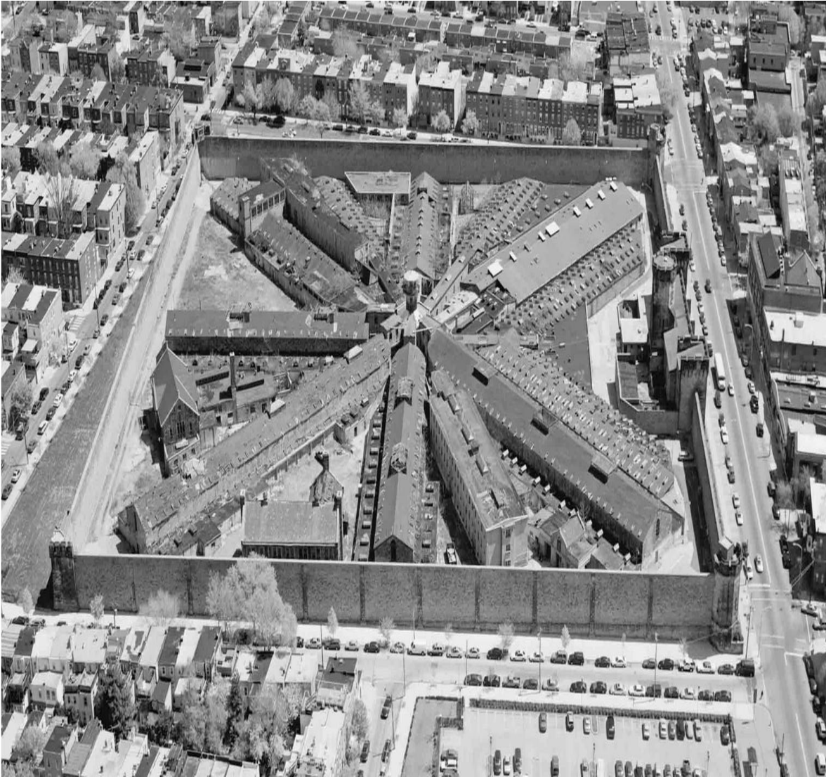
Ex penitenciaría de Lecumberri, México