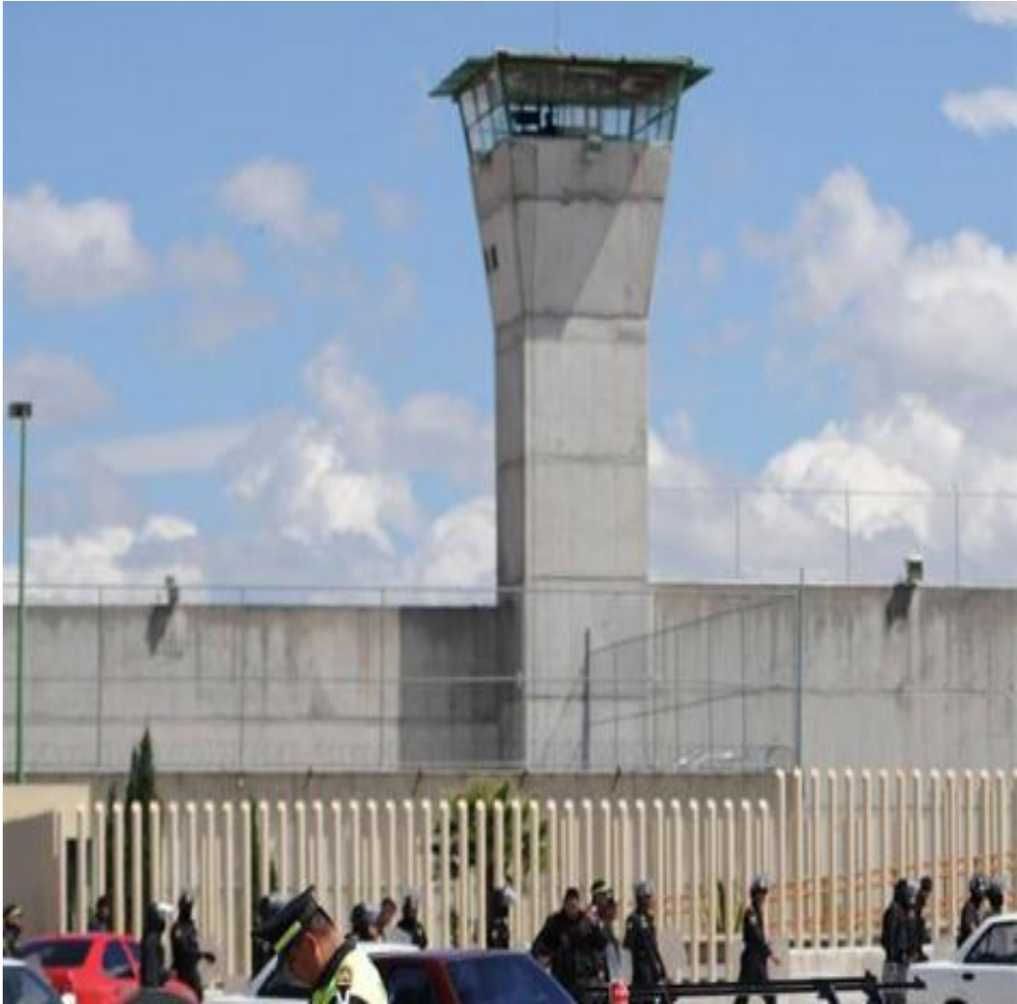
Penal de San Miguel, Puebla