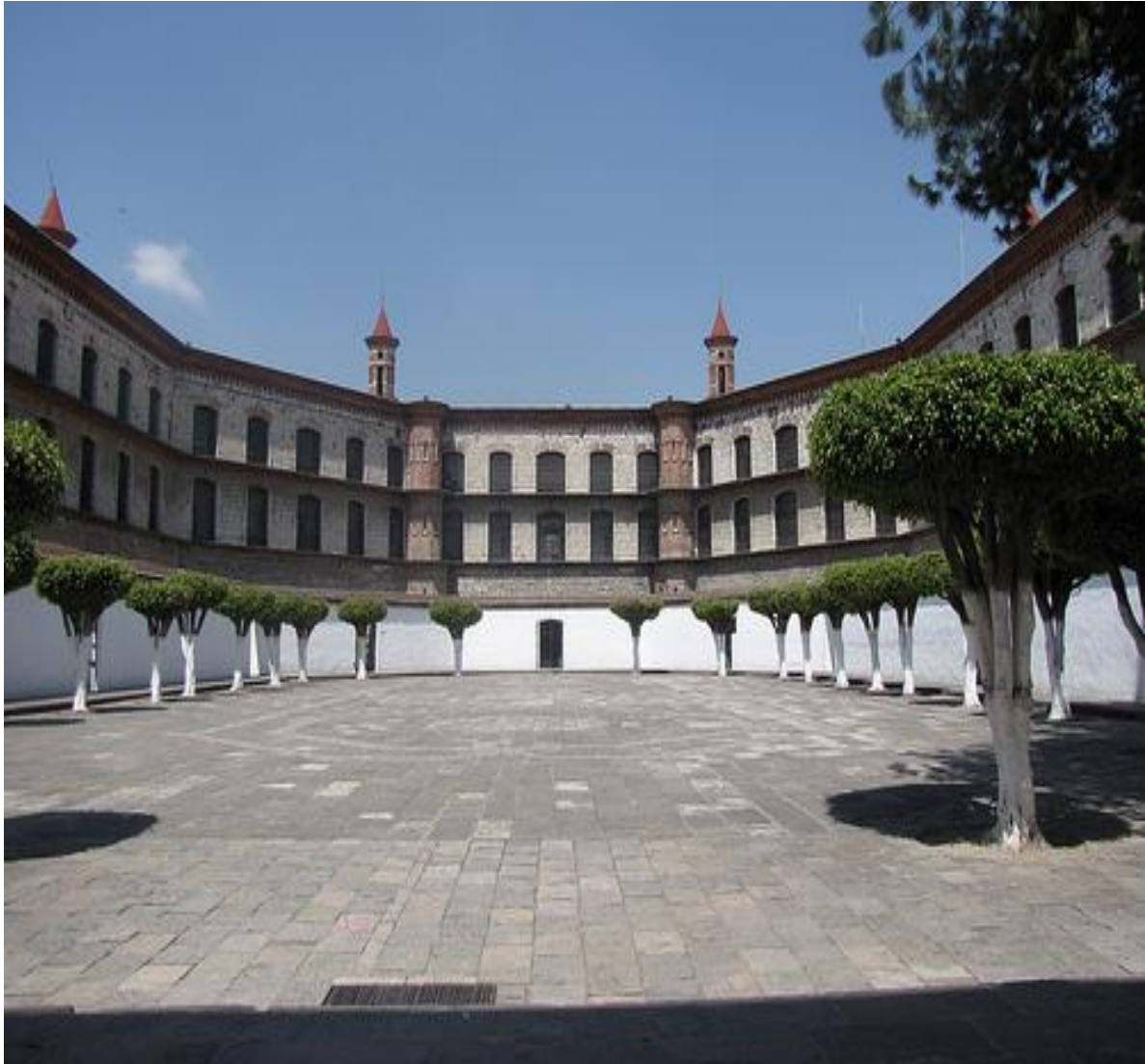
Ex penitenciaría de Puebla