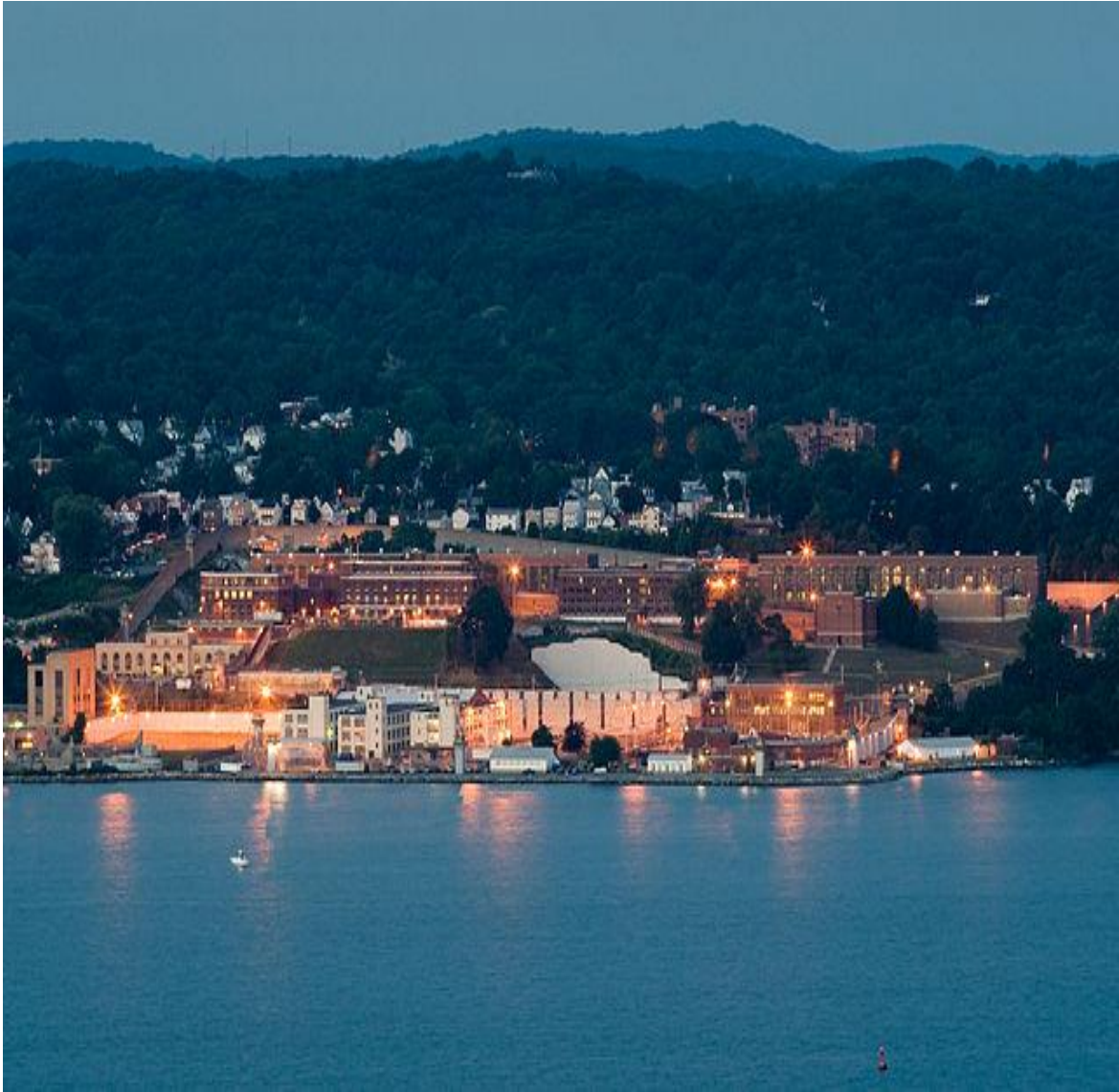
Cárcel de Sing Sing, Nueva York