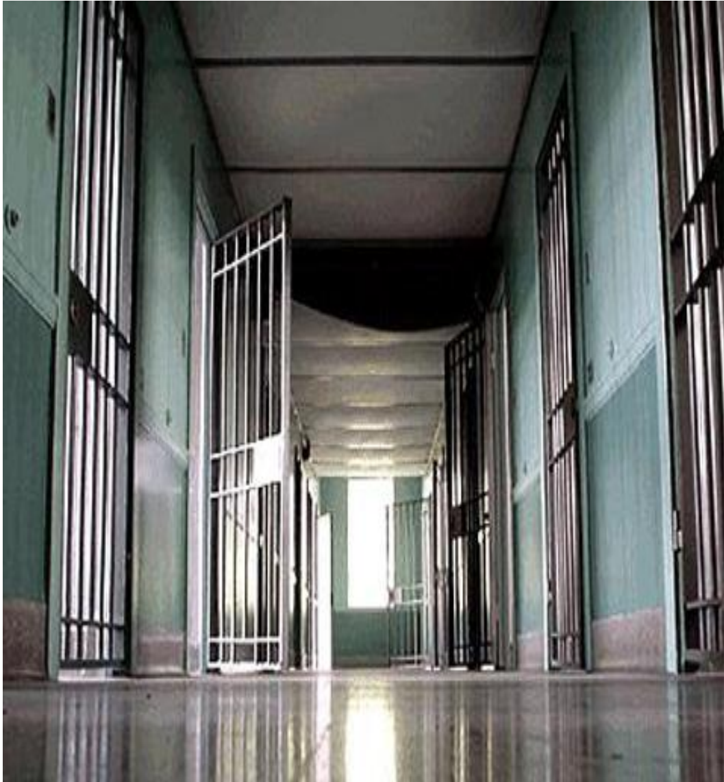
Penal de Torreón, Coahuila