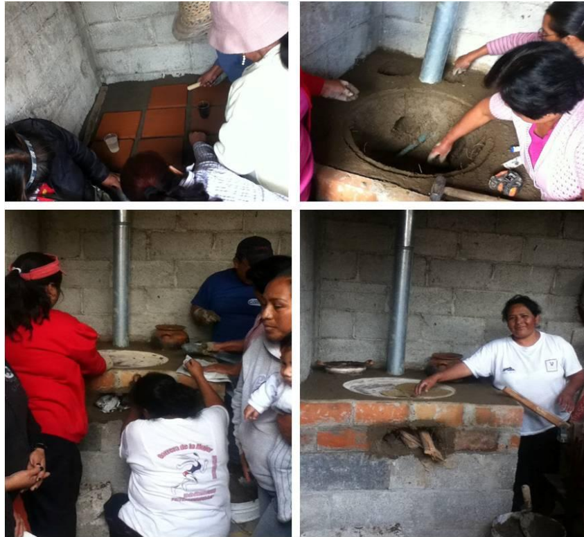
Ilustración II.13 Construyendo el comal

Entre los proyectos más destacados que permitieron una pequeña entrada económica a los integrantes de CAFAMI se encuentra el moldeado del vidrio soplado que lo convertían en artesanías y joyas locales que más adelante venderían en mercados de economías solidarias, ferias y algunos comercios que tienen afluencia turística como hoteles y restaurantes de la ciudad de Tlaxcala. Es importante señalar que la mayoría de los integrantes de este proyecto fueron jóvenes de la comunidad de Tetlanohcan.