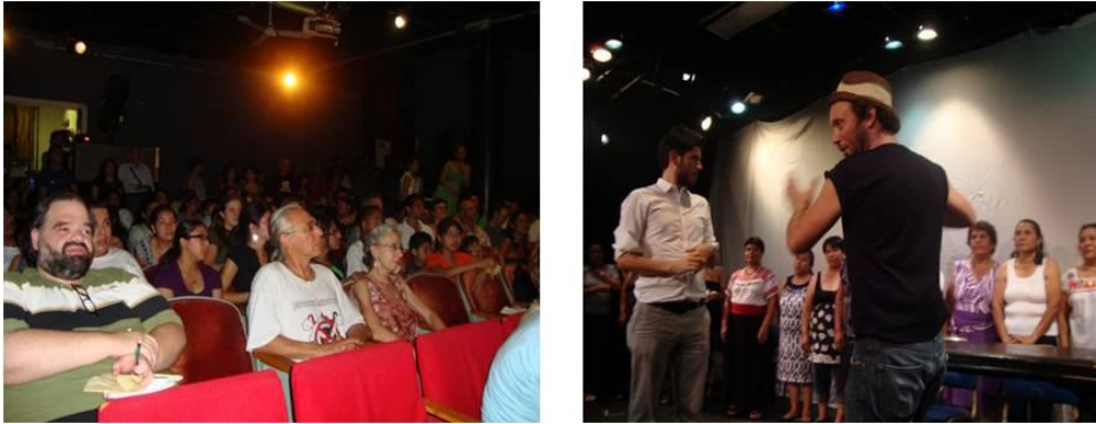
Ilustración III.3 "La Casa Rosa" en Nueva York

de septiembre en el teatro INTAR en la ciudad de Nueva York; y el 29 de septiembre en la Universidad de Settlement en la ciudad de Nueva York.