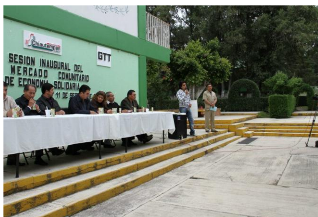
Ilustración II.9 CAFAMI impulsando la economía solidaria

CAFAMI ha impulsado este modelo para que sus integrantes tengan la oportunidad de crecer económicamente desarrollando conocimientos que podrán utilizar posteriormente como herramientas de trabajo. Siguiendo el método de Freire, la organización promovió los encuentros en materia de Economías Solidarias con diferentes instituciones y emprendió talleres de desarrollo y sustentabilidad intentando enseñar a sus integrantes aquellos aspectos que los limitan y los oprimen (como inestabilidad económica) para que a través de este reconocimiento, encuentren su acción liberadora (Freire, 1973). Proponiendo en consecuencia de esta reflexión la creación de proyectos productivos que pudieran ayudar económicamente a los integrantes y sus familias en un futuro próximo.