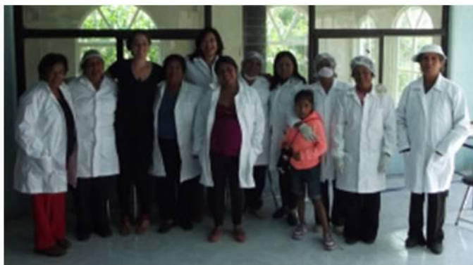
Ilustración II.15 Equipo Herbalintzi