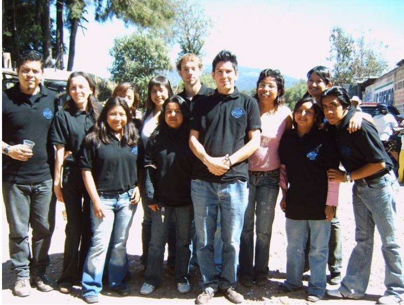
Ilustración II.3 Equipo Centro de Atención de la Familias Migrantes (CAFAMI)