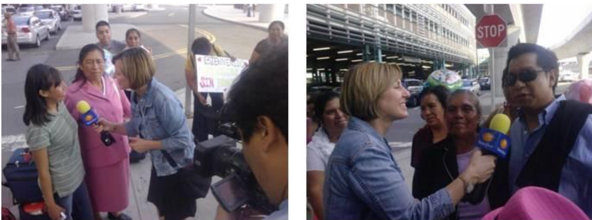
Ilustración III.4 Televisa entrevistando a integrantes de la Casa Rosa y sus familias en Nueva York

La Casa Rosa se convirtió en una obra que generaba mucha polémica sobre su contenido, específicamente para la audiencia norteamericana quienes dudaron de que el guión fuera al cien por ciento de acuerdo con la experiencia y discursos propios de las señoras de Tetlanohcan. Muchos creían que podría haber sido una imposición del director de obra. No obstante, La Casa Rosa fue muy reconocida por los medios de comunicación locales quienes hicieron reportajes y las universidades solicitaron la visita de las mujeres para conocer más de sus historias. En México, la empresa de comunicaciones Televisa entrevistó a las señoras cuando llegaban al aeropuerto en Nueva York y pasó el reportaje en el programa Primero Noticias .