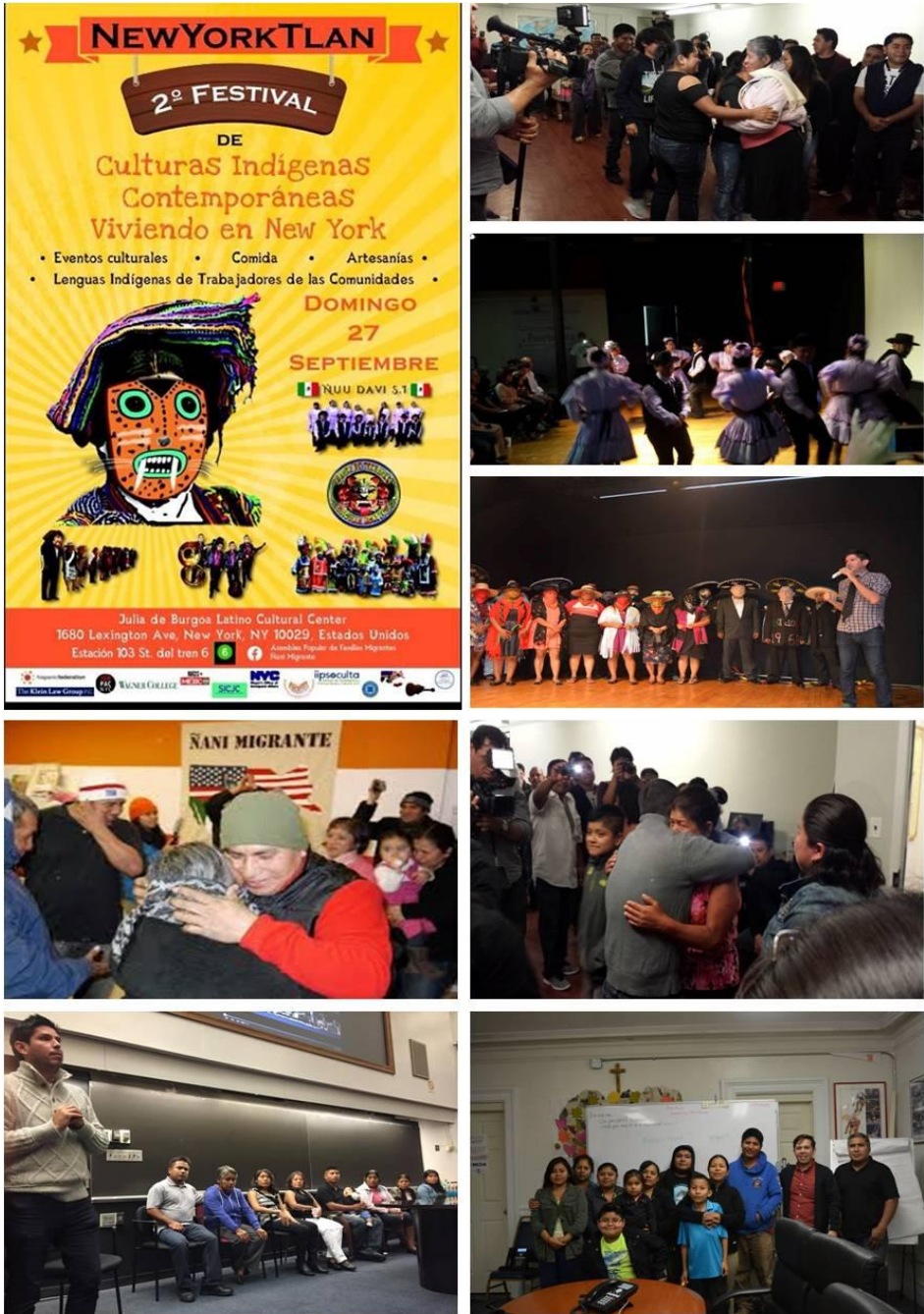
Ilustración IV.1. Ñani Migrante en el evento New York Tlan

Este nuevo éxito de reunificación familiar emprendido por APOFAM es derivado del esfuerzo continuo de la cooperación descentralizada que incluye las organización de los migrantes en Nueva York, una institución que los apoya ampliamente como el Staten Island Community Job Center y la integración de la comunidad organizada Ñani Migrante, que sin su trabajo y perseverancia, este proyecto no podría llevarse a cabo.