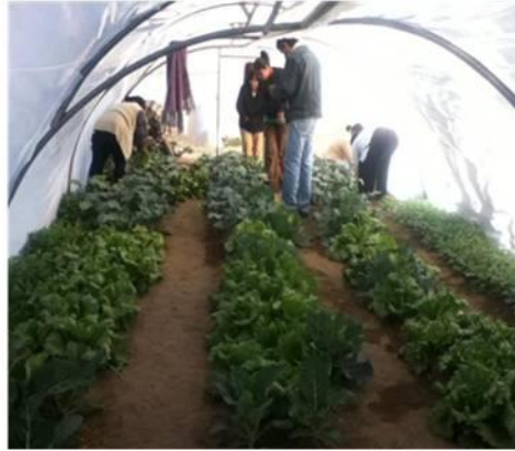
Ilustración II.10 Aprendiendo sobre huertos