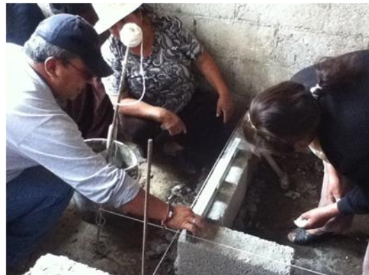
Ilustración II.12 Aprendiendo a construir comales