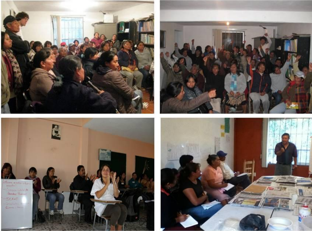
Ilustración II.8 Integrantes de CAFAMI recibiendo educación popular