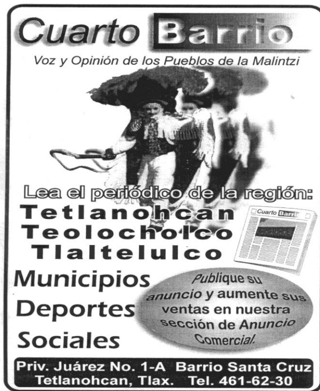
Ilustración II.2 Periódico "Cuarto Barrio. Voz y Opinión de los Pueblos de la Malintzi"

periódico además de permitir la comunicación entre diversas comunidades y ayudar a la promoción comercial, también servía para dar a conocer todas las actividades que impartía IIPSOULTA haciendo un llamado especial a la población para la atracción de nuevos líderes y personas que quisieran compartir algún tipo de conocimiento como: manualidades, tejido, clases de idioma náhuatl, etc.