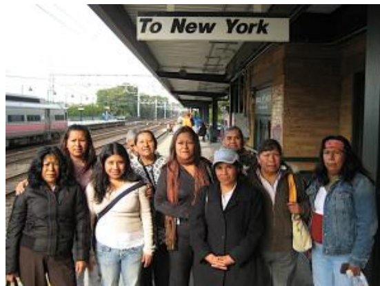
Ilustración III.2 Mujeres de CAFAMI en Nueva York

Finalmente, doce mujeres de CAFAMI lograron realizar el esperado viaje a EUA con la gran motivación de reencontrarse con sus familiares después de un largo período de separación. Al llegar al aeropuerto internacional John F. Kennedy, sus familiares estaban esperando gustosos para recibirlas. Los familiares en EUA se organizaron para dar comida de bienvenida a las nuevas actrices y desearles una gira exitosa.