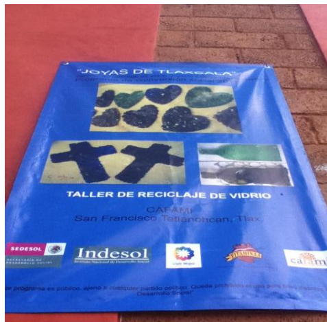
Ilustración II.14 Proyecto apoyado por Sedesol e Indesol

Entre los proyectos más destacados que permitieron una pequeña entrada económica a los integrantes de CAFAMI se encuentra el moldeado del vidrio soplado que lo convertían en artesanías y joyas locales que más adelante venderían en mercados de economías solidarias, ferias y algunos comercios que tienen afluencia turística como hoteles y restaurantes de la ciudad de Tlaxcala. Es importante señalar que la mayoría de los integrantes de este proyecto fueron jóvenes de la comunidad de Tetlanohcan.