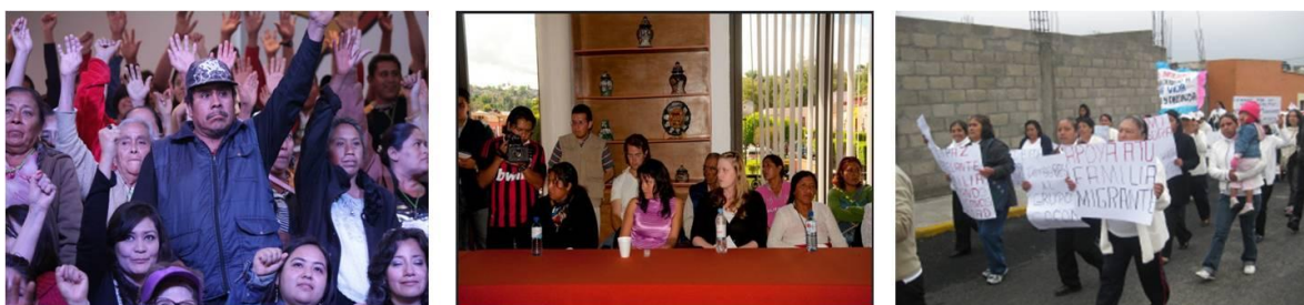
Ilustración III.5. Generando cambio social

En cuanto a su participación social e incidencia pública, algunos relatos de las integrantes mencionaban en estar avergonzadas de participar en marchas antes de entrar a CAFAMI, pero después de La Casa Rosa su perspectiva cambió, y ahora les provoca orgullo compartiéndolo con las personas que las rodean. Otras personas hablaron que el proceso que han experimentado en todas las actividades de la organización contribuyó para formar su espíritu activista actual. Así como la manera de incidir públicamente con mayor arrojo y convicción. Lo más importante de su aprendizaje es que aprendieron a trabajar en equipo junto con más organizaciones para sumar esfuerzos y lograr mayores resultados.