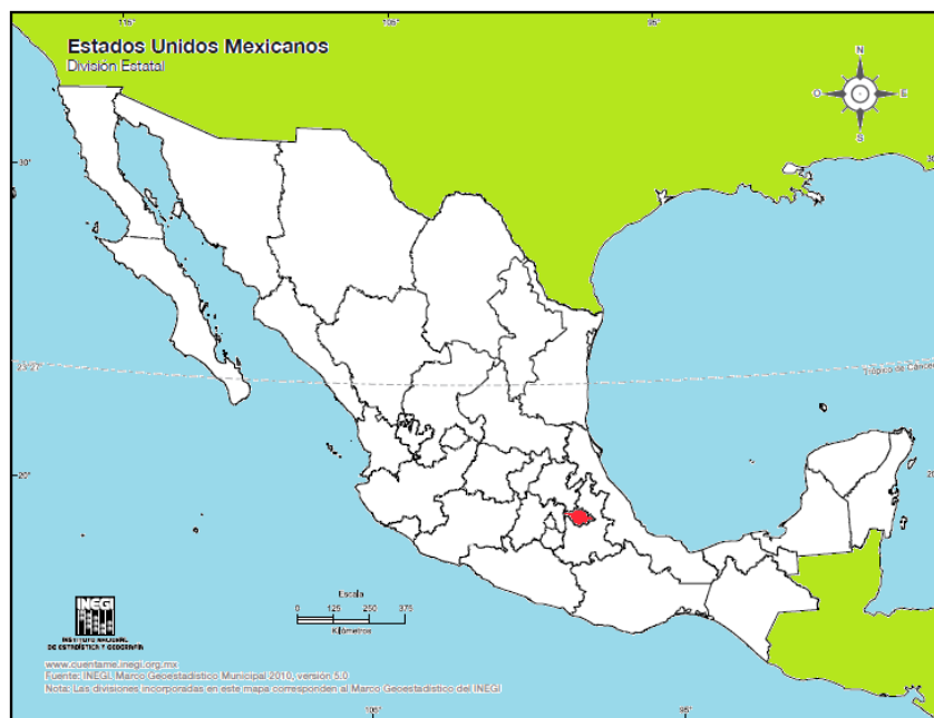
Mapa 1. División Política de la República Mexicana.