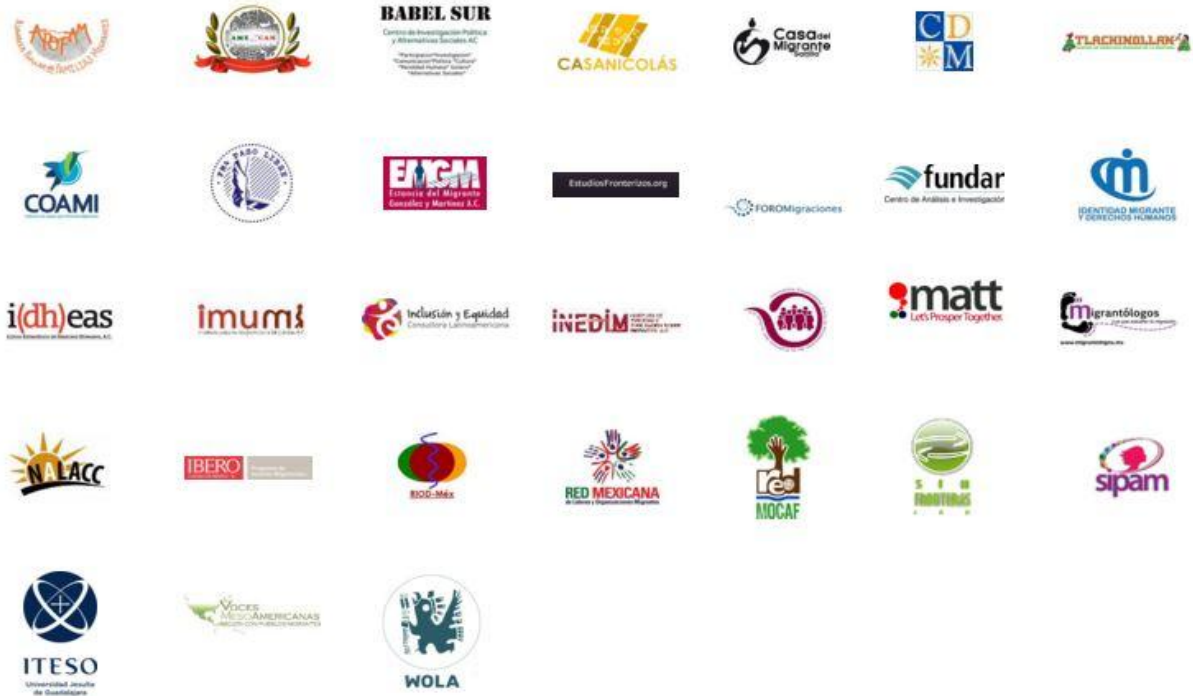
Ilustración IV.2 Organizaciones integrantes del Colectivo Migraciones para las Américas (COMPA)