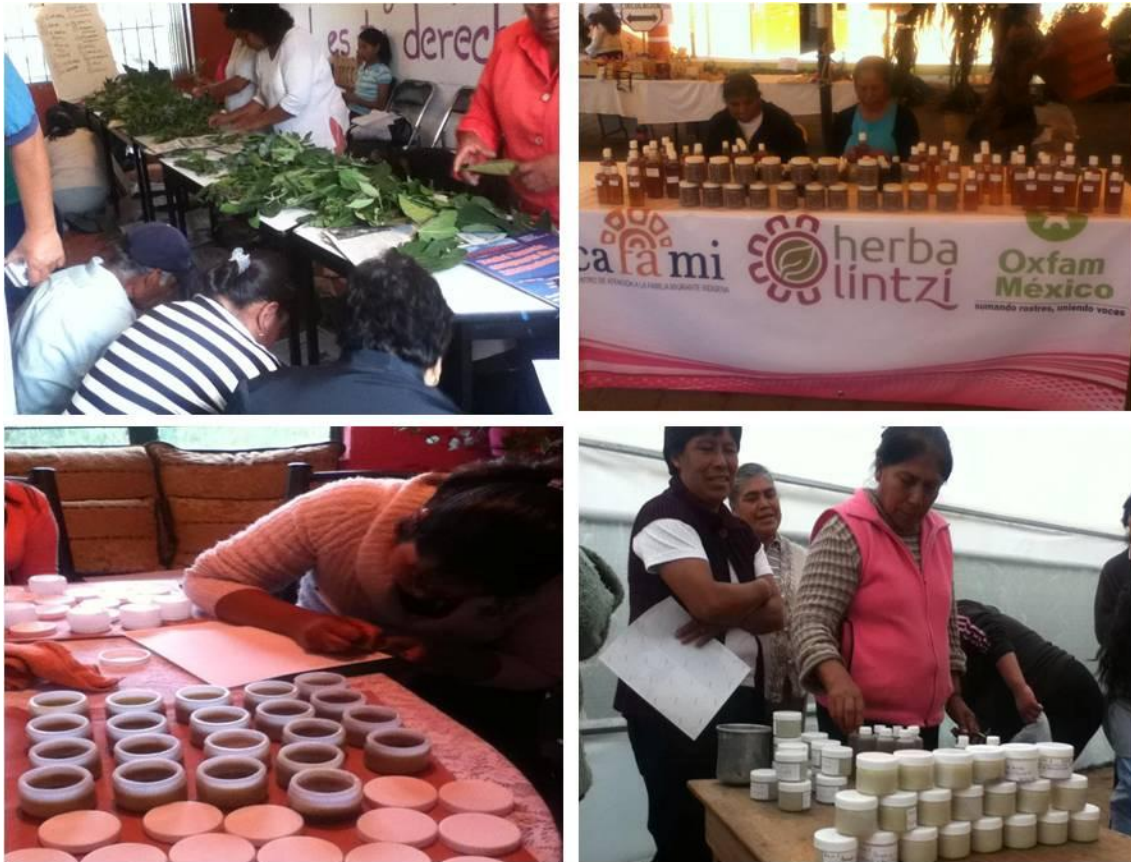
Ilustración II.16. Presentación de productos Herbalintzi