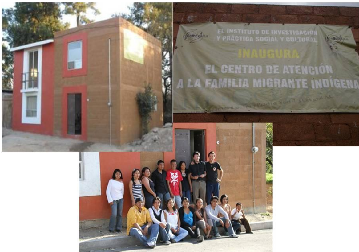
Ilustración II.7 Integrantes del Centro de Atención a la Familia Migrante