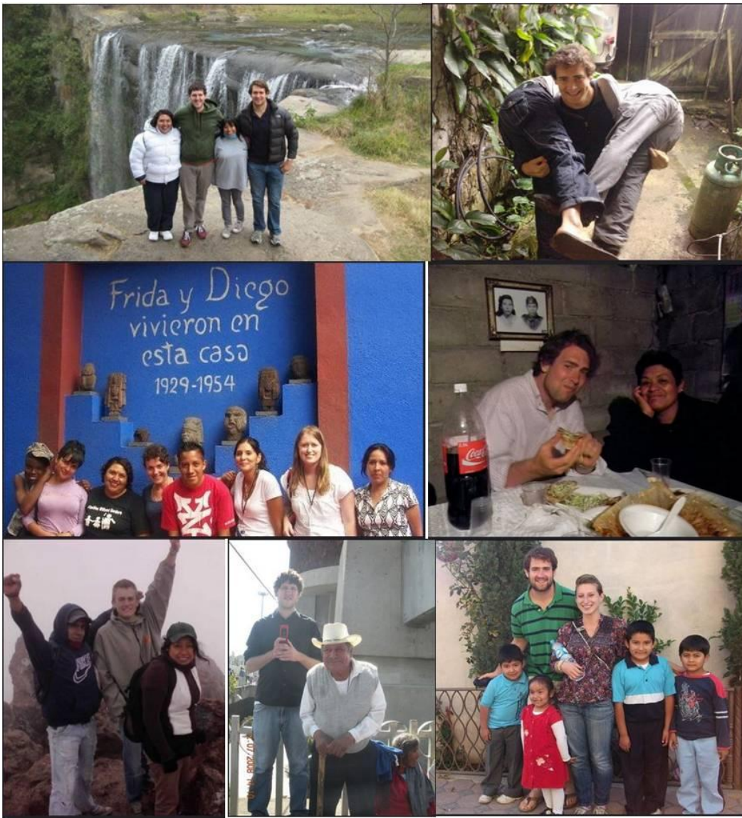
Ilustración II.18 Practicantes extranjeros compartiendo la cultura mexicana

Como parte de la experiencia de los estudiantes extranjeros, IIPSOCULTA tenía el propósito de adentrarlos a la cultura local y fomentar la convivencia con la comunidad. Así que los estudiantes se alojaban en casas de los integrantes de CAFAMI (con un aporte económico por parte de los estudiantes) y vivían desde dentro la vida tetlanoquense como un nuevo integrante de su familia. Se les impartía clases de español y cada familia en conjunto con la organización emprendía viajes culturales y turísticos para seguir motivando a los practicantes.