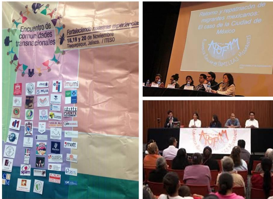
Ilustración IV.3 APOFAM abriendo espacios que permitan hablar de tema migratorios