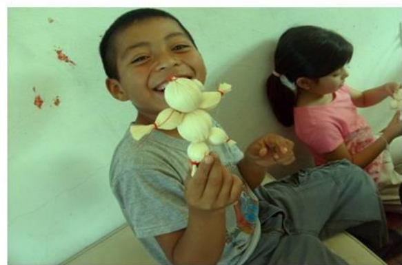
Ilustración II.17 Estudiantes extranjeros enseñando a niños y adultos de la comunidad de Tetlanohcan