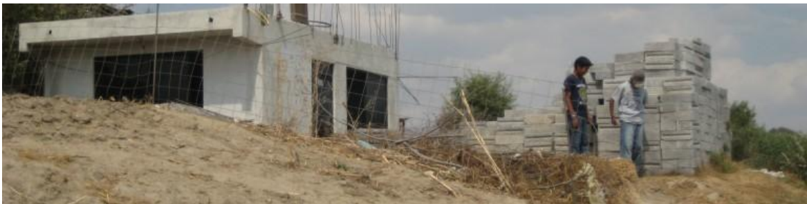
Ilustración II.6 Construcción del Centro de Atención a Familias Migrantes