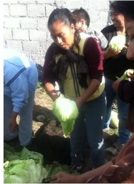
Ilustración II.11 Cosecha de rábanos y lechugas

De la misma manera, se enseñó a la comunidad la construcción física de hornos de leña y comales caseros como alternativa a la estufa tradicional promoviendo la economía familiar y generando una herramienta de trabajo que posteriormente les daría un ingreso económico con el desarrollo de pequeños comercios del sector alimenticio.