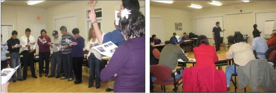
Ilustración II.5 Trabajo de IIPSOCULTA en Estados Unidos

Mientras tanto en Tetlanohcan decidieron emprender uno de los proyectos con mayor impacto de IIPSOCULTA que es el Centro de Atención a la Familia Migrante Indígena (CAFAMI). Siendo que la mayoría de los integrantes de la organización enfrenta la misma temática sobre migración, CAFAMI fue un proyecto creado para desarrollar soluciones a los efectos derivados de esta problemática como: la desintegración familiar, depresión, problemas económicos, hijos rebeldes, abandono del campo, nuevas responsabilidades en el hogar, y familiares desaparecidos. Anteriormente, los integrantes de CAFAMI prácticamente eran todas las personas que conformaban IIPSOCULTA con aproximadamente ochenta por ciento de género femenino, entre los 16-70 años de edad, y unos cuantos jóvenes que dirigían las actividades en la organización.