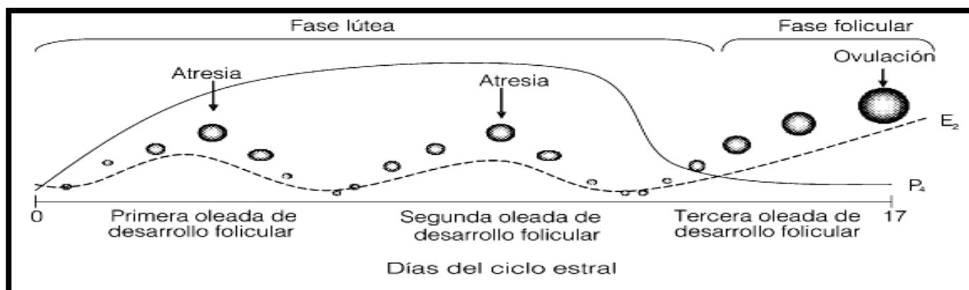
Figura 1. Dinámica folicular durante el ciclo estral de la oveja (Arroyo, 2006)

Facilita el destete, engorda y comercialización de lotes uniformes de animales