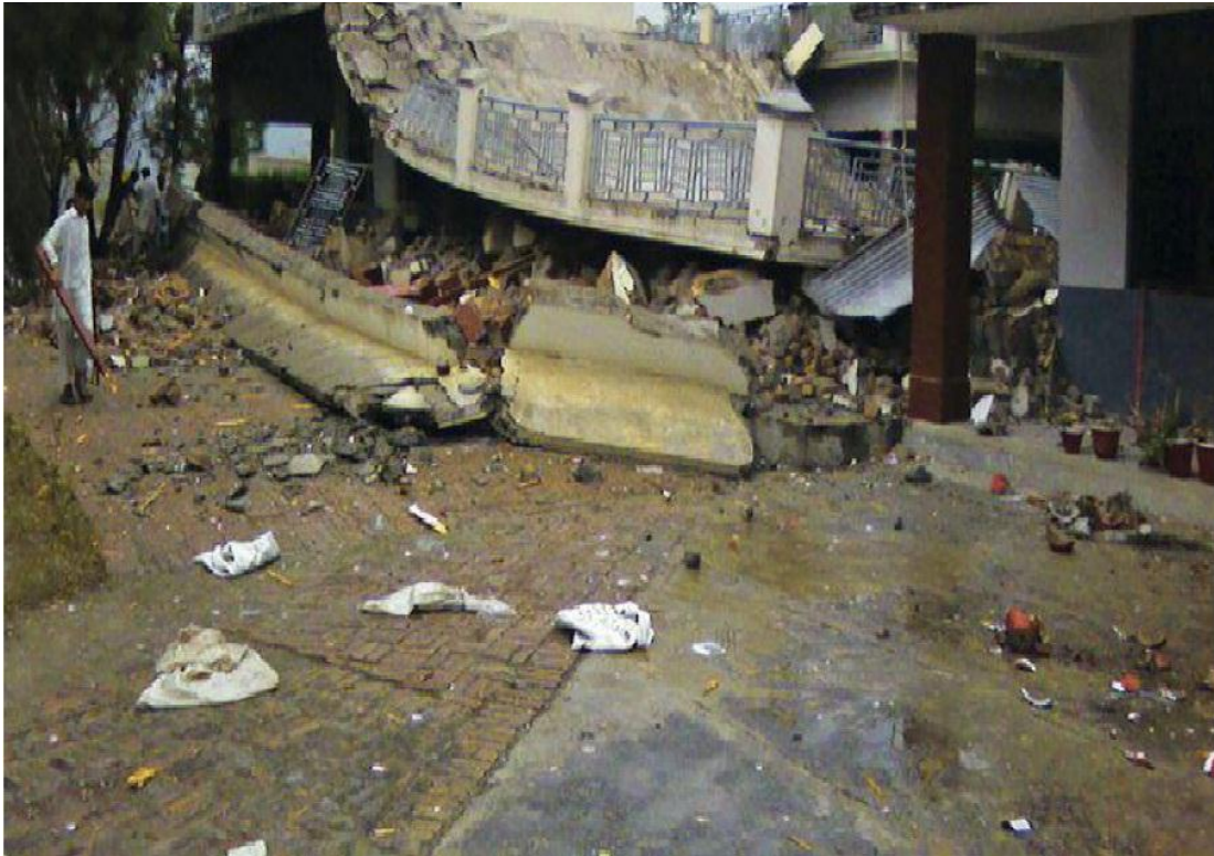
El atentado contra una escuela (Yousafzai 2012)

Después de ello hubo una paz relativa en 2009 por el acuerdo entre el gobierno y los talibanes con la implantación de la Sharia en todo Swat, pero poco después los talibanes recrudecieron sus acciones y se desplazaron hacia todos los distritos de la provincia de Khyber Pakhtunkhwa retransmitiendo los sermones desde las mezquitas para llamar a los jóvenes a unirse a ellos.