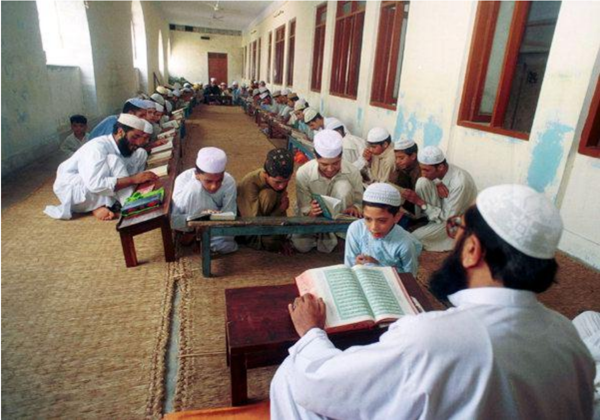
En una madraza

Por ello la formación religiosa en las madrazas son una parte significativa de la ecuación del conflicto que conllevaron a la situación vulnerable de la mujer porque produjeron fundamentalistas islámicos.