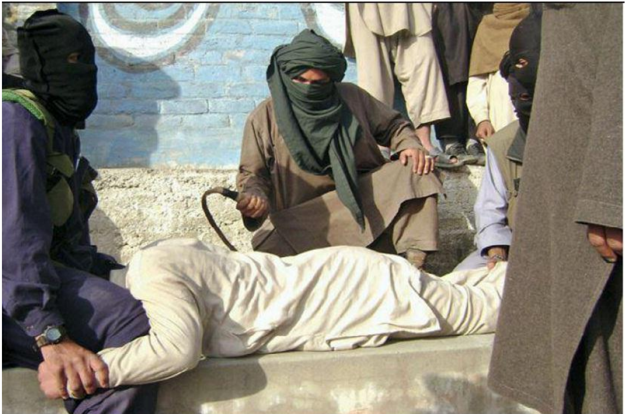
Los talibanes en una flagelación pública (Yousafzai 2012)

Otras acciones fueron que los talibanes cerraron las peluquerías, las tiendas de cds y dvds, prohibieron a los hombres afeitarse, a que la gente se deshiciera de sus televisores y computadoras, incluso otras acciones más severas fueron las flagelaciones públicas.