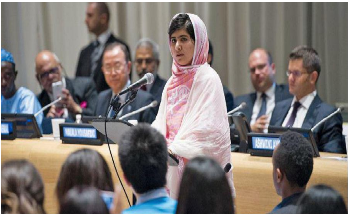
El discurso de Malala en la ONU en defensa de los derechos de las niñas a la educación