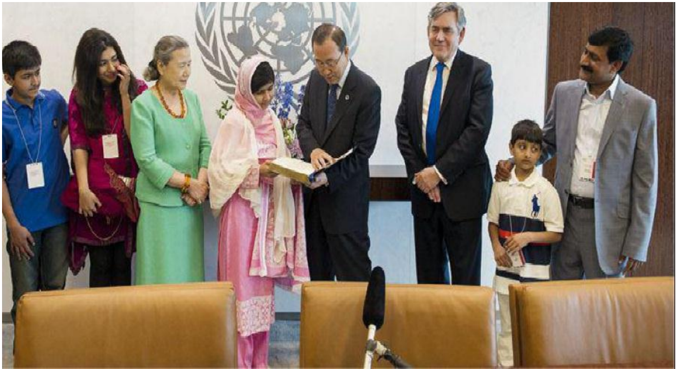
Malala en la ONU con Ban Ki-moon (Yousafzai 2012)