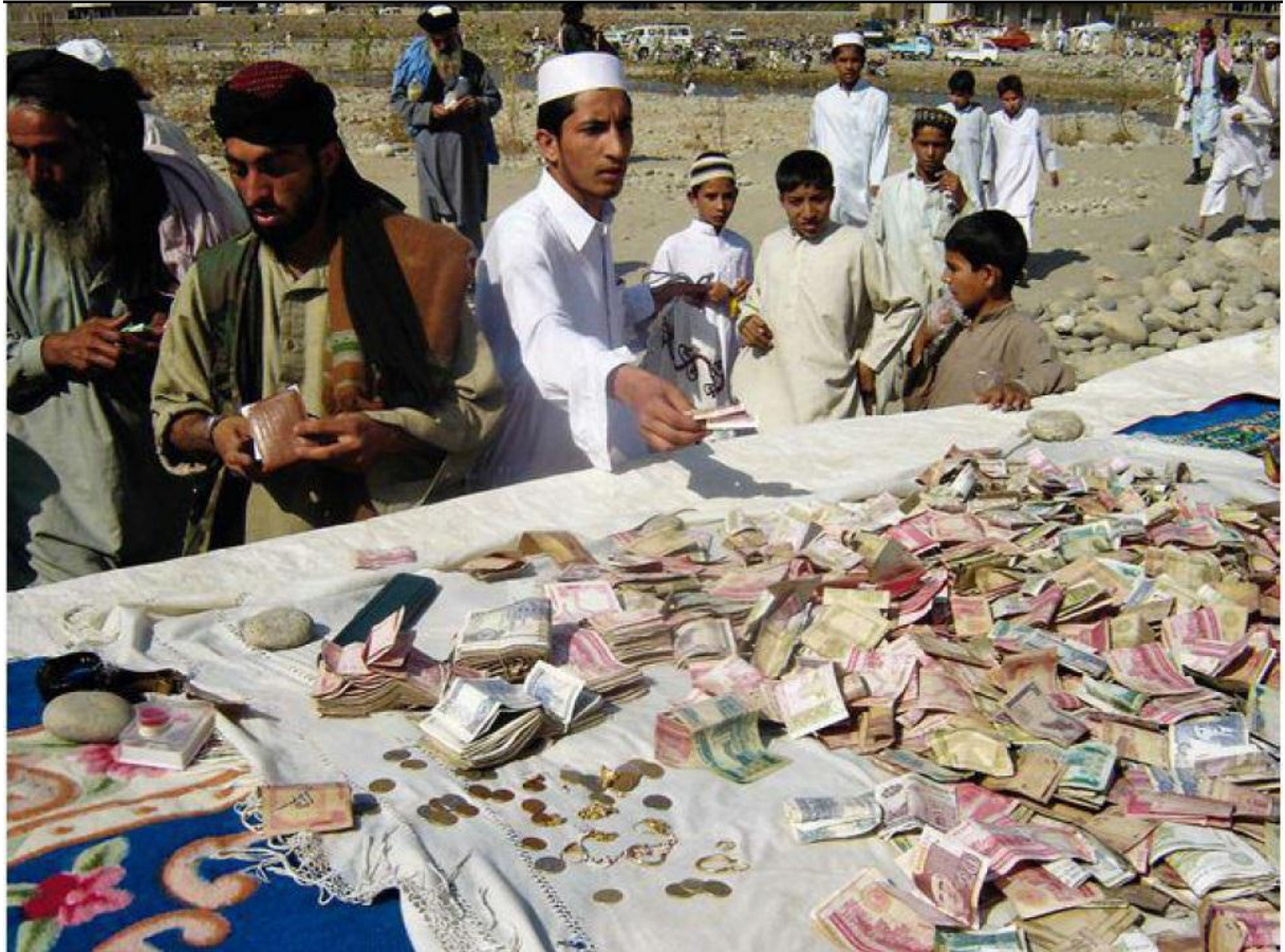
El apoyo económico a Fazlullah para la creación de madrazas (Yousafzai 2012)

El problema comenzó cuando Fazlullah hacía emisiones dirigidas a las mujeres para señalar su obligaciones y limitaciones; entre ellas, que debían cumplir con sus responsabilidades en el hogar, que debían limitarse en salir de sus hogares salvo en caso de emergencia y acompañada de un hombre de la familia y de llevar velo, que más tarde establecieron la utilización de la burka 22 .