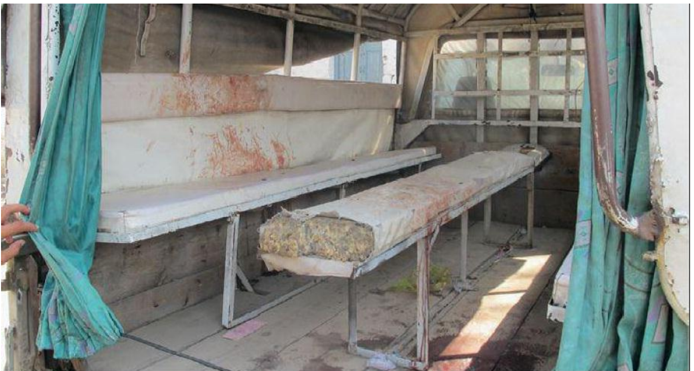
El autobús en el que le dispararon (Yousafzai 2012)

La vida le cambiaría completamente el 9 de octubre de 2012 cuando en una tarde los talibanes interceptaron el autobús del colegio y le dispararon en el lado izquierdo de la cabeza, lastimaron a otras dos niñas. Malala estuvo gravemente herida bajo un estado realmente crítico, pese a ello Malala tuvo excelente recuperación en un hospital en Birmingham en el Reino Unido.