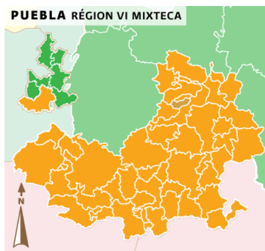
Figura II: INAFED, 2016. Localización de Santa Catarina Tlaltémpam en la región de la mixteca poblana 18 .

El municipio de Santa Catarina Tlaltémpam se encuentra localizado en la parte centro-sur del Estado de Puebla. Sus coordenadas geográficas son los paralelos 18°36'24" y 18°39'00" de latitud norte, y los meridianos 98°03'36" y 98°08'18" de longitud occidental. Teniendo colindancia al norte con Huatlatlauca y Chigmecatitlán, al sur con Zacapala, y al poniente con Huatlatlauca y Coatzingo (INAFED, 2016) 17 .