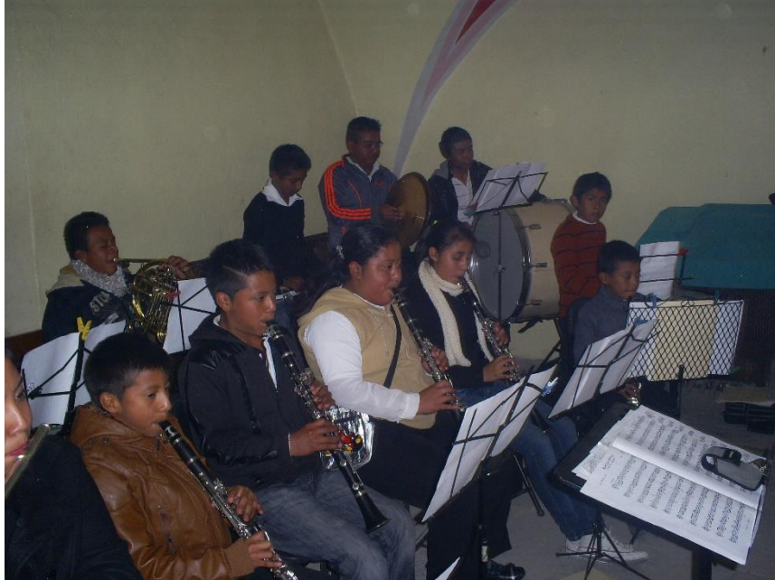
Figura IX. Santa Catarina Tlaltempan, 2015. La banda infantil tocando por primera vez en La serenata, fiesta de mayor importancia en Santa Catarina Tlaltempan y que es el punto cúspide de la integración y reconocimiento de la banda infantil.