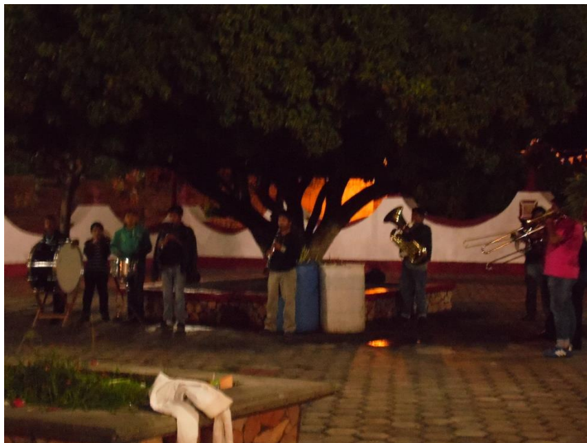
Figura IV. Santa Catarina Tlaltempan, 2014. Una de las bandas longevas en Santa Catarina Tlaltempan es la Banda Zaragoza, una fracción de la banda toca en la explanada de la iglesia del municipio previa a peregrinación interna. Muestra de que las bandas de viento tienen gran importancia en las festividades, tanto cívicas como religiosas.