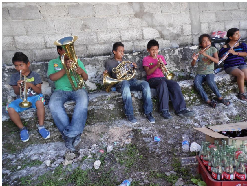
Figura VI. Santa Catarina Tlaltempan, 2014. Una fracción de la banda infantil que está tocando en una levantada de cruz. A pesar de ser una banda conformada por niños ésta comienzan a tener mayor participación en los eventos dentro del municipio.