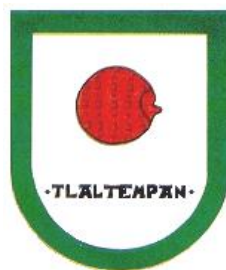
Figura I. INAFED, 2016. Escudo del Municipio de Santa Catarina Tlaltempan 16

El significado de Tlalteman quiere decir “en la orilla de la tierra” y proviene de las voces Náhuas Tlalli= Tierra, Tentli= Labio u Orilla y Pan= Sobre o En (INAFED, 2016). Con respecto al glifo de su fundación, hace referencia a la tierra y su ubicación en ella, es decir, que se encuentra en la orilla.