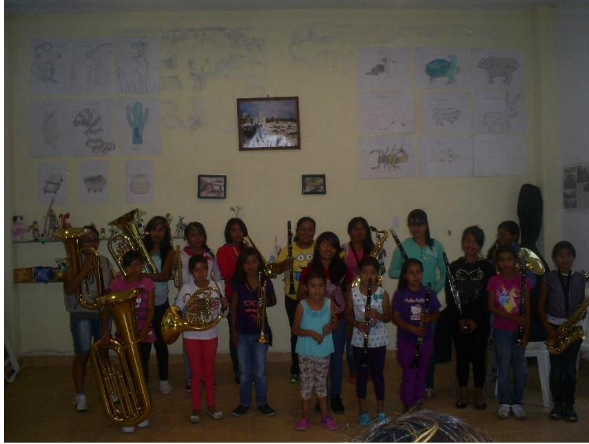
Figura XIII. Santa Catarina Tlaltempan, 2015. En esta investigación se ha mencionado que la música es una práctica exclusiva de hombres, y que recientemente las mujeres se comienzan a integrar, muestra de ello es la primera banda de viento femenil en Santa Catarina Tlaltempan. Lamentablemente el proyecto no duró y la banda se disgregó, aunque muchas de las niñas aún siguen participando en la banda infantil. Agradezco a Vicente Flores por proporcionar este material fotográfico.