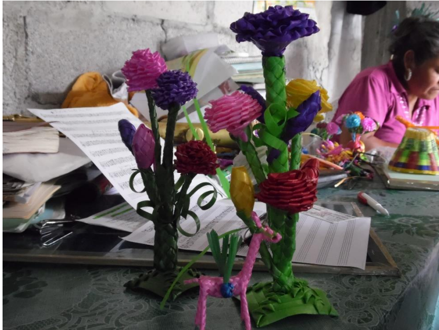
Figura I. Santa Catarina Tlaltempan, 2014. La imagen muestra las dos principales fuentes de trabajo del municipio, la música y la rafia. La primera de ellas tiene un gran peso dentro del municipio al grado que su reproducción y percepción ha llegado a la banda infantil.