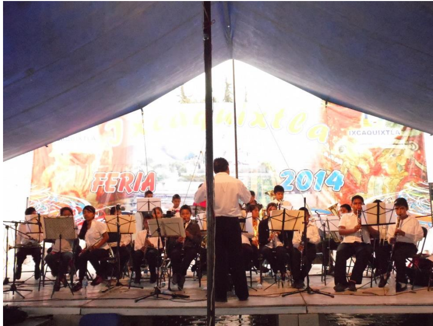
Figura VII. San Juan Ixcaquixtla, 2014. La banda infantil no solamente toca en los eventos dentro del municipio, expande sus fronteras al grado de participar en festividades de localidades cercanas o donde son llamados. Muestra de la influencia que ha generado a través de prácticas musicales y reconocimiento de manera interna como externa del municipio.