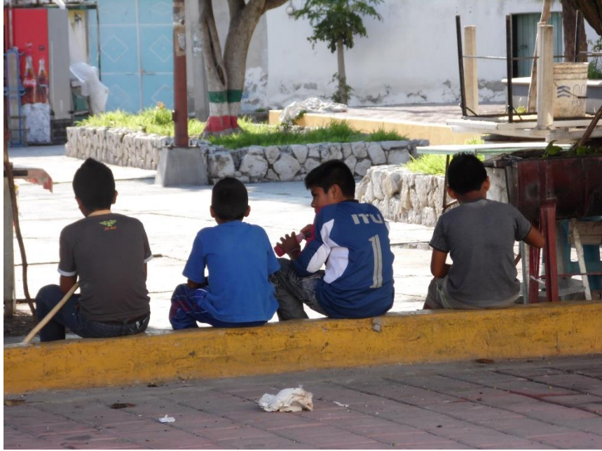
Figura V. Santa Catarina Tlaltempan, 2014. Una muestra de que los niños de la banda infantil se reúnen entre ellos en los periodos de descanso del ensayo. Los grupos suelen ser variados, ya que a veces suelen ser puros niños o niños con niñas.