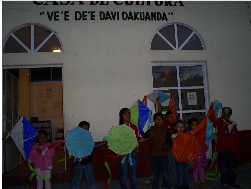
Figura XI. Santa Catarina Tlaltēpan, 2013. Dentro de Casa de cultura las actividades varían, no solamente son los ensayos, la misma banda integra diferentes actividades que van desde el aprendizaje del mixteco hasta actividades manuales, actividades que solamente participaban los integrantes de la banda infantil. Posteriormente solo se enfocó en los ensayos de la banda.