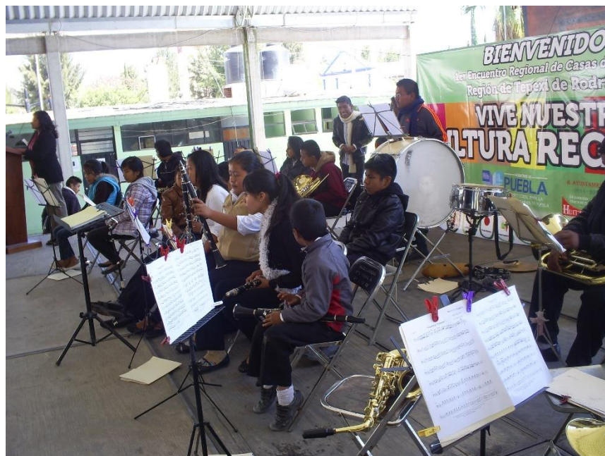
Figura XII. Tepexi de Rodríguez, 2015. La banda infantil con el tiempo genera prestigio y reconocimiento, mismo que le ha permitido participar en diferentes actividades fuera de Santa Catarina Tlaltempan, tal es el caso de la fotografía donde la banda infantil toca en un concurso regional de Casas de Cultura, celebrado en Tepexi de Rodríguez.