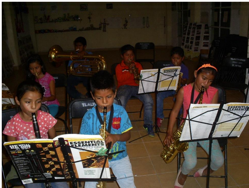
Figura X. Santa Catarina Tlaltempan, 2015. En la siguiente fotografía se puede mostrar a la banda infantil utilizando el capital cultural objetivado reflejado a través de libros de técnica y práctica instrumental. Entre mejor dominen su instrumento, mayores serán las oportunidades de adquirir prestigio tanto dentro como fuera de la banda infantil. Agradezco a Vicente Flores por proporcionar este material fotográfico. Agradezco a Vicente Flores por proporcionar este material fotográfico.