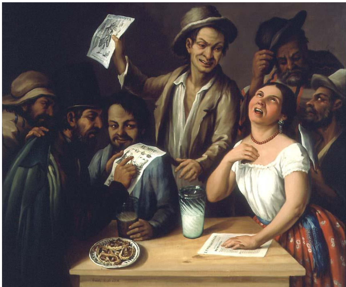
Figura 1: Arrieta Agustín, 1851, Tertulia en Pulquería , (óleo sobre lienzo), Museo Soumaya, México.

propios del espacio público de una pulquería, estaban prohibidos por las autoridades poblanas desde hacía décadas.