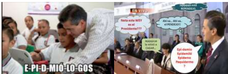
Imagen 5: Memes Epidemiólogo

El 23 de octubre con motivo del 70 aniversario de la Secretaría de Salud y la conmemoración del Día del Médico, el mandatario tuvo problemas para decir “epidemiólogos” y después apuntó: “...una disculpa por este trabalenguas que me he encontrado en el discurso.” 153