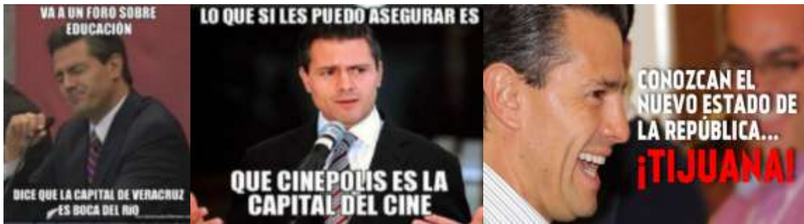
Imagen 4: Memes capitales