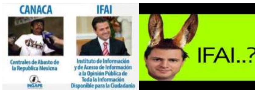
Imagen 6: Memes IFAI