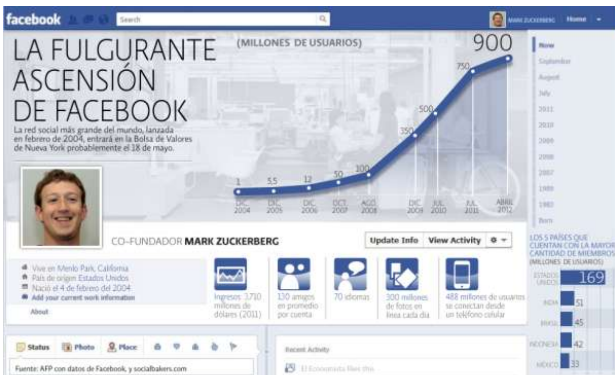
Imagen 3: Facebook llega a la bolsa