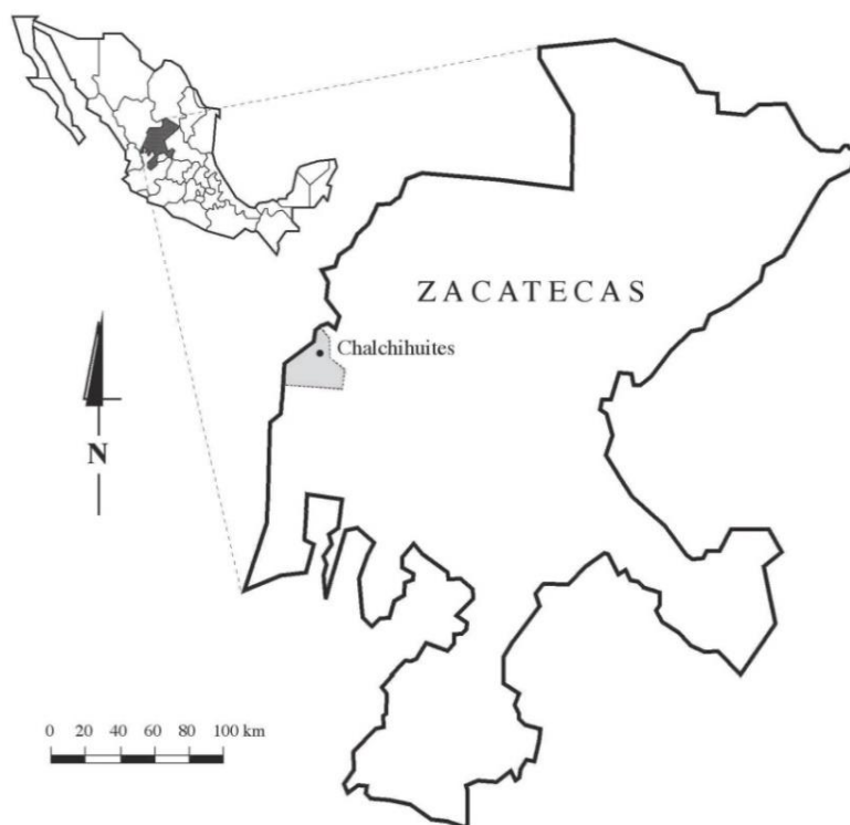
Mapa 1. Ubicación geográfica del municipio de Chalchihuites, Zacatecas.

Las principales actividades económicas en el municipio son la agricultura, la ganadería, el comercio y la minería. Asimismo, es importante mencionar el papel trascendental de las remesas en la economía del municipio, lo cual evidencia la fuerte intensidad migratoria laboral hacia Estados Unidos. Chalchihuites sobresale a nivel estatal como uno de los municipios emisores de mano de obra joven hacia Estados Unidos, hasta el punto que hoy en día la población chalchihuitense residente en el extranjero supera al número de habitantes que residen en el municipio (INEGI, 2015).