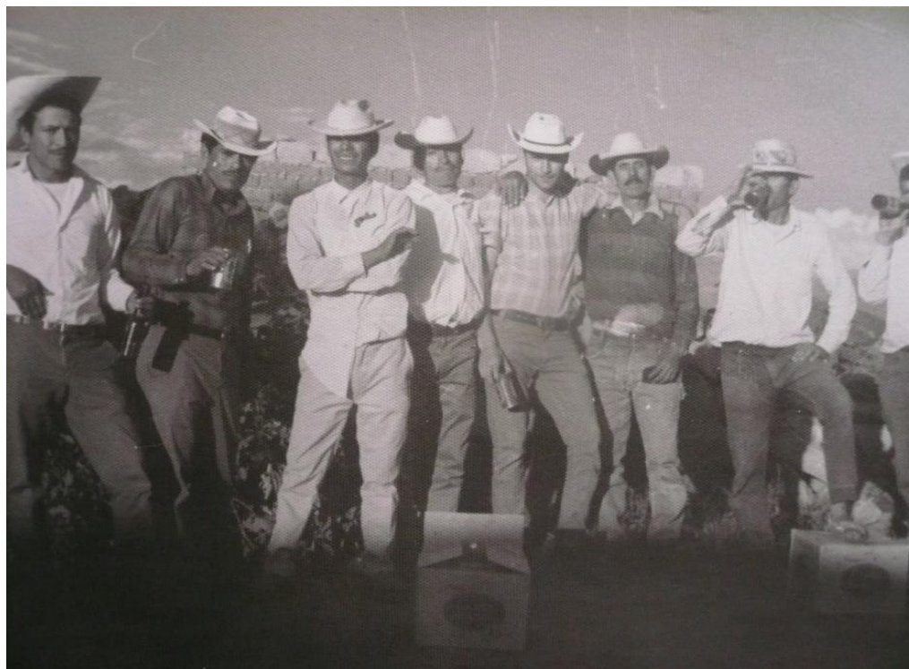
Foto 8. Ex braceros del Ojo del Toro, Chalchihuites, en un coleadero. (Ca. 1965).