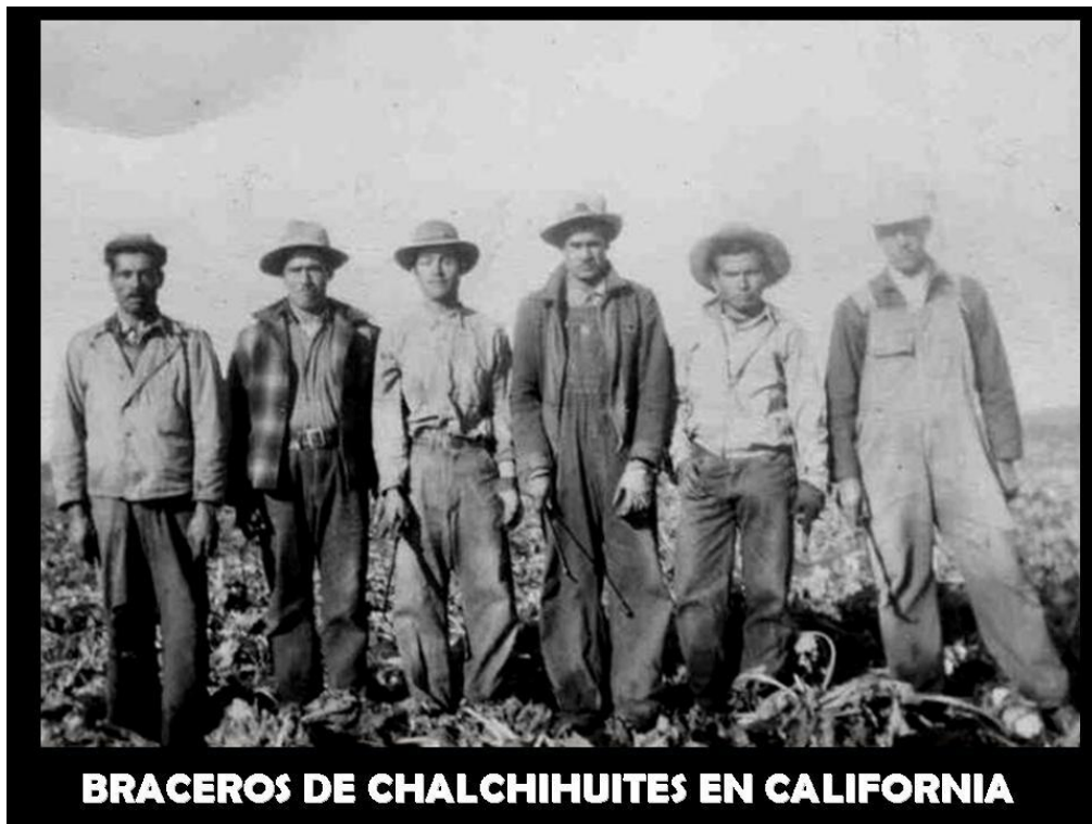
Foto 1. Braceros de Chalchihuites en los campos agrícolas de California. (Ca. 1945).