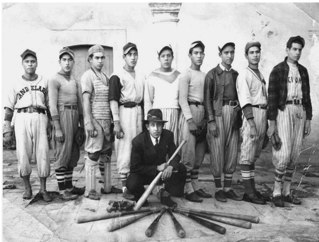
Foto 2. Uno de los primeros equipos representativos de beisbol del municipio de Chalchihuites. (Ca. 1945).

De esta manera, todos los entrevistados recuerdan haber practicado este deporte en algún momento de su infancia y/o juventud. Unos de forma más profesional, otros con reglas e integrado a un equipo rudimentario, otros como un simple juego de niños que actualmente se sigue practicando en el municipio el cual se conoce como “la pichada”, una palabra derivada del anglicismo pitcher , que es el nombre del jugador que en el beisbol lanza la pelota hacia la base, tratando de que el bateador del equipo opuesto no logre golpearla, sino que más bien sea el catcher de su equipo quien atrape la pelota.